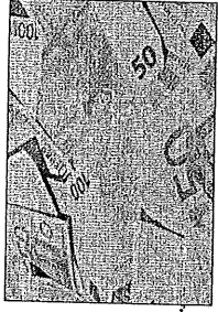
Economia ancora in crisi