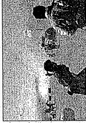
Ernesimo attentato in Afghanistan