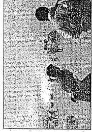
Entesimo attentato in Afghanistan

Sette militari italiani feriti in un attentato in Afghanistan