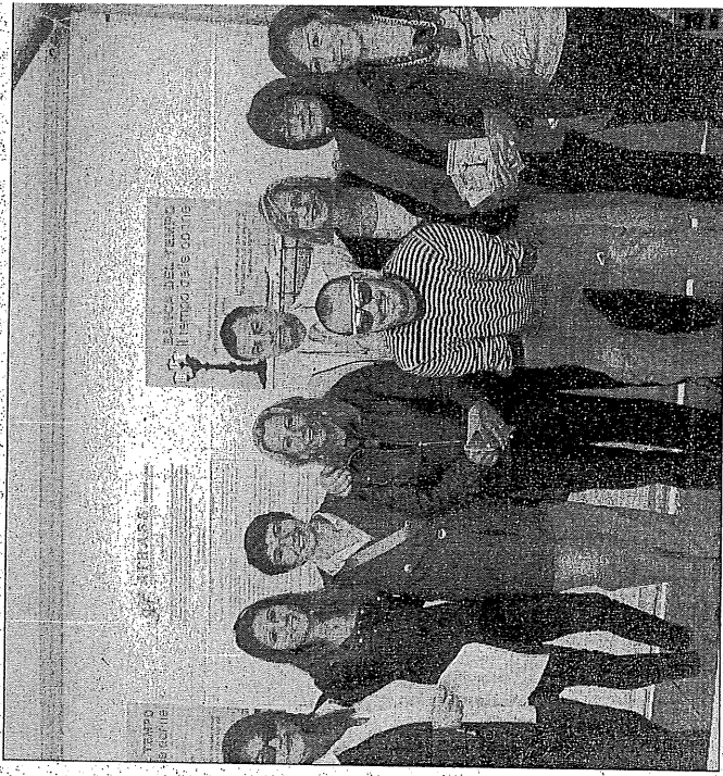
Il gruppo fondatore della "Banca del tempo". In alto una locandina dell'iniziativa