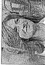
Maria Stella Gelmini

Proteste a scuola: la Gelmini convoca gli studenti