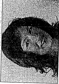
Il ministro Mariastella Gelmini