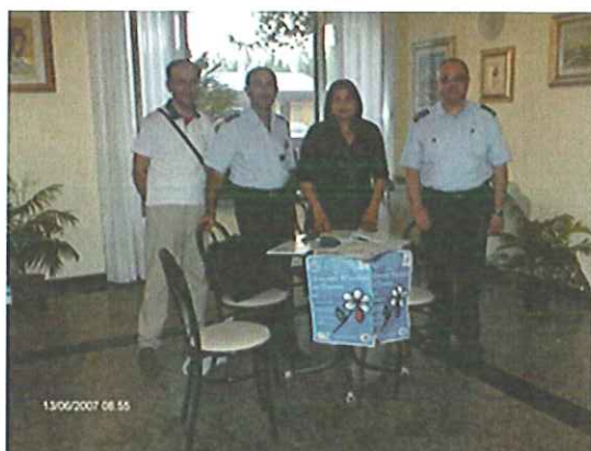
La Fidas e il Circolo Sottufficiali