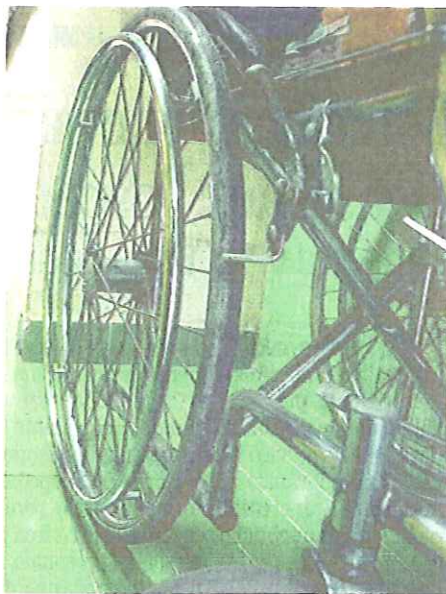
DISABILI Fondi per eliminare le barriere