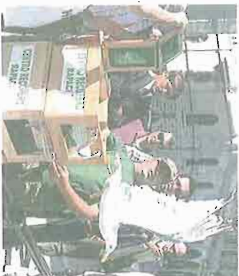
MOMENTO EMOCIONANTE! I gabbiani liberalati sul lungomare davanti alla Regione [foto inglese]

È stata notata, ad esempio, una sensibile riduzione di soggetti affetti da sindrome botulino-simile rispetto agli anni precedenti, dato sensibile che rivela un miglioramento della gestione ambientale poiché si tratta di patologie legate alla eutrofizzazione delle acque. «Continueremo - sottolinea Stefano - in questo impegno che consideriamo prioritario perché riguarda la salute di tutti i cittadini e la salvaguardia del nostro ecosistema, patrimonio comune a tutti i pugliesi».