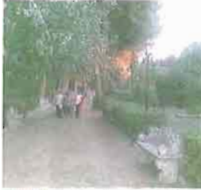
ADDIO Il giardino «Veneziani Santonio»