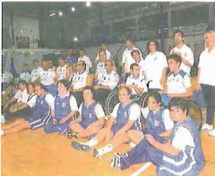
HBARI 2003 La presentazione della squadra o dei ragazzi al PalaLaforgia del S. Paolo