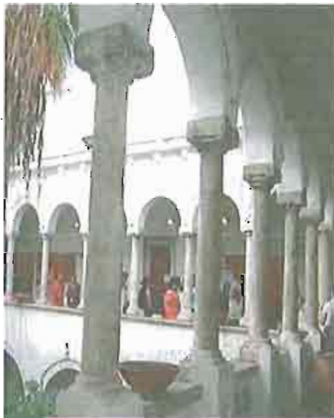
MODUGNO L'interno del Palazzo comunale

Il compenso percepito dalle donne del servizio civico è commisurato a 6 euro all'ora. Una somma che porterà un piccolo sorriso in 28 famiglie, in attesa di tempi migliori. D'altra parte, persone bisognose, anziane o sofferenti riceveranno assistenza e compagnia adeguate, dal «drappello» dei nuovi angeli custodi.