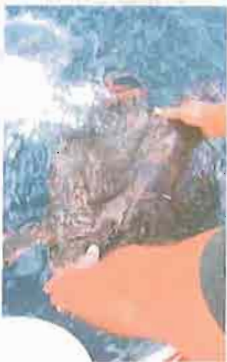
MOLFETTA Una tartaruga liberata