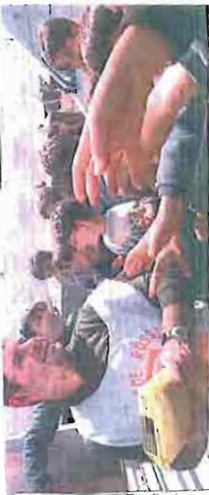
Qui o sotto, due foto di intervento medico in Albania o in Kosovo. Nella foto piccola, una «corazzata» volta un campo romano in Italia

... casu, i problemi "mocratici" che coll'assunzione altri proporzioni, e per le vie nuove convoliti, che per il rapporto di lavoro. Che mi sembra sempre più una terra