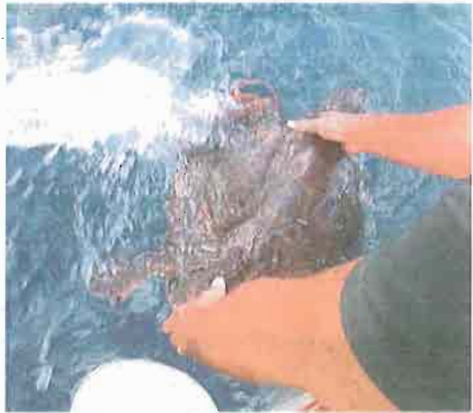
MOLFETTA Una tartaruga liberata in mare

Il trasferimento del Centro tartarughe in altra sede, più ampia, era stato già programmato. Tanto che, nei giorni scorsi, nei locali messi a disposizione dall'Ipsiam «Vespucchi», che si è offerto di