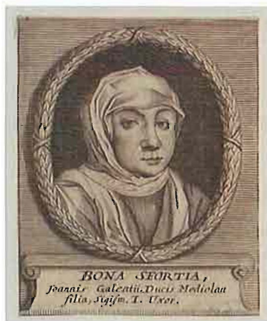
Bona Sforza