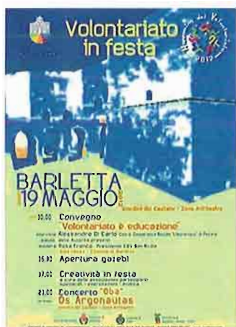
Festa del Volontariato

La festa Itinerante del volontariato, organizzata dal Centro di Servizio al Volontariato “San Nicola”, anche quest’anno riprende il suo cammino. Sabato 19 maggio, a Barletta, si parte con la Vª edizione dell’Happening del Volontariato.