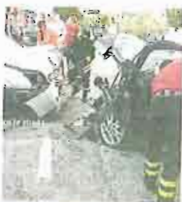
SULLA STRADA Un incidente

● Inizierà con un flash mob in piazza Prefettura la seconda Giornata sulla sicurezza stradale, diventata ormai un appuntamento fisso per la città. L'iniziativa è realizzata grazie alla ormai consolidata partnership tra amministrazione comunale e fondazione «Ciao Vinny». Seguirà, alle 18,50 la simulazione di un incidente stradale con la partecipazione di vigili del fuoco, polizia municipale, polizia stradale, carabinieri e 118.