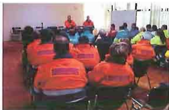
I volontari della Misericordia

Partirà da domani, venerdì 25 maggio il programma di esercitazione di protezione civile che vedrà interessate diverse zone del territorio andriese fino a domenica 27.