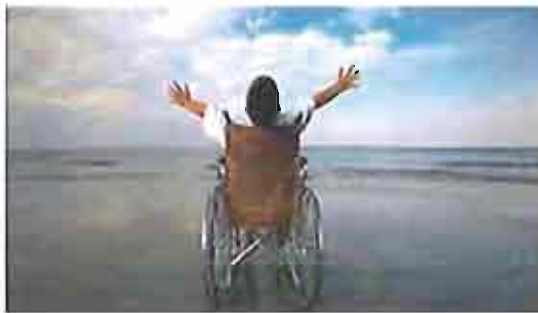
Campi solari 2012

Scade domani, mercoledì 23 maggio, alle ore 12, il termine ultimo per la presentazione delle domande relative ai campi solari 2012 organizzati dal settore Socio Sanitario del Comune di Andria.