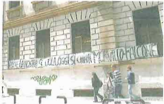
Ventennale della strage di Capaci e cordoglio per l'attentato di Brindisi

Domani sono in calendario una serie di eventi. Alle 9.30 la deposizione di una corona in memoria dei caduti in via Borsellino e Falcone. Alle 10 un'assemblea studentesca e una rappresentazione teatrale nell'auditorium della scuola primaria Giovanni Falcone di Catino. Alle 12 l'apposizione di targhe in memoria delle vittime della strage di Ca-