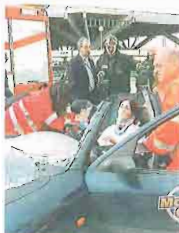
PRIMO SOCCORSO Una simulazione di incidente

In scena la simulazione di un incidente e l'organizzazione dei soccorsi