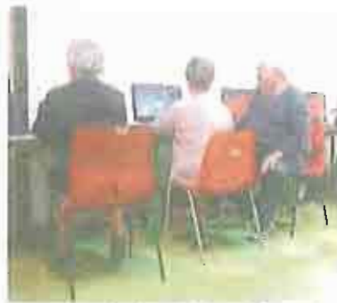
MOLFETTA Anziani a lezione di computer