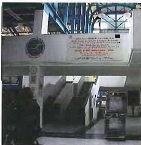
Istituto tecnico dell'olio bisceglie

Quasi quattromila persone hanno partecipato nei giorni scorsi a Foggia alla seconda edizione di InnovAbilla, il Festival delle Innovazioni per le diverse abilità e la qualità della vita, organizzato dall'Assessorato al Welfare della Regione Puglia e dall'ARTI, l'Agenzia regionale per la tecnologia e l'innovazione, in collaborazione con l'Assessorato regionale allo Sviluppo economico. Con oltre quaranta eventi tra convegni, workshop e spettacoli e più di cinquanta espositori su una superficie di circa diecimila metri quadri, nel quartiere fieristico, la tre giorni di InnovAbilla si conferma l'appuntamento di settore più prestigioso nel Sud Italia. Lo rende noto un comunicato diffuso dalla Regione Puglia.