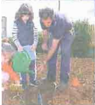
QUARTIERE SAN PAOLO L'inaugurazione dell'orto sociale, 200 metri quadrati di educazione e di verde