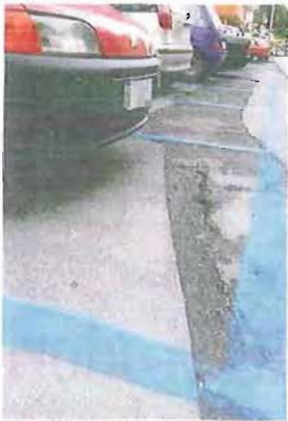
PARCHEGGI Gratis per i disabili

Se i posti riservati ai portatori di handicap sono occupati, via libera anche negli spazi blu