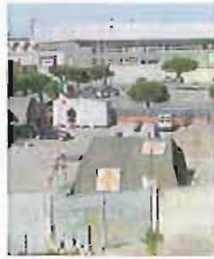
La tendopoli della Croce Rossa