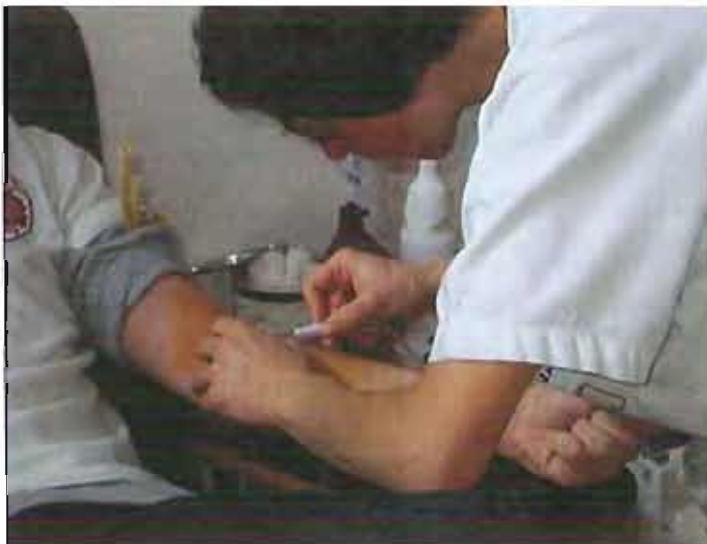
Donatori di sangue

E' possibile prenotarsi inviando una email all'indirizzo info@aviscorato.it o corato.comunale@avis.it oppure chiamando il numero di telefono 080.8724178 dalle 17.00 alle 20.30.