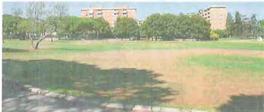
ZONA A RISCHIO Una veduta di Parco Due Giugno. In basso, un'operazione della polizia nel giardino

L'ANALISI SEMPRE PIÙ COINVOLVE LE DONNE. SI TRATTA DI RAGAZZE SPAVALDE, ARROGANTI E MOLTO AGGRESSIVE