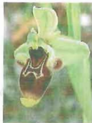
GARGANO Orchidea «foggiana»

C' è ancora qualche giorno per partecipare al primo concorso fotografico «Uno Scatto di Natura» organizzato da Auchan e Wwf Italia. Tutti gli appassionati di fotografia potranno caricare fino al 23 settembre sul sito www.scattodinatura.auchan.it le proprie fotografie aventi come soggetto la natura in tutte le sue declinazioni. La giuria sceglierà entro il 28 settembre le foto migliori e selezionerà 130 partecipanti, 10 per ognuna delle 13 Oasi Wwf adottate da Auchan dal 2010.