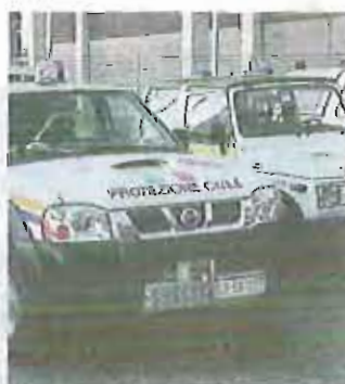
Fondi per Triggiano e Capurso