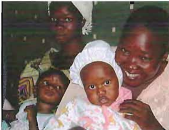
Donne e bimbi extracomunitari