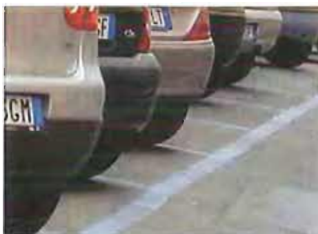
Parcheggi di sosta a pagamento

Dopo diversi incontri di lavoro tra la Cooperativa Sociale Sant'Erasmo, la Polizia Municipale e il Sindaco Prof. Michele D'Ambrosio, dal 24 settembre 2012 entrerà in vigore la Direttiva datata 13 Agosto in merito alla possibilità per i possessori dell'apposito contrassegno, regolarmente rilasciato dalle ASL competenti, di parcheggiare gratuitamente negli spazi blu, quindi normalmente a pagamento, qualora gli appositi spazi gialli fossero già occupati.