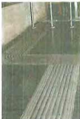
BARI Il percorso all'Ipercoop