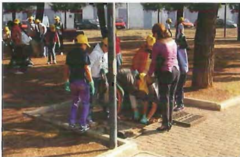
pullamo il mondo

S i terrà domani alle ore 20 presso la sede di Legambiente di Corato in via Santorno, il secondo incontro organizzativo della XX edizione di "Pullamo il Mondo".