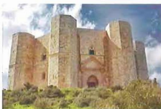
Castel del Monte

Il 28, 29 e 30 settembre in Puglia tantissimi cittadini si daranno appuntamento per trascorre insieme un week-end ambientalista che li vedrà impegnati a ripulire e recuperare aree degradate attraverso azioni sostenibili volte alla raccolta dei rifiuti abbandonati. Nel corso della tre giorni i volontari saranno coinvolti in importanti azioni di riqualificazione delle aree urbane per valorizzare e preservare gli ambienti naturali dall'abbandono dei rifiuti.