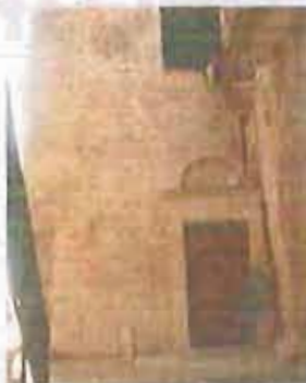
L'appuntamento al Carmine