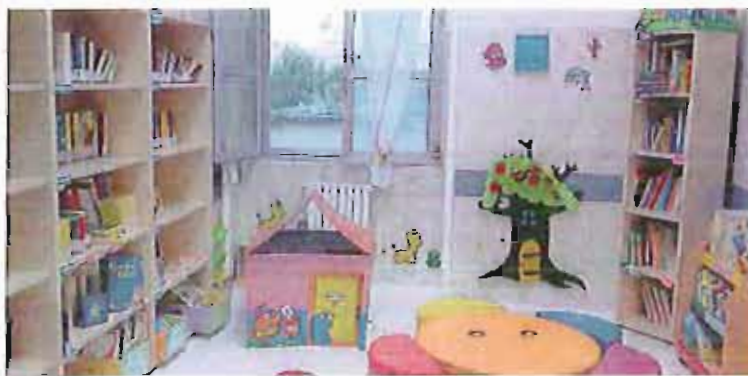
■ L'interno della biblioteca nel reparto di Pediatria del Policlinico