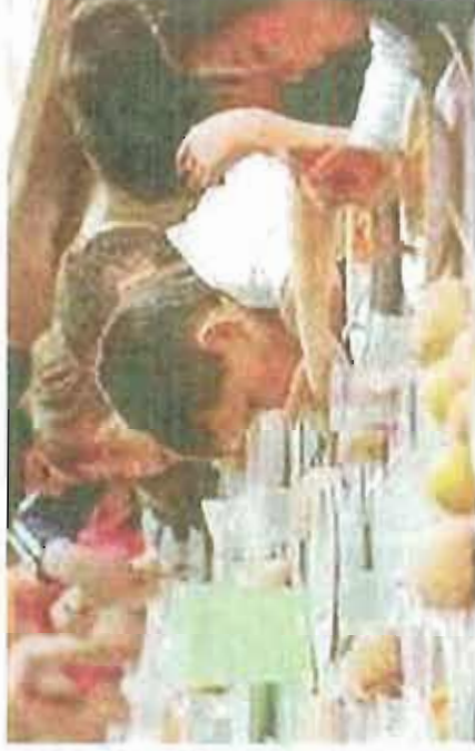
GLI ALUNNI A TAVOLA. Al posto della plastica, posate in acciaio e acqua dai rubinetti

«Il nostro obiettivo - aggiunge Losito - è incentivare il consumo dell'acqua pubblica e l'utilizzo di