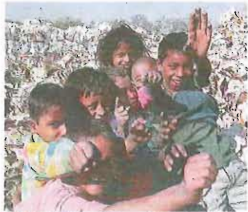
PER AIUTARLI Bimbi del cosiddetto «Terzo Mondo»