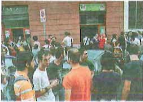
TENSIONE Un momento dell'incontro

Insulti tra opposte fazioni e una vetrata rotta con un pugno: alla fine arriva la Digos