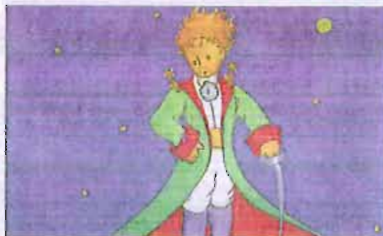
FESTA DEL LIBRO E GHIACCATE PATRUSIANO Il castello svevo di Bari in cui si svolgono alcune iniziative. Accanto, il tema della Festa del libro, «Il Piccolo principe»

programma visite guidate gratuite, sabato 18.30 - 20.00 - 21.30. Ecco il programma di appuntamenti a Monopoli, con le visite al castello di Carlo V, ai musei della cattedrale.