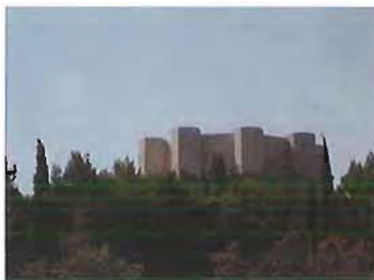
Castel del Monte

A tutti i partecipanti sarà distribuito il kit consistente di guanti, cappellino e maglia. L'iniziativa rientra in "Puliamo il Mondo 2012", versione italiana del più grande evento di volontariato ambientale nel mondo, festeggia i suoi vent'anni.