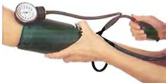
Rilevazione della pressione arteriosa

14, effettuerà la rilevazione della pressione arteriosa.