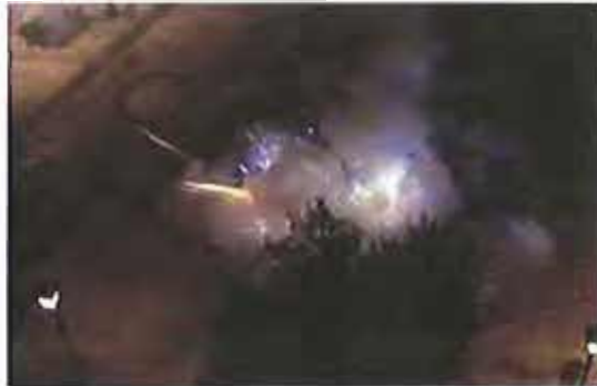
Botti selvaggi in piazza Paradiso MolfettaLive.it

"Pericolosi per l'uomo, sono spesso mortali per gli animali, non solo cani e gatti ma anche uccelli e animali selvatici. Infatti essi dispongono di una sensibilità uditiva talmente sviluppata che il rumore provocato dallo scoppio dei fuochi artificiali e dei petardi causa loro un vero e proprio trauma".