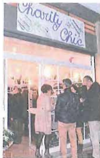
IERI SERA L'inaugurazione