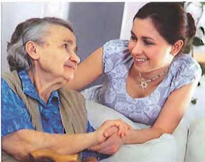
Assistenza agli anziani

A seguito delle rilevazioni effettuate dal Comune sulla popolazione anziana e sulle rispettive famiglie, i volontari del servizio civile nazionale hanno proposto molteplici attività, tra le quali tornei di burraco, laboratori di cinema, laboratori ludico-ricreativi, laboratori di lettura, conoscenza del territorio e attività di sensibilizzazione.