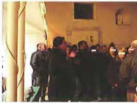
casa accoglienza n.c.

"Perché io ho avuto fame e mi avete dato da mangiare, ho avuto sete e mi avete dato da bere; ero forestiero e mi avete ospitato, nudo e mi avete vestito, malato e mi avete visitato, carcerato e siete venuti a trovarmi.... In verità vi dico: ogni volta che avete fatto queste cose a uno solo di questi miei fratelli più piccoli, l'avete fatto a me" (Mt. 25, 35-36 ss.)