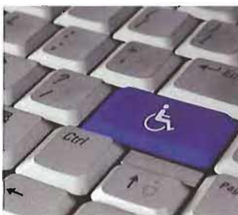
Postazione computer per disabili

Lo rende noto un comunicato a firma dell'assessore alla Cultura del Comune di Trani, Salvatore Nardò, nel quale si precisa che la postazione è costituita da un macchinario MAESTRO PLUS - MACCHINA DI LETTURA E SINTESI VOCALE corredata di MONITOR e tastiera FACILITATA.