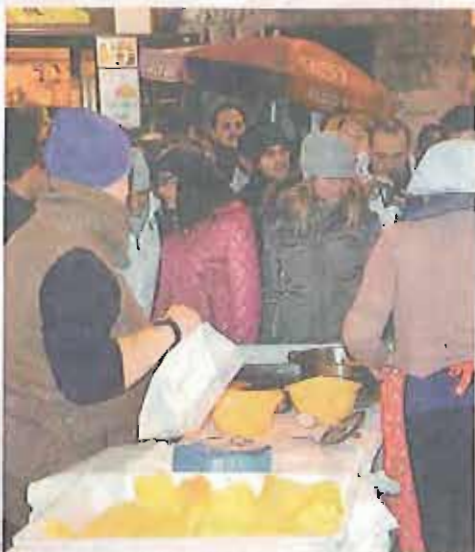
IL CALDO DELLA FEDE Il rituale delle «sgaglioze» fa da sfondo alla fredda alba di ieri dedicata alla devozione al Santo protettore della città

L'assessorato al Welfare lancia un ricco cartellone di spettacoli e mercatini