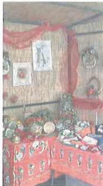
BITONTO Un mercatino natalizio

ENOGASTROMIA - Due gli appuntamenti di enogastronomia da non perdere. Giovedì 13, le strade del centro storico ospitano «La corte dell'olio», con degustazioni di prodotti da forno, falo di Santa Lucia e musica popolare. Nel giorno dell'antiviglija, domenica 23, i produttori biologici della Rete dell'economia solidale del Sud proporranno il loro mercato di orlofrutta in tutto il centro storico, da piazza Cayour a piazza Cattedrale.