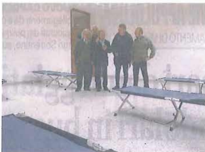
IL RIFUGIO PER I SENZATELTO È stato allestito dalla Provincia nel palazzo del Provveditorato

EMERGENZA FREDDO LA PROVINCIA ACCOGLIE LA RICHIESTA DI AIUTO DELL'ASSOCIAZIONE INCONTRA. SETTANTA POSTI LETTO NELL'IMMOBILE DI VIA RE DAVID