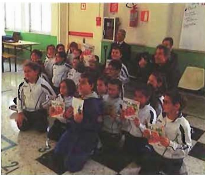
Studenti coinvolti nel progetto "Afasia a scuola".