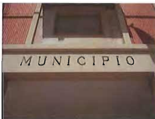
Il Comune di Giovinazzo

L'associazione regionale Antiracket, quindi, anche a Giovinazzo, vuol rappresentare un punto di riferimento e di raccordo fra le categorie produttive (commercianti, artigiani ed imprenditori), le istituzioni politiche e le forze dell'ordine.