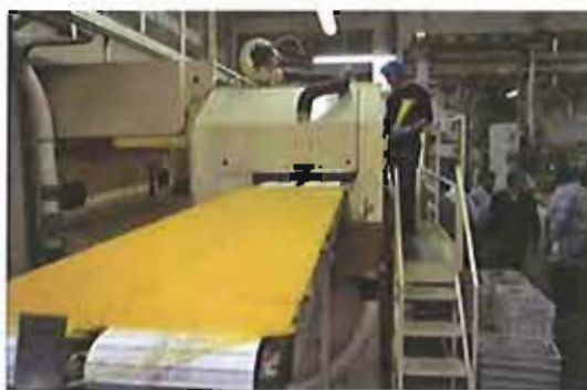
Il pastificio Granoro

In occasione delle manifestazioni legate a “Qoco – Un filo dell'olio nel piatto”, l'azienda Granoro – sponsor tecnico della kermesse sull'olio extravergine d'oliva – sensibilizzata dall'Amministrazione Comunale, ha donato a Casa Accoglienza S. M. Goretti – Ufficio per le Migrazioni un quintale di pasta come segno di vicinanza e di attenzione verso l'opera meritoria posta in essere dalla Diocesi nei confronti delle fasce più deboli e disagiate della popolazione.