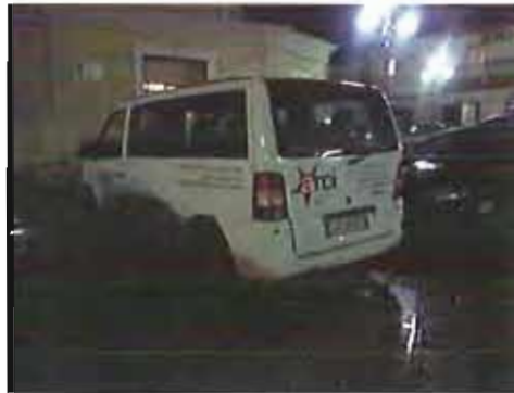
Il Camper dell'Archi

Scopo del progetto è la promozione del dialogo Interculturale, la mediazione sociale, la medicina di strada, l'ascolto e l'informazione, con particolare attenzione per i servizi sanitari.