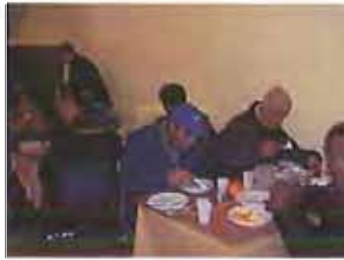
la mensa di Casa Accoglienza S. M. Goretti