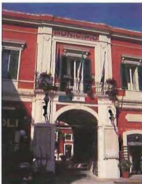
Comune di Monopoli Monopolilive

COLONIA MARINA - Via libera alla realizzazione del servizio di colonia marina "Mare Blu 2013" che prevede la partecipazione di circa 240 minori tra i 6 e gli 11 anni con l'inserimento e l'integrazione di soggetti diversamente abili, articolato in tre moduli della durata di due settimane ciascuno, dal lunedì al venerdì e dalle ore 8,00 alle ore 13,00 per complessivi 30 giorni lavorativi, presso stabilimenti balneari attrezzati del litorale monopolitano.