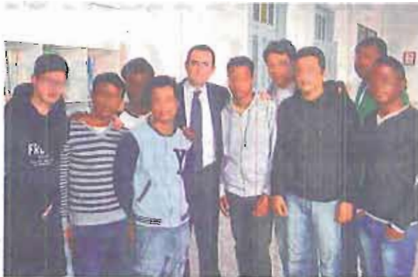
AL REDENTORE La visita del Garante, Spadafora. In alto, scene di approdi

Una compressione voluta, quella di Spadafora e Cirillo a Bari. A dicembre il Ministero dell'Interno e il Garante per l'infanzia hanno firmato un protocollo, nato dalle «ceneri» della recente vicenda del bambino di 10 anni conteso come in un tiro alla fune tra la Polizia e i familiari a Citadella, nel Padovano. L'accordo mira a «individuare le migliori prassi al fine di rendere omogenei i metodi di intervento