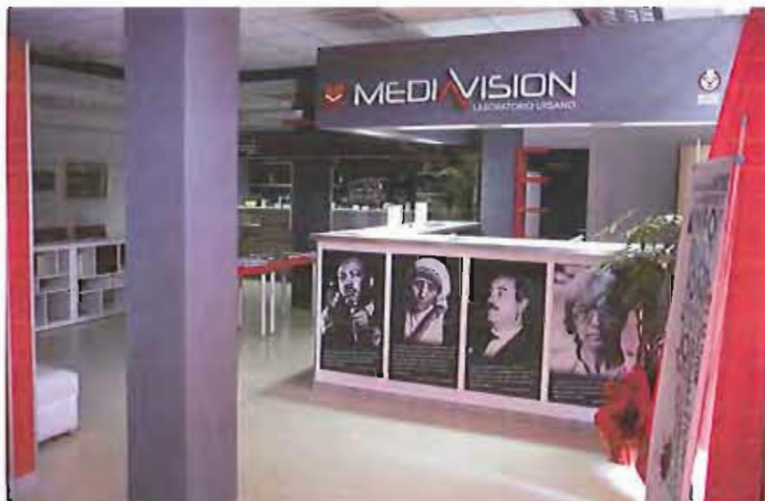
Il Laboratorio Urbano Mediavision di Santeramo Mediavision

Riceviamo ed interamente pubblichiamo un comunicato, pervenuto in Redazione, inoltrato dal Laboratorio Urbano "Mediavision" di Santeramo.