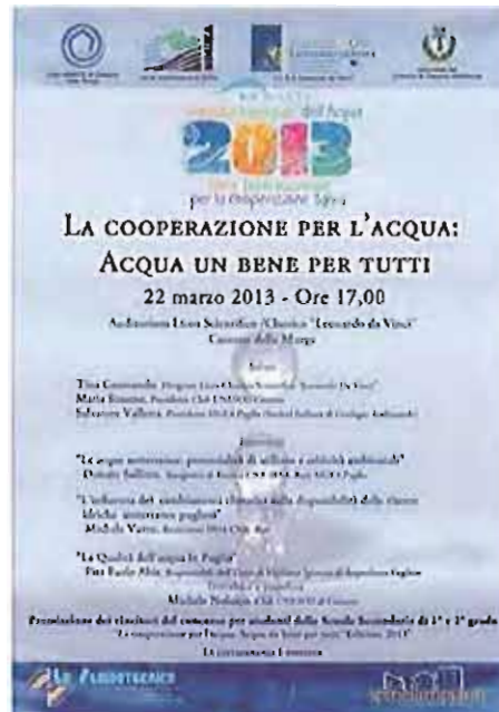
La locandine dell'evento sull'acqua dell'unesco di Cassano Clu Unesco