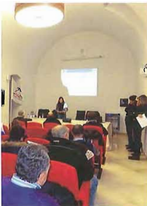
Il Tribunale per i diritti del Malato di Cittadinanzattiva

«Il corso - si legge nella nota diffusa al termine dell'iniziativa - era rivolto agli aderenti che operano all'interno del Movimento, in particolare presso le sedi del "Tribunale per i Diritti del Malato di Cittadinanzattiva", collocate presso i Presidi Ospedalieri della Provincia Bat. I partecipanti, provenienti dalle nove città facenti parte dell'Assemblea (Andria, Barletta, Trani, Bisceglie, Trinitapoli, San Ferdinando di P., Margherita di Savoia, Canosa di P., Spinazzola), entusiasti e soddisfatti dell'iniziativa, hanno avuto l'occasione di migliorare le proprie competenze sulla gestione delle attività di tutela in tutti i suoi aspetti, dalla relazione col cittadino alla gestione dell'area del back-office per i casi più complessi, nonché di conoscere la tecnologia PiT (progetto integrato di tutele). Introdotta per consentire una più efficiente gestione delle segnalazioni che pervengono dai cittadini».