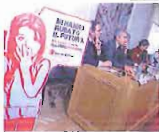
La presentazione della ricerca

fenomeno sono scarsi (gli ultimi risalgono al 2002) e manca un'adeguata mappatura nazionale del lavoro minorile, oggi ancor più critico alla luce dell'impatto della crisi economica. Si inizia anche molto presto, prima degli 11 anni (0,3%), ma è col crescere dell'età che aumenta l'incidenza del fenomeno (3% dei minori 11-13enni), per raggiungere il picco di quasi 2 su 10 (18,4%) tra i 14 e 15 anni, età di passaggio dalla scuola media a quella superiore, nella quale si materializza in Italia uno dei tassi di abbandono scolastico più elevati d'Europa (18,2% contro una media Ue a 27 del 15%).