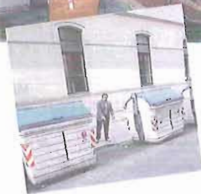
LA «GALLERIA» FOTOGRAFICA DEGLI OSTACOLI PER I DISABILI. I cassonetti e gli stalli-trappola in via Molo e in via Crisanzio; a sinistra, in piazza Unilberto e in via Gorizia