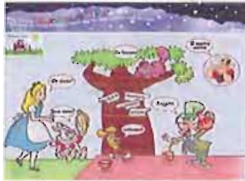
Screenshot del sito dell'associazione. n.c.

«È il caso del "Giardino di Alice" - continua il consigliere - una realtà meravigliosa portata avanti da volontari e da uno staff di professionisti votati a una missione: aiutare ragazzi dislessici che, grazie al contributo delle loro famiglie, possono intraprendere un percorso di recupero che li porterà a essere al passo con gli altri, avendo le stesse possibilità nell'ambito dell'occupazione. Mi ha commosso la lettera che i ragazzi mi hanno voluto dedicare. Mi ha risollevato dalla stanchezza, dallo scoramento per le tante critiche e cattiverie che mi rivolgono, dalla diffamazione meschina che altri aratamente mettono in atto in Regione, dipingendomi agli occhi del Presidente Vendola come "politico impresentabile". Bisognerebbe vivere nel contesto in cui un politico opera, conoscerne la propria storia umana, prima di adottare atteggiamenti di rappresaglia, e giudicare dagli atti compiuti, dalla colpevole assenza dei mass media che mi snobbano per una "scelta editoriale", ma che con un simile atteggiamento non hanno dato voce a queste realtà e a tutti coloro che non conoscono o non sono informati di simili opportunità. La vera informazione deve raccontare i fatti in maniera oggettiva, senza pregiudizio e preconcetto. Continuo a pensare che la mia sia la scelta giusta». Di seguito la lettera inviata al consigliere Forte a firma del dott. Giovanni Matera, presidente dell'associazione Giardino di Alice: