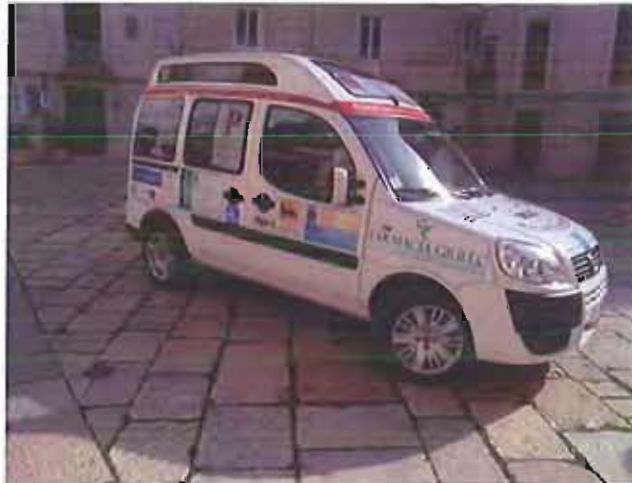
Il "taxi sociale"

Il servizio sarà effettuato dalla società "Pmg Italia srl", in precedenza denominata MGG Italia srl, già impegnata per la mobilità garantita a soggetti svantaggiati mediante la fornitura di automezzi attrezzati per trasportare carrozzine e adatte per disabili.