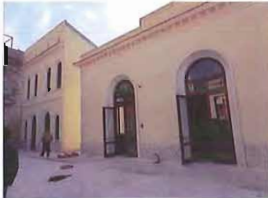
Officina San Domenico