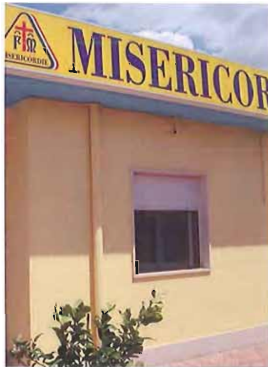
andria - via vecchia barletta sede della misericordia

Tutte le mattine saranno dedicate a bambini e ragazzi dai 6 ai 13 anni, mentre tra pomeriggio e sera le attività si sposteranno sugli adolescenti e soprattutto sulle famiglie. Il ricco programma ha un tema portante particolarmente importante. Quest'anno, infatti, si parlerà di "integrazione e valorizzazione della diversità". L'intera attività con il programma sarà presentata lunedì 17 mattina a partire dalle ore 10,30 nella sala conferenze della sede della Misericordia di Andria in Via Vecchia Barletta, durante una conferenza stampa nella quale saranno presentati dati e statistiche del lavoro della Confraternita dell'anno 2012 e del primo semestre 2013 con le attività strategiche in via di attivazione.