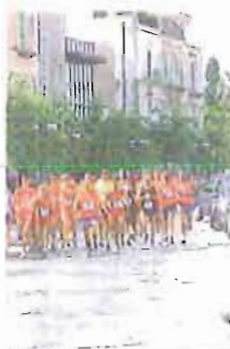
CORATO Una delle passate edizioni di «Cuorrere insieme»