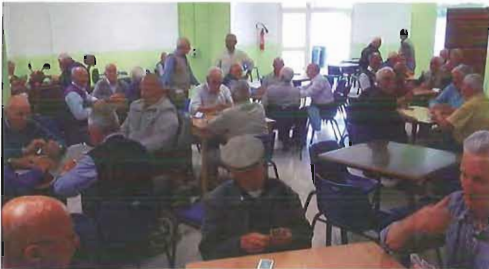
nuovo polivalente anziani

Alla fine tutto si è risolto nel migliore dei modi e anche gli anziani hanno il loro nuovo Polivalente.