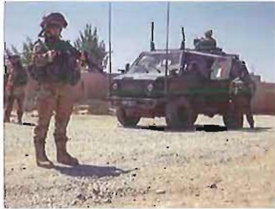
Afghanistan - soldati