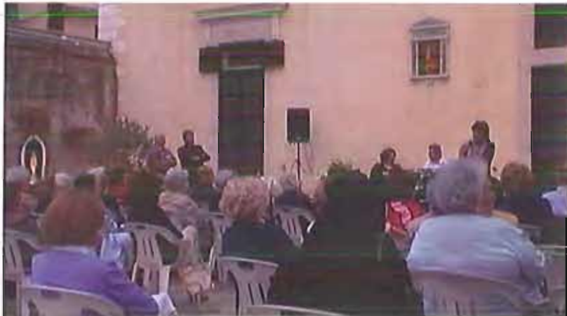
L'incontro dell'associazione Aiuta

Domenica 9 giugno, in un clima di serena amicizia, a Villa Giulia in via A. Moro, si è svolto il secondo incontro annuale degli Amici dell'AIUTA.