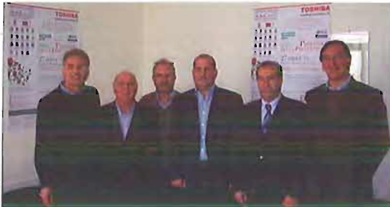
Apo Puglia Apo Puglia

Senza tregua l'azione di prevenzione programmata dall'APO Puglia Onlus (Associazione prevenzione Oncologica) di Monopoli che, dopo gli ultimi apprezzatissimi screening che hanno ancora registrato una considerevole partecipazione di persone, nel mese di giugno propone uno screening per la prevenzione della vista al fine di evitare l'insorgenza di patologie particolarmente serie come le maculopatie. In questa ultima azione preventiva sarà effettuato uno screening morfologico sulla retina (il c.d. Esame del Fundus Oculi).