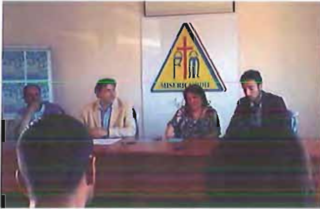
Il rapporto 2012 della Misericordia

«Un report 2012 difficile da riassumere, viste le tantissime attività effettuate, ma che è necessario conciliare in numeri. 19.411 interventi (divisi in eventi locali, fuori zona, emergenze sanitarie di 118, servizi sanitari, trasporti vari e protezione civile), 352 mila chilometri effettuati dai 25 automezzi a disposizione del parco auto, tre postazioni di 118 tra Andria e Trani in convenzione con l'Asl, oltre 100 soci ed un lavoro quotidiano ventiquattrore su ventiquattro e per 365 giorni all'anno».