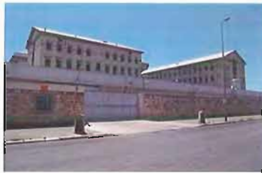
Il Penitenziario di Bari

Mercoledì 19 giugno inizieranno le lezioni del progetto di scrittura creativa dal titolo "Donne e Arte in Carcere" presentato dalla Cgil di Bari nella casa circondariale del capoluogo lo scorso 8 marzo in occasione della giornata internazionale della donna. Il Coordinamento Donne della Cgil di Bari, in collaborazione con l'Università Popolare della terza Età, ha voluto rinnovare il messaggio che la detenzione non può e non deve privare la donna della sua dignità. Il progetto infatti nasce come voglia di manifestare il senso di solidarietà e vicinanza nei confronti delle detenute per dire loro che dietro quelle sbarre c'è la possibilità attraverso la scrittura creativa, di essere libere dalla tristezza, dalla delusione, dal pregiudizio. Il loro silenzio assordante sarà trasformato in versi, e i versi in racconto.