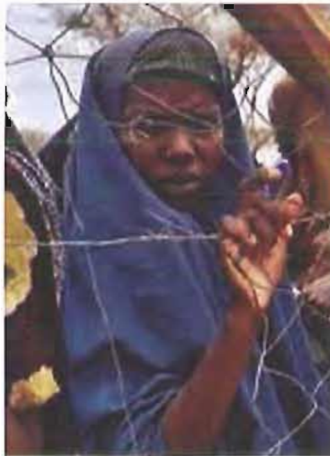
Il volto di una donna in fuga dal suo Paese

In mostra anche i lavori artigianali realizzati nell'ambito del "Corso di Lavorazione della Pietra", frutto della collaborazione con la cooperativa sociale Eugenia Onlus. Un altro stand ospiterà i lavori di sartoria realizzati dai beneficiari dello Sportello Integrale.