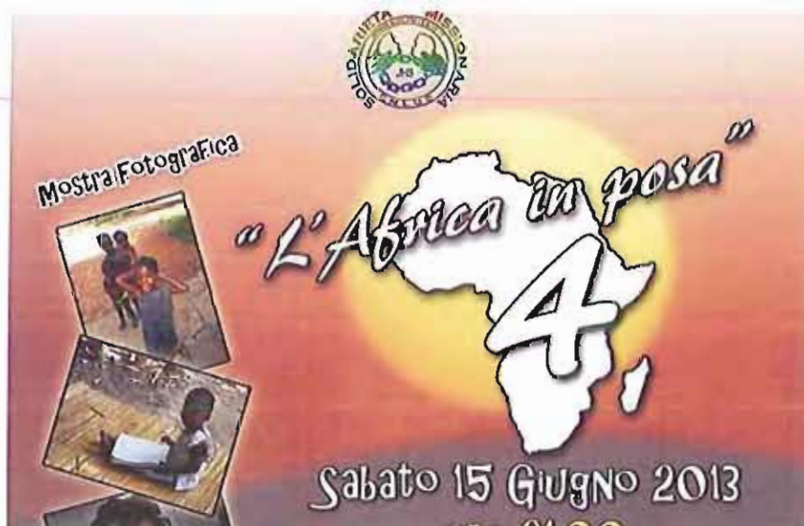
Africa in posa - IV edizione Solidarietà Missionaria

L'associazione "Solidarietà Missionaria" O.N.L.U.S. presenta la quarta edizione della mostra fotografica "L'Africa in posa", costituita da diversi scatti realizzati dai volontari nelle missioni del Mozambico durante l'ultimo viaggio. La mostra avrà luogo presso il teatro della chiesa del "Sacro Cuore" a Monopoli, nei giorni del 15 e 16 giugno prossimi.