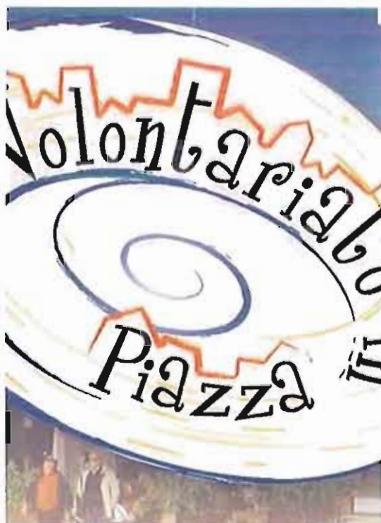
La locandina dell'evento di questa sera Volontari protagonisti in Piazza del Ferrarese a Bari csv san nicola

"Volontariato in Piazza" è una giornata in cui i cittadini attivi esprimono il peso del volontariato nella società per la sua capacità di essere un giacimento generativo di relazioni e di azioni. È una giornata in cui le Odv parlano ai visitatori dei propri obiettivi, progetti ed attività, in cui si creano reti tra i soggetti presenti, pubblici e privati, e tra le stesse associazioni. Una giornata animata dagli spettacoli e dalle attività dimostrative delle Odv, e dalla musica della "Conturband".