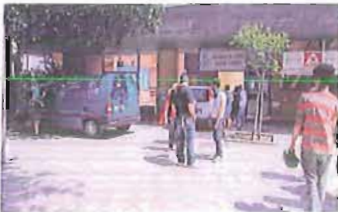
La sede dell'Accademia del cinema dei ragazzi al quartiere San Pio

P rezzi popolari (dal 5 euro del teggione ai 35 euro della platea) per lo spettacolo "Una Mano per le Stelle". In programma martedì 18 giugno al teatro Petruzzelli. L'evento, di cui EPollis Bari è tra i media partner, rientra nel service pluriennale del Rotary Club Bari Mediterraneo è stato organizzato per sostenere la raccolta fondi per il completamento del cinema dell'Accademia dei Ragazzi di San Pio. Sul palco del teatro si esibiranno, tra gli altri, l'etole internazionale di danza Raffaele Paganini, l'attore Maurizio Micheli e l'attrice Benedetta Boccoli.