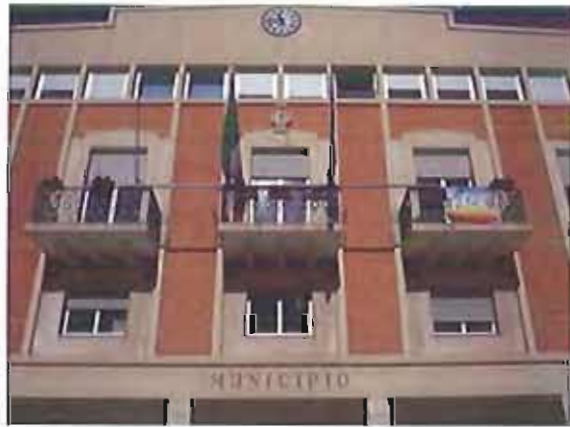
Il Comune di Giovinazzo GiovinazzoLive.it

Le risorse finanziarie disponibili sono pari a 10.000 euro, i fondi sono del Piano Sociale di Zona 2010/2012. L'avviso è rivolto a Cooperative sociali, Associazioni e organizzazioni di volontariato, ma anche ad altri soggetti privati con o senza finalità di lucro che operino nell'ambito dei servizi alla persona. Le idee progettuali possono essere presentate entro il 21 giugno. Tutte le informazioni sono scaricabili a questo link http://www.comune.giovinazzo.ba.it/attachments/article/150/allegato_994.pdf