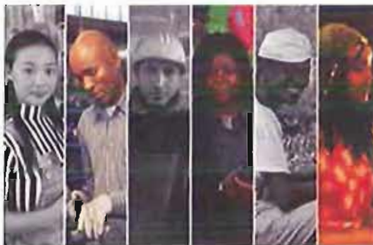
immigrazione e integrazione

Hanno aderito e collaborato all'organizzazione dell'evento Missionari Comboniani, Ass. cult. Abusuan, Centro Missionario diocesi Bari-Bitonto, Cgil, Acli Puglia, le comunità mauriziana, brasiliana, etiopica, eritrea, senegalese, filippina, cinese, ivoriana, burkinabès, albanese, indiana, rom, palestinese, somala, afgana, peruviana, Parrocchia San Sabino, San Marcello, San Giuseppe, San Rocco, Aafak-Marocco, Forum Terzo settore, Alma Terra, Kenda, Migrantes, ass.cult. Banderumorose, Les flamboyants, Associazione Luigj Gurakuqi Albanesi in Puglia, Etnie, coop.Unsolomondo, religiose M. Immacolata, S.OL.Co, ARCI comitato territoriale Bari, I colori del mondo, Emergency Bari, Laltrocanto, Intersos, Progetto Continenti, Cuamm medici con l'Africa, Eva contro Eva, Progetto mondialità, Agesci, club Unesco di Molfetta.