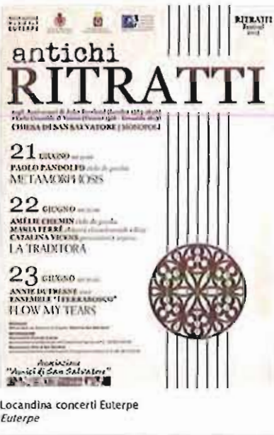
Locandina concerti Euterpe Euterpe