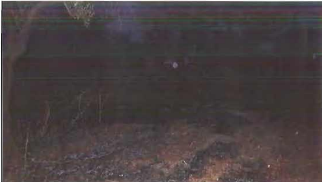
Incendio località san francesco

Ancora un incendio domato nelle campagne della città.