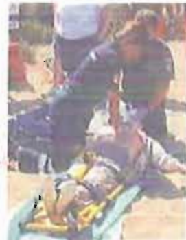
Una simulazione di soccorso

● CASTELLANA. Grazie alla passione e al lavoro dei volontari, l'idea di un gruppo di amici di fondare una onlus al servizio della collettività si è trasformata in realtà. Il primo meeting regionale dell'Associazione nazionale pubblica assistenza (Anpas) celebrerà il 20esimo anniversario della fondazione della locale Avpa, sodalizio principalmente dedito al trasporto sanitario, all'accompagnamento dei disabili e all'assistenza domiciliare. Da oggi a domenica 16 le ventiquattro sedi pugliesi, i comitati regionali del Sud Italia e le associazioni Anpas si ritroveranno nel campo sportivo di via Turi per la manifestazione «1993-2013, venti anni tra la gente».