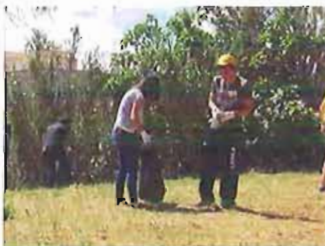
ITC Salvemini di Molfetta

Lo scopo dell'iniziativa è stato quello di ripulire una delle spiagge più utilizzate nella stagione estiva ma, allo stesso tempo, "maltrattata" fino all'inverosimile. I partecipanti, con senso di umiltà e di appartenenza alla spiaggia simbolo della città, si sono adoperati per ripristinare una condizione di vivibilità.