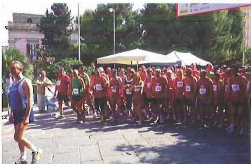
La partenza di Cuorrere insieme

Si terrà nel prossimo fine settimana la terza edizione di "Cuorrere insieme", la manifestazione medico sportiva promossa dall'associazione "Salute e sicurezza" con l'obiettivo di sensibilizzare la prevenzione delle malattie del cuore.