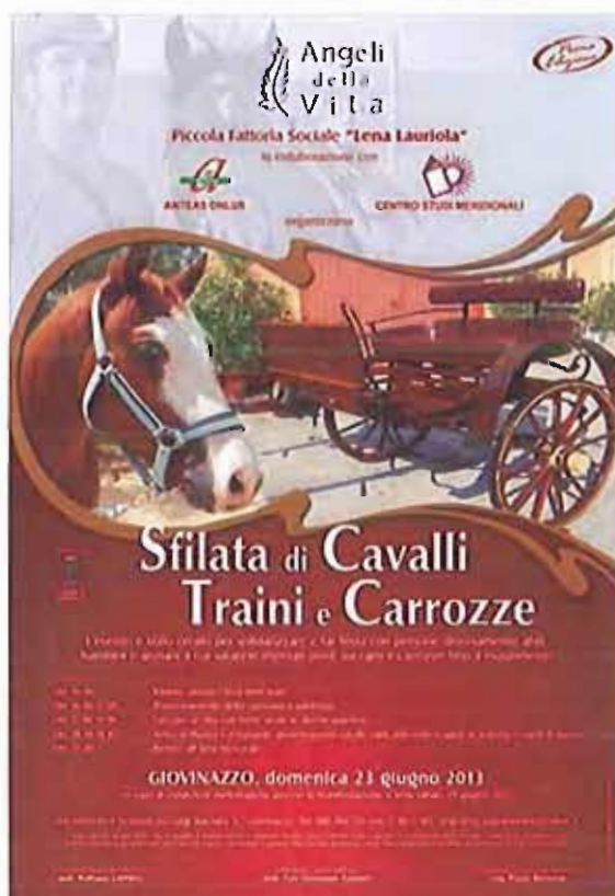
La locandina dell'evento

Per informazioni e iscrizioni ci si può rivolgere presso la sede dell'Associazione in Via Luigi Marziani 5/7, chiamando in orario pomeridiano lo 080/73947231 o scrivendo all'indirizzo mail segreteria.angelidellavita@yahoo.it .