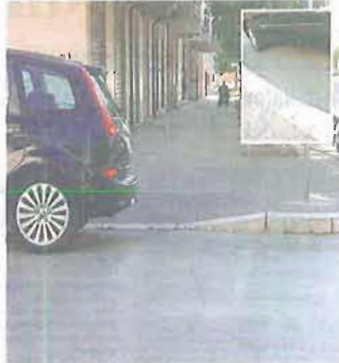
MOLFETTA Lo scivolo di via Padre Pio occupato da un'auto