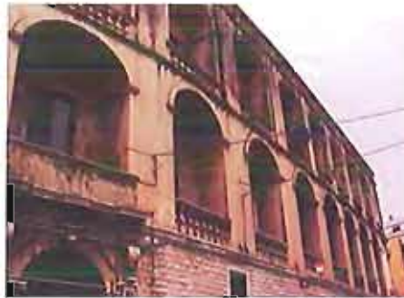
Il Comune di bisceglie

Lo rende noto un comunicato diffuso dalla Cgil della Bat.