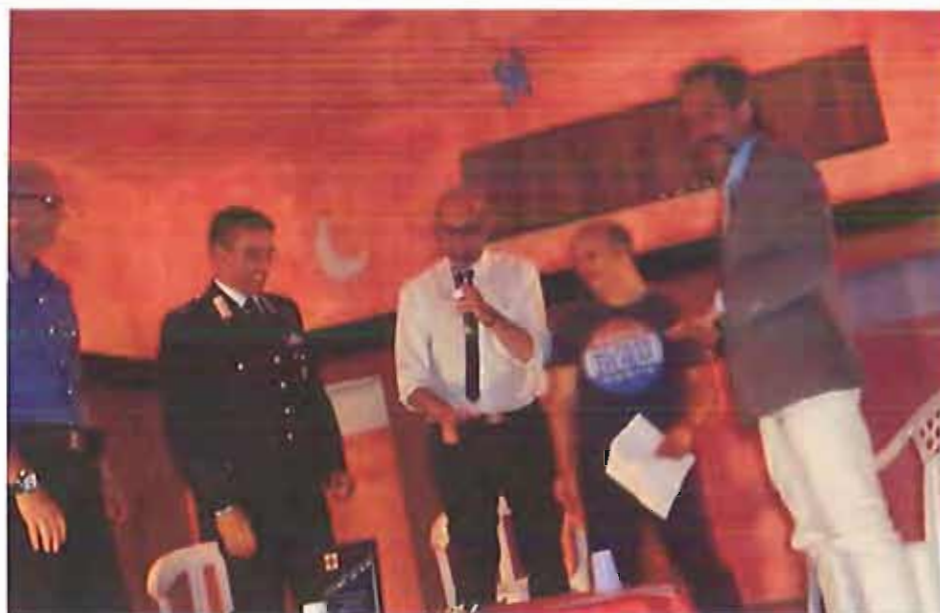
Il IV Premio alla Solidarietà del centro Zenith AndriaLive

Intenso ed emotivamente efficace l'incontro di consegna del V premio della solidarietà all'Arma dei Carabinieri della Compagnia e della Stazione di Andria da parte del centro Zenith.