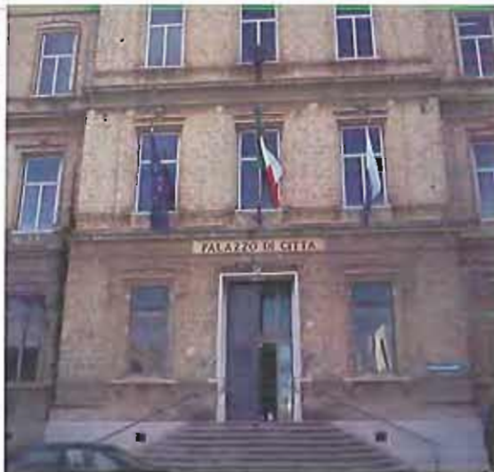
Il Comune di Trani

L'iniziativa è promossa da A Buon diritto, Acat Italia, A Roma, insieme - Leda Colombini, Antigone, Arci, Associazione Federico Aldrovandi, Associazione nazionale giuristi democratici, Associazione Saman, Bin Italia, Canapuglia, Carcere Possibile, CGIL, Funzione Pubblica CGIL, Conferenza nazionale volontariato giustizia, Cnca, Coordinamento dei Garanti dei diritti dei detenuti, Fondazione Giovanni Michelucci, Forum droghe, Forum per il diritto alla salute in carcere, Giustizia per i Diritti di Cittadinanzattiva Onlus, Gruppo Abele, Gruppo Calamandran, Il Carcere Possibile Onlus, Il detenuto ignoto, Il Naga, Itaca, Libertà e Giustizia, Medici contro la tortura, Progetto Diritti, Rete della Conoscenza, Ristretti Orizzonti, Società della Ragione, Società italiana di Psicologia penitenziaria, Unione Camere penali italiane, Vic - Volontari in carcere.