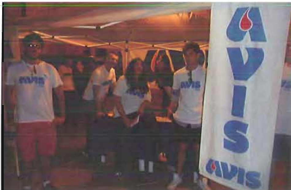
L'Avis al porto di Trani

Ennesima serata di sensibilizzazione da parte dell'Avis Trani in occasione della giornata più importante: quella mondiale del donatore.