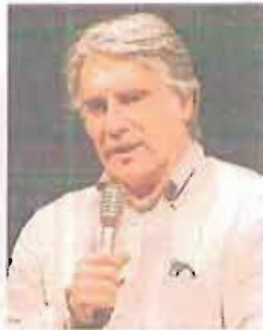
PSICHIATRA Paolo Crepet

ti: ne parliamo nei servizi a parte in questa stessa pagina. Dai loro racconti il procuratore aggiunto Anna Maria Tosto ha tratto spunto per spiegare che una via d'uscita a queste violenze esiste. È la lunga lista di norme, come la legge 154 del 2001, la legge 38 e non ultima la Convenzione di Istanbul, che prevede tutta una serie di misure a tutela delle vittime: