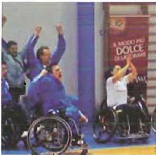
I ragazzi della HBARI2003

"In questo modo - conclude la messaggio - contribuirete alla sopravvivenza di un'attività unica nel suo genere che ha, nel tempo, consentito ad un gran numero di persone disabili a vivere dei momenti di socializzazione e, a fornire loro, a costo zero, terapie riabilitative fisiche e mentali altrimenti pesantemente a carico del servizio sanitario, e sicuramente di differente efficacia."