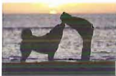
affetto tra cane e uomo

"Con questo evento dimostreremo (se ce ne fosse ancora il bisogno) che "L'amore non si compra, si adotta", e che i cani adottati (anche eventualmente di razza) non hanno assolutamente nulla in meno rispetto a quelli comprati, anzi, hanno qualcosa in più: sono individui e non oggetti, sono parte della famiglia e non merce di compravendita!"