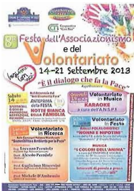
8a Festa dell'Associazionismo e del Volontariato