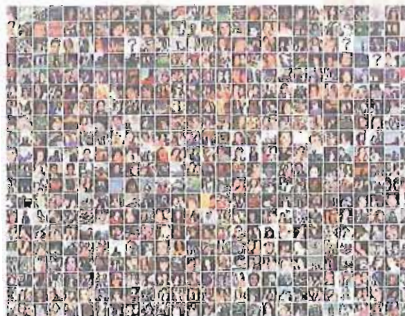
FACEBOOK Volti, messaggi, nuovi linguaggi dal computer

L'incontro è organizzato e animato dai volontari di «Intercultura» del Centro di Bari che da anni operano sul territorio promuovendone la crescita interculturale. Ogni anno inviano 1.800 adolescenti a frequentare un periodo di scuola all'estero e vivere con una famiglia di un altro Paese, ma anche accogliendo altrettanti ragazzi provenien-