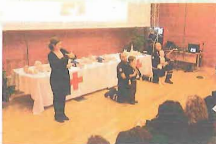
GENITORI IN GAMBA La lezione interattiva per mamme e papà che s'è svolta presso Fondazione Giov. Paolo II di Bari, il 15 dicembre dell'anno scorso

E il 20 settembre due eventi formativi gratuiti, per 150 persone, sulle manovre di disostruzione delle vie aeree