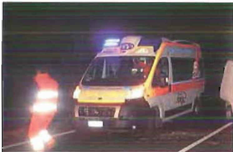
Un'ambulanza del 118

Si sono date appuntamento a Corato sabato scorso 7 settembre le Associazioni di Volontariato convenzionate con il SET 118 su tutto il territorio regionale, con lo scopo di dare attuazione a quanto preannunciato dalle Federazioni e dai Coordinamenti Provinciali con il Comunicato stampa del 2 agosto u.s. in ordine alle generiche accuse di cattiva gestione loro rivolte dal Coordinatore Regionale del SET 118, dott. Marco De Giosa.