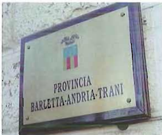
sede provincia bat provincia bat vincenzo cassano

Per maggiori informazione è possibile rivolgersi al numero telefonico 0883.1978180 oppure inviare una mail all'indirizzo politiche.sociali@provincia.bt.it