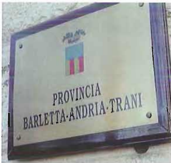
sede provincia bat provincia bat vincenzo cassano

Per maggiori informazione è possibile rivolgersi al numero telefonico 0883.1978180 oppure inviare una mail all'indirizzo politiche.sociali@provincia.bt.it