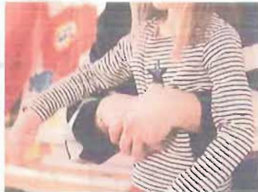
DAL BITO CRI «L'abbraccio» che può salvare una giovane vita

«Il gazebo del Comitato Regionale CRI - dice la sua presidente - ospiterà anche altre associazioni presenti che si occupano della cultura della donazione quali Aido, Fratres, Admo e così via, per attività informative e contestualmente anche iniziative della Croce Rossa Italiana. Perché quello della donazione di sangue, organi, tessuti e cellule è un tema molto sentito dal Comitato pugliese della Cri».