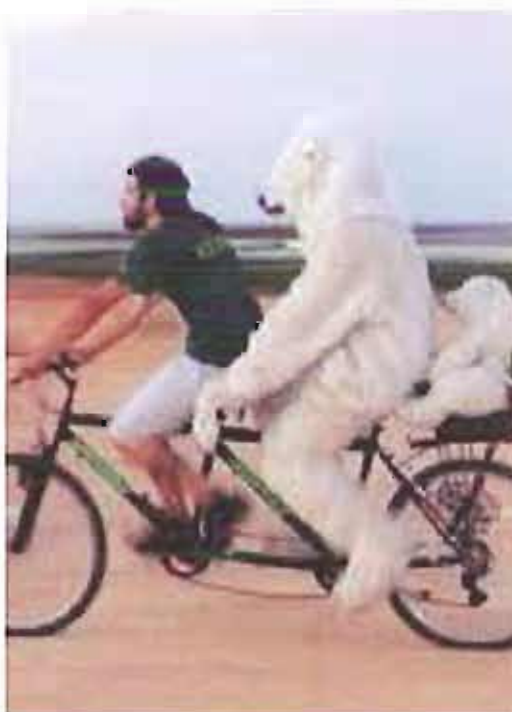
La locandina dell'evento

Chi partecipa è invitato ad indossare abiti di colore bianco.