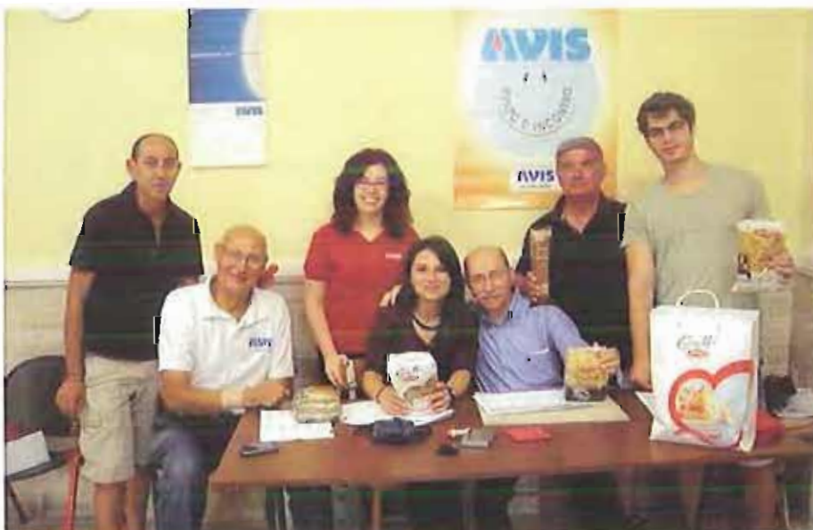
Una donazione all'Avis di Corato

E' giunta al termine ieri la campagna estiva di raccolta sangue dell'Avis iniziata il 15 giugno scorso.