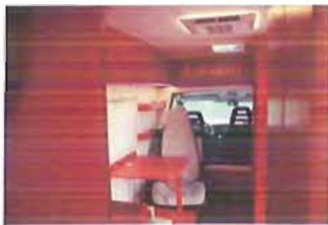
Emergency a Barletta

L'ambulatorio mobile di Emergency ha raggiunto anche Barletta, stanziando nei giardini del castello la scorsa sera. Il Minivan, uno dei quattro ambulatori mobili attivi nelle aree caratterizzate da forte presenza di migranti, per il momento svolge la sua attività nelle campagne della Capitanata a Foggia.