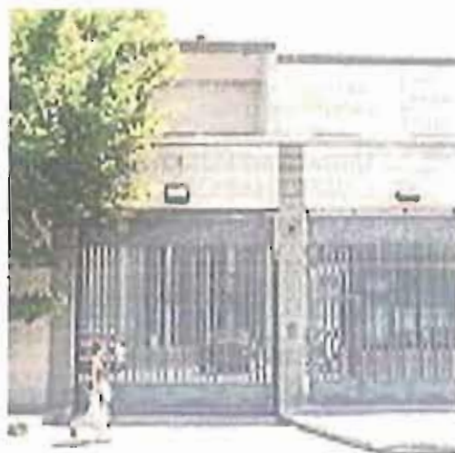
FORNELLI L'ingresso in via Giulio Petroni