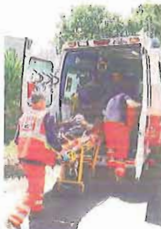
SANITÀ Soccorritori del 118