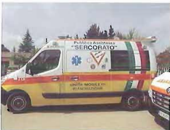
Una delle nuove ambulanze del Ser Corato