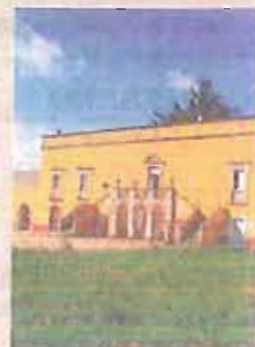
RICERCA Basile Caramia

Il set è arricchito da alcune immagini di fotografi professionisti come Cosmo Mario Andriani, Fabrizio De Donato, Mario De Matteo, Saverio Perrini, Antonio Sigismondi e Gianni Zanni. Fino a lunedì 16 è possibile partecipare alla quarta edizione del Concorso fotografico «Passeggiando tra i paesaggi geologici della Puglia» patrocinato dalla Regione Puglia (il bando su www.sigea.it ).