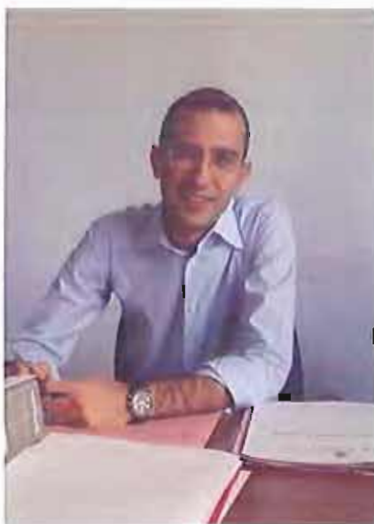
Michele Sollecito GiovinazzoLive.it

I requisiti di accesso sono: età anagrafica compresa tra i 16 e i 64 anni alla data di presentazione dell'istanza; residenza in Puglia da almeno 12 mesi; vivere presso il proprio domicilio e nel proprio contesto familiare; disabilità motoria riconosciuta ai sensi dell'art. 3 comma 3 della l. n. 104/92; reddito individuale a ogni titolo percepito non superiore a 20.000 euro; coerenza del proprio progetto di vita con gli obiettivi e le finalità del bando stesso.