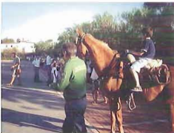
Cavalli e rapaci in mostra per anziani e disabili della casa protetta Oasi di Nazareth

Protagonisti sono stati anche rapaci e cavalli. In mostra esemplari di gufo reale, aquila reale, oltre a barbagianni, poiane e falchi. Con grande gioia e sorpresa si è instaurata una socializzazione ed un interesse formidabile con anziani, bambini e disabili.