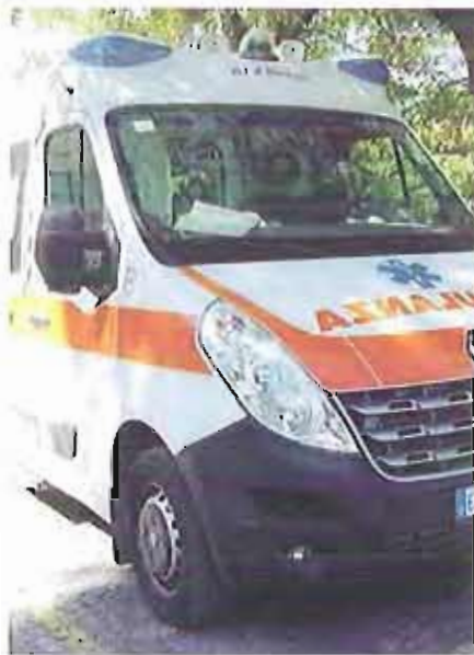
ambulanza servizio 118 Andrialive