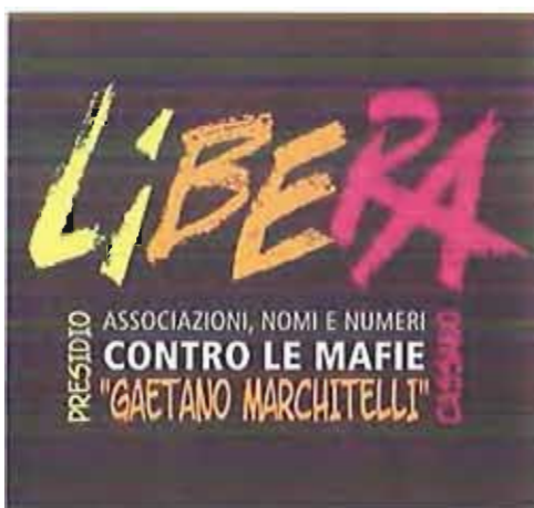
Il logo di Libera Cassano

Quindi fatevi avanti, perché insieme "SI PUO' FARE!"»