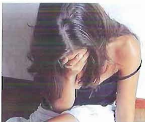
violenza sulle donne

L'iniziativa, ideata e promossa dalla rivista online "La Grande Testata", nasce come gesto d'indignazione verso i tanti episodi di violenza nei confronti delle donne. Per farlo si occupa un posto in un cinema, un teatro, un treno, sulla metro o a scuola, con un giornale, una borsa, un mazzo di chiavi, un cappello: riservare un posto ad una donna significa simbolizzare un'assenza che avrebbe dovuto essere presenza.