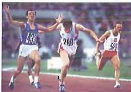
Pietro Mennea - Vittoria alle Olimpiadi di Mosca '80

Seguirà la proiezione del docufilm dal titolo 19"72 dedicato alla vita dell'uomo più veloce del mondo nato a Barletta.