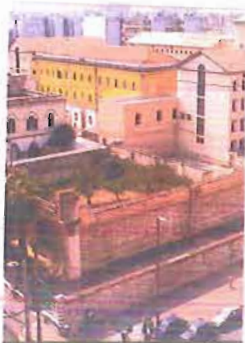
CARCERE Un progetto di auto-narrazione da giovedì

Da giovedì nel carcere il progetto Caffè ristretto sull'«Io» realizzato dall'Istituto Massari Galilei