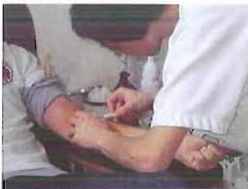
Donazione di sangue.

L'invito dell'associazione è di allargare la platea dei donatori invitando alla donazione anche parenti ed amici.