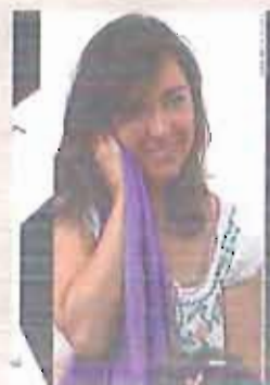
SORDI Un corso di foto