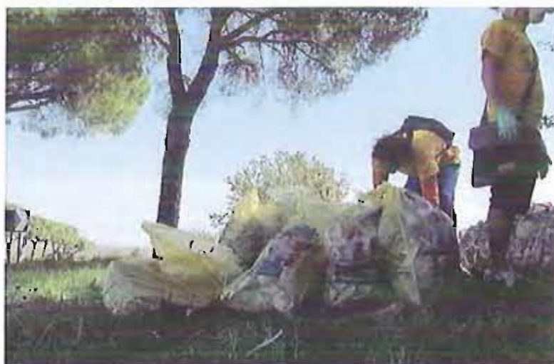
Puliamo il mondo - Castel del Monte 2012

Anche quest'anno a Corato domenica 23 settembre si svolgerà "Puliamo il Mondo", manifestazione con cui vengono liberate dai rifiuti e dall'incuria i parchi, i giardini, le strade, le piazze, i fiumi e le spiagge di molte città del nostro pianeta.