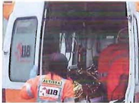
Un'ambulanza del Servizio 118

Profonda ed unanime delusione, infine, nell'aver preso atto che sulla opportunità, se non necessità, di un confronto serio e costruttivo tra la Regione e le Associazioni convenzionate, già avviato con l'allora Assessore regionale Prof. Tommaso Fiore, neppure l'autorevole intervento del Presidente Introna abbia prodotto effetti.