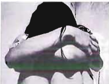
Femminicidio il femminicidio

Il programma completo degli eventi è disponibile online sul sito