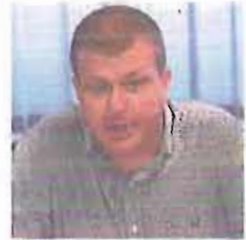
TARANTINI Legambiente Puglia

pentiti di mafia. In occasione dell'avvio della stagione 2013-2014 di Energy lab, Legambiente ha distribuito una sintesi del rapporto «I numeri dell'Ecomafia» di prossima pubblicazione. Il documento conferma la Puglia tra le prime regioni per numero di infrazioni accertate, di denunce e sequestri effettuati. Elemento, questo, che conferma quanto sia efficace l'attività di controllo e repressione. E sui traffici illeciti sono state ben 42 le inchieste avviate tra 2002 e oggi.