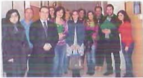
partecipanti corso di formazione