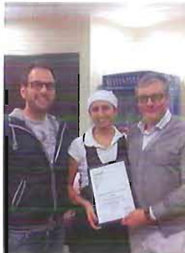
La solidarietà di Orizzonti

Al progetti, appartenenti agli ambiti dell'assistenza, dell'ambiente e della cultura, saranno assegnati complessivamente circa 110 mila euro, con contributi che variano dal dodici al venticinquemila euro; i progetti vincitori, presentati da associazioni di volontariato, onlus e cooperative sociali pugliesi, sono stati selezionati, tra i quasi 150 partecipanti, da una commissione composta da rappresentanti del Gruppo e della Fondazione Megamark, esperti di responsabilità sociale di impresa e un esponente dell'assessorato al Welfare.