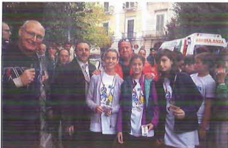
Studenti di corsa per diffondere la cultura della solidarietà

Si è svolta domenica scorsa la tradizionale corsa podistica non competitiva, riservata ai ragazzi e ragazze delle scuole medie di primo e secondo grado.