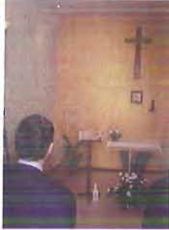
la cappella di Casa Accoglienza S. M. Goretti

La testimonianza tratta dalla vita della prima comunità cristiana ci sprona a rivedere i nostri stili di vita e a verificare l'atteggiamento che abbiamo nei confronti di quanti, componenti e non della nostra comunità ecclesiale, vivono situazioni di grande povertà, di disagio sociale e di reale impossibilità ad accedere ai beni di prima necessità: cibo, medicine, indumenti... nel 2012 abbiamo accolto 4.782 (nuclei familiari, singoli, anziani...) di soli italiani e 2.331 migranti.