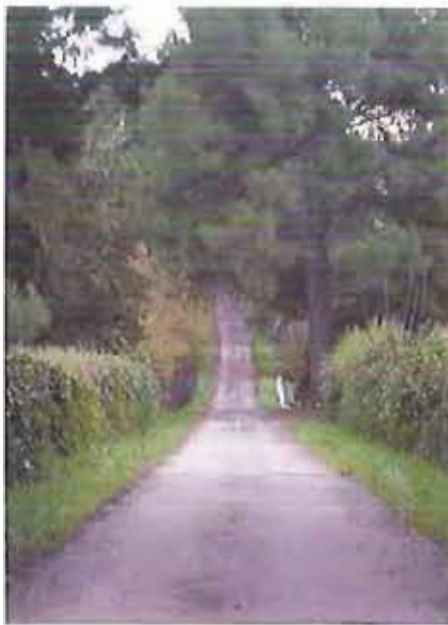
azienda papparicotta - andria

Escludendo solo pochi esemplari trasferiti all'osservatorio faunistico di Foggia e una mezza dozzina ad una azienda di Andria, resta ancora alto il numero di animali in surplus.