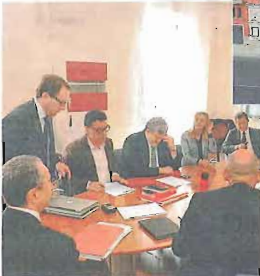
FONDAZIONE In consiglio di amministrazione ha varato il programma sociale

SOLIDARIETÀ. IL CARCERE - L'attività istituzionale del Petruzzelli verrà affiancata da iniziative rivolte a persone che difficilmente possono accedere alla