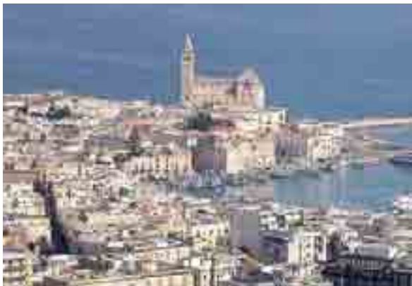
CATTEDRALE-GIOIELLO Una panoramica aerea di Trani

Per fare ciò occorre "tra l'altro, dotare la città di strutture, infrastrutture e servizi idonei: occorre recuperare la costa e garantire la balneabilità; valorizzare il centro storico; migliorare la viabilità e la mobilità; creare parcheggi periferici. Allo stesso modo è importante promuovere, con tutte le Istituzioni e gli enti territoriali, degli itinerari turistici e delle iniziative turistico-culturali in grado di qualificare l'intero territorio a livello nazionale e sovranazionale. Tuttavia, risultati concreti per il rilancio del turismo a Trani - conclude Amoroso - potranno essere conseguiti solo attraverso il coinvolgimento e la partecipazione