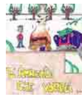
Una delle strisce premiate