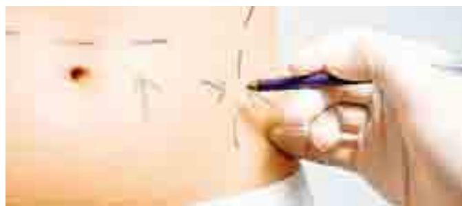
ESTETICA Molto richiesti i trattamenti di riduzione dell'addome