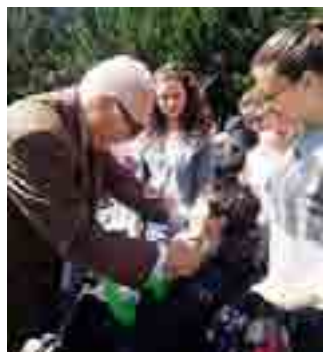
TUTTI PREMIATI Medaglia ricordo

L'evento è stato patrocinato dal Coni e soprattutto dagli assessorati comunali alla Pubblica Istruzione, allo Sport e alla Mobilità. Durante la mattinata si sono svolte le gare di lancio del vortex o della pallina, il salto in lungo e la corsa dei 50 metri. Non ci sono stati vincitori, ma ogni atleta che ha partecipato alle gare ha ricevuto una medaglia ricordo. Una coppa è andata, invece, alle scuole e associazioni che hanno partecipato.