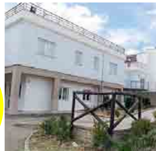
IN FUNZIONE Il «Centro Nicolas» di Canosa

Famiglie e pazienti. [paolo.pinnelli@gazzettamezzogiorno.it]