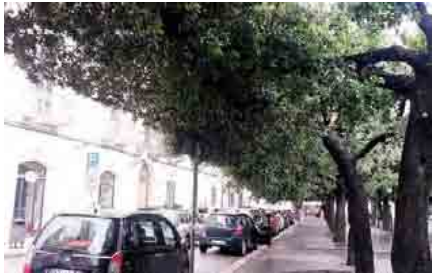
CASSONETTI ADDIO Piazza della Repubblica da ieri priva di cassonetti

La nuova macro area è quella ricompresa nel quadrilatero che va da corso Imbriani (dall'angolo con via Aldo Moro all'angolo con corso Vittorio