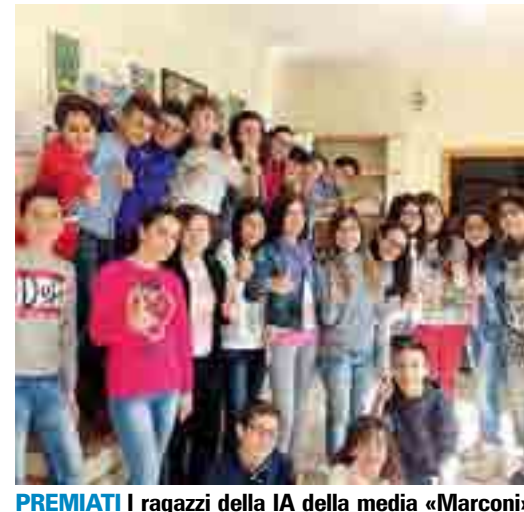
PREMIATI I ragazzi della IA della media «Marconi»