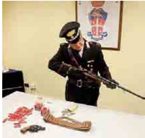
CON IL COLPO IN CANNA L'arma ritrovata e sequestrata

● TRANI. Dopo la droga, un filo rosso anche per delle armi? Il sospetto si fa strada, tenendo conto del fatto del ritrovamento, anche se in luoghi e circostanze diverse, di una pistola prima, da parte della Polizia, ed un fucile poi, per mano dei Carabinieri. Senza dimenticare i precedenti, tutti recenti, e non meno preoccupanti.