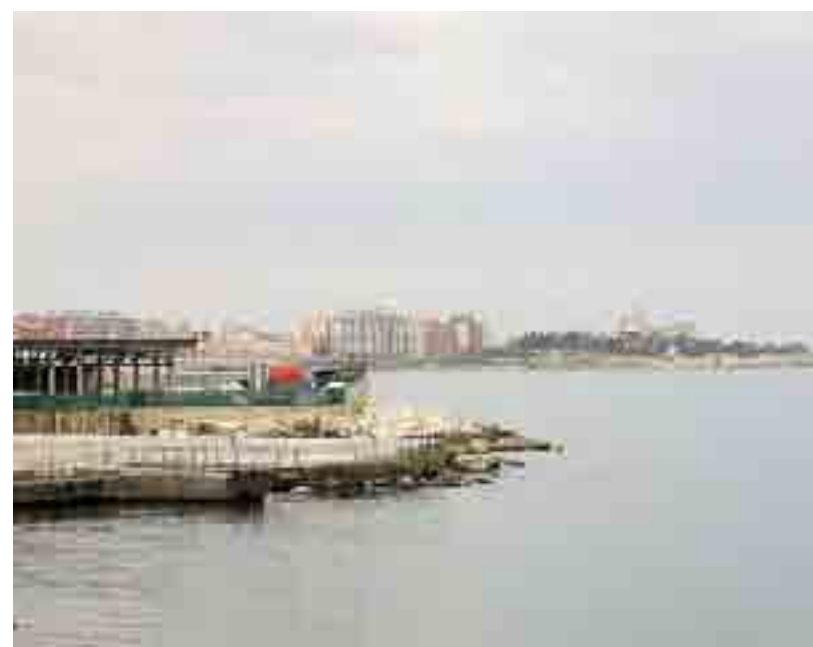
TRANI Una immagine della costa

un'operazione di risanamento dei conti pubblici che ha portato l'Ente da un disavanzo di amministrazione del 2011 di quasi 300mila euro ad un avanzo di amministrazione, certificato dal bilancio 2013, di quasi 4 milioni di euro". Nonostante questi problemi di natura finanziaria "gli uffici non sono stati fermi. Sono stati eseguiti lavori preliminari indispensabili alla redazione del piano come, ad esempio, la ricognizione di tutte le superficie demaniali nel territorio comunale (con aggiornamento dei relativi dati catastali, notevolmente modificati dal 2003 ad oggi) o come, ad esempio, il censimento di tutte le con-