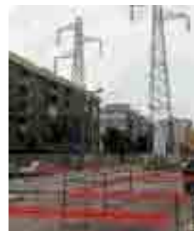
CANTIERE V. Giovanni XXIII

Nella giornata di ieri lavori anche nel parcheggio del «Monsignor Dimiccoli» per i tralicci che sono stati