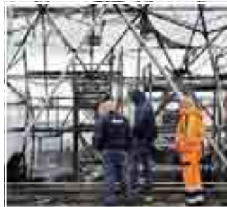
IL ROGO Le immagini del capannone distrutto. A sinistra uno degli ospiti scavalca la recinzione