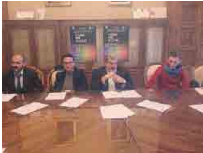
Un momento della conferenza stampa

Undesiderioincomune, Uomini in gioco - Ma-