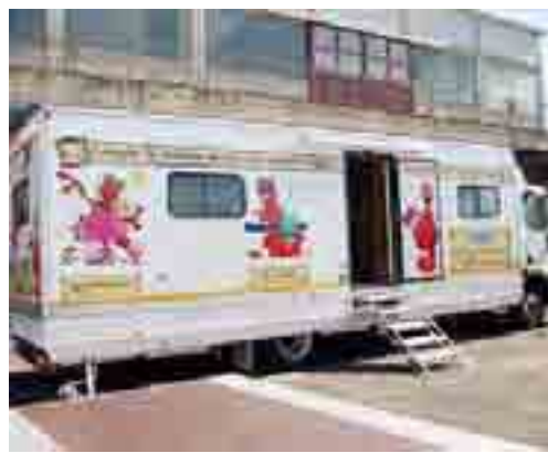
INIZIATIVA L'autoemoteca al mercato settimanale

Gramsci angolo via Tintoretto, con la presenza di medici specialisti e infermieri per una raccolta straordinaria di sangue, dalle 8 alle 12. Subito dopo la donazione il donatore potrà usufruire di una colazione presso il bar Girasole, nei pressi dell'Autoemoteca e a tutti i donatori sarà successivamente recapitato un check-up completo sul proprio stato di salute. [m. pal.]