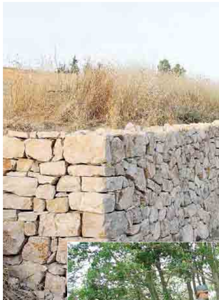
GIÙ IL MURO Oltre 70 metri di strada comunale, un vecchio tratturo con muretti a secco, sono andati interamente distrutti

L'ipotesi è quella di istituire un albo comunale nel quale i professionisti potranno iscriversi, dettagliando le loro competenze e specificità. A turnazione, poi, la giunta potrà scegliere i professionisti a cui affidare gli incarichi. L'iter per l'istituzione dell'albo, fanno sapere da palazzo Gentile, è già in corso. Il testo del regolamento, già approvato in commissione comunale, potrebbe presto arrivare al vaglio del consiglio comunale.