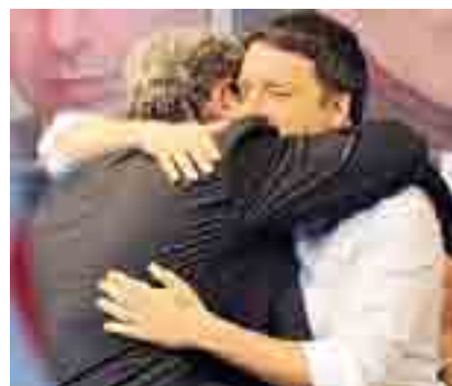
L'ABBRACCIO Emiliano e Renzi