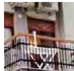
Le fiamme in casa