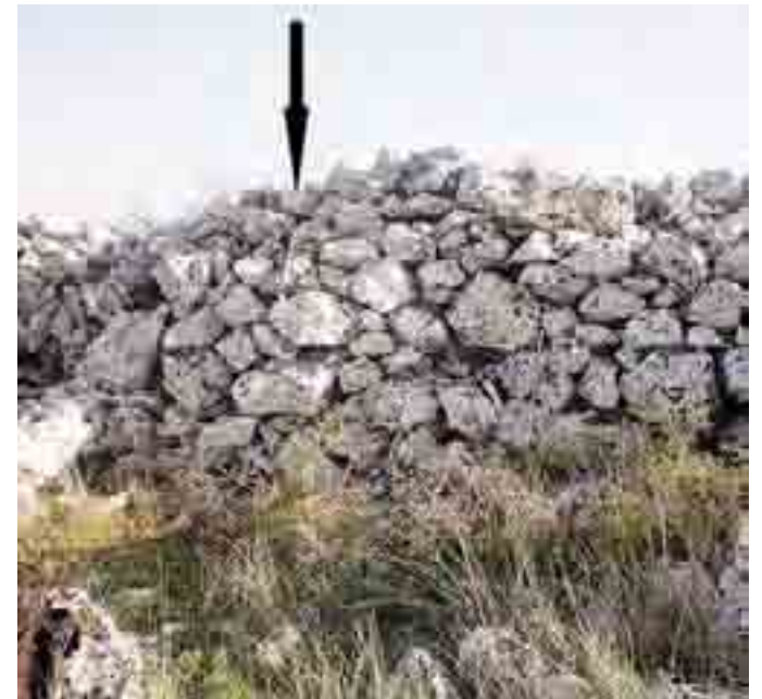
LUOGO Un muretto della Murgia

In località Savignano, nei pressi di Castel del Monte