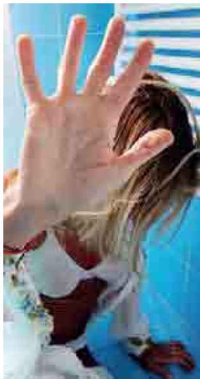
BOTTE DA ORBI Un'altra squallida storia di violenze tra le mura domestiche

TRANI LA VITTIMA ERA STATA MALMENATA DAL COMPAGNO PRIMA A BORDO DELLA LORO AUTO, POI IN CASA