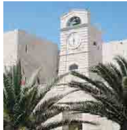
LA SEDE Il castello ospiterà la manifestazione

La biglietteria chiude alle 23.30. Per informazioni è possibile telefonare allo 0883.500117.