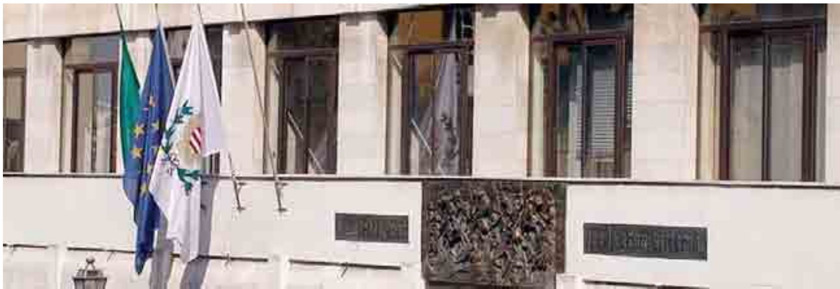
BARLETTA La facciata di Palazzo di Città

BARLETTA LA SOMMA NON RISCOSSA RIGUARDA GLI ONERI DI URBANIZZAZIONE NON VERSATI DALLE COOPERATIVE PER GLI EDIFICI COSTRUITI NELLA NUOVA 167