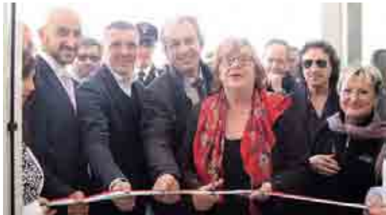
TAGLIO DEL NASTRO La cerimonia di inaugurazione del «Centro Nicolas»