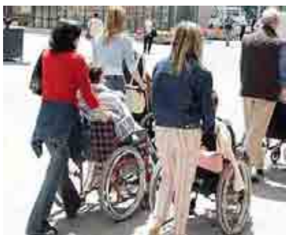
LOCOROTONDO Sono iniziati i lavori di ristrutturazione dell'ex scuola materna in via Solferino. Diventerà un Centro sociale polivalente a cura della «Giovanni Paolo II», costola del Gruppo Unitalsi