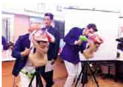
RIBALTA MONDIALE Gli acconciatori del Uaami, reduci dal trionfo di Francoforte, all'opera