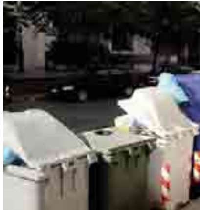
ANDRIA Contenitori per la raccolta rifiuti

● ANDRIA. Il Comando della Polizia municipale di Andria ha reso noto che "Prosegue l'azione di controllo e repressione del Nucleo Vigilanza Ambientale volta a reprimere il fenomeno delle buste dei rifiuti abbandonate nelle zone periferiche della città e nelle campagne. A seguito, infatti, dei controlli effettuati nei mesi di marzo ed aprile sono state contestate 63 violazioni all'ordinanza sindacale n. 420/2012".