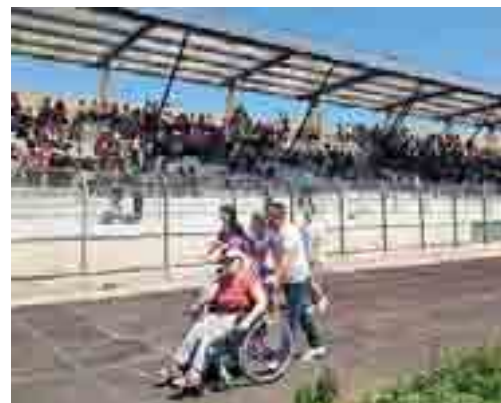
LA FESTA Al Sant'Angelo dei Ricchi tanta gente

BARLETTA OPERAI ANCHE AL PARCHEGGIO DEL «MONS. DIMICCOLI»