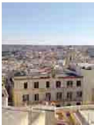
Panoramica di Canosa