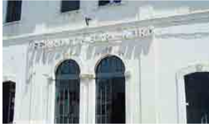
LA STAZIONE Ferrovia Bari Nord ad Andria