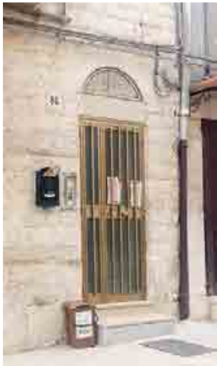
NOVITÀ Il nuovo bidoncino

E poi: «Qualche problema c'è stato, com'è naturale, ma complessivamente il nuovo sistema