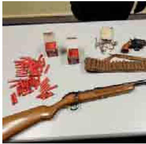
TANTE MUNIZIONI Sequestrate dai militari

I carabinieri arrestano 57enne incensurato