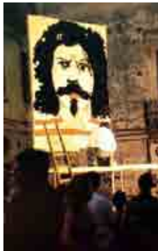
IL VIDEO Mainolfi all'opera

La proiezione di questo video si configura come un'anteprima della personale di Mainolfi Il Sole e altre storie , che si aprirà il 21 giugno prossimo a Molfetta, e che accanto a opere inedite e recenti avrà per l'appunto una sezione sulla produzione degli anni Settanta.