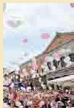
FESTA L'edizione 2013

Il Villaggio Race nella cornice di largo Giannella prevede un'area bimbi con i gon-