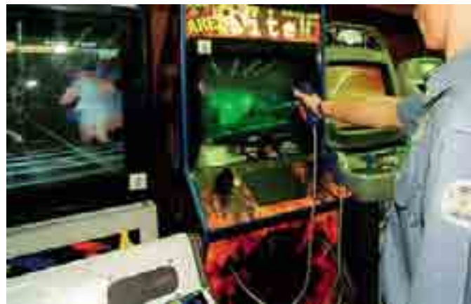
PIAGA SOCIALE Nuovo appello per arginare la diffusione del gioco d'azzardo

sonalità solide e attente all'uso corretto del denaro, ad una maggiore autonomia critica, alla rinuncia e a quelle scelte di sobrietà che possono permettere a ciascuno di superare gli inevitabili ostacoli della vita. Ma rivolgiamo anche un appello agli amministratori pubblici - fa notare Citro -, perché applichino la recente legge regionale sul "Gioco d'azzardo patologico", che, tra l'altro, impone alle sale da gioco una distanza di sicurezza di 500 metri da luoghi sensibili come scuole, ospedali, luoghi di culto e centri di aggregazione giovanili».