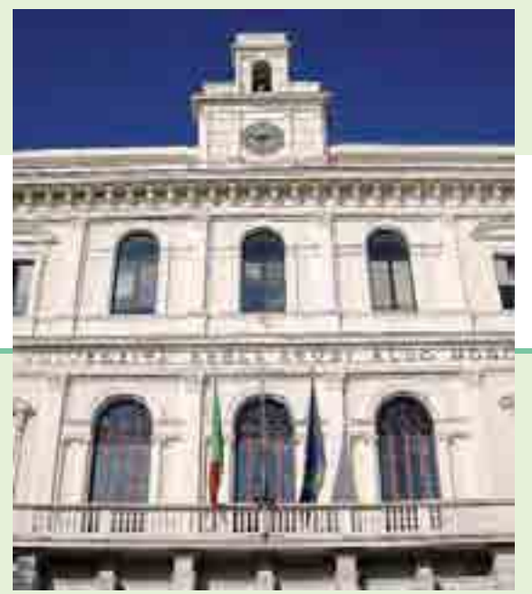
BENEFICIARI In Puglia assieme ad enti e associazioni anche le Università di Bari (a destra) e Lecce (a sinistra)