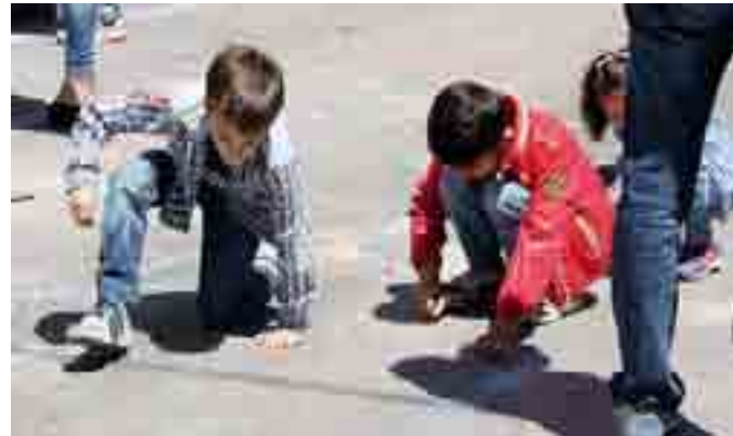
BARLETTA Piccoli madonnari ieri all'opera

● BARLETTA. «In viaggio... in viaggio per conoscere... in viaggio per conoscerci...», questo è stato il tema di Giò Madonnari, l'annuale manifestazione nazionale del CTG-Centro turistico giovanile che si è tenuta ieri domenica 18 Maggio, dalle 10, in corso Garibaldi. Grande è stata l'affluenza e la partecipazione di tanti bambini che armati di gessetti e curiosità hanno espresso la loro volontà di raccontare il viaggio. Perfetta la collaborazione con gli educatori, gli insegnanti e gli animatori per sensibilizzare e coinvolgere i più piccoli.