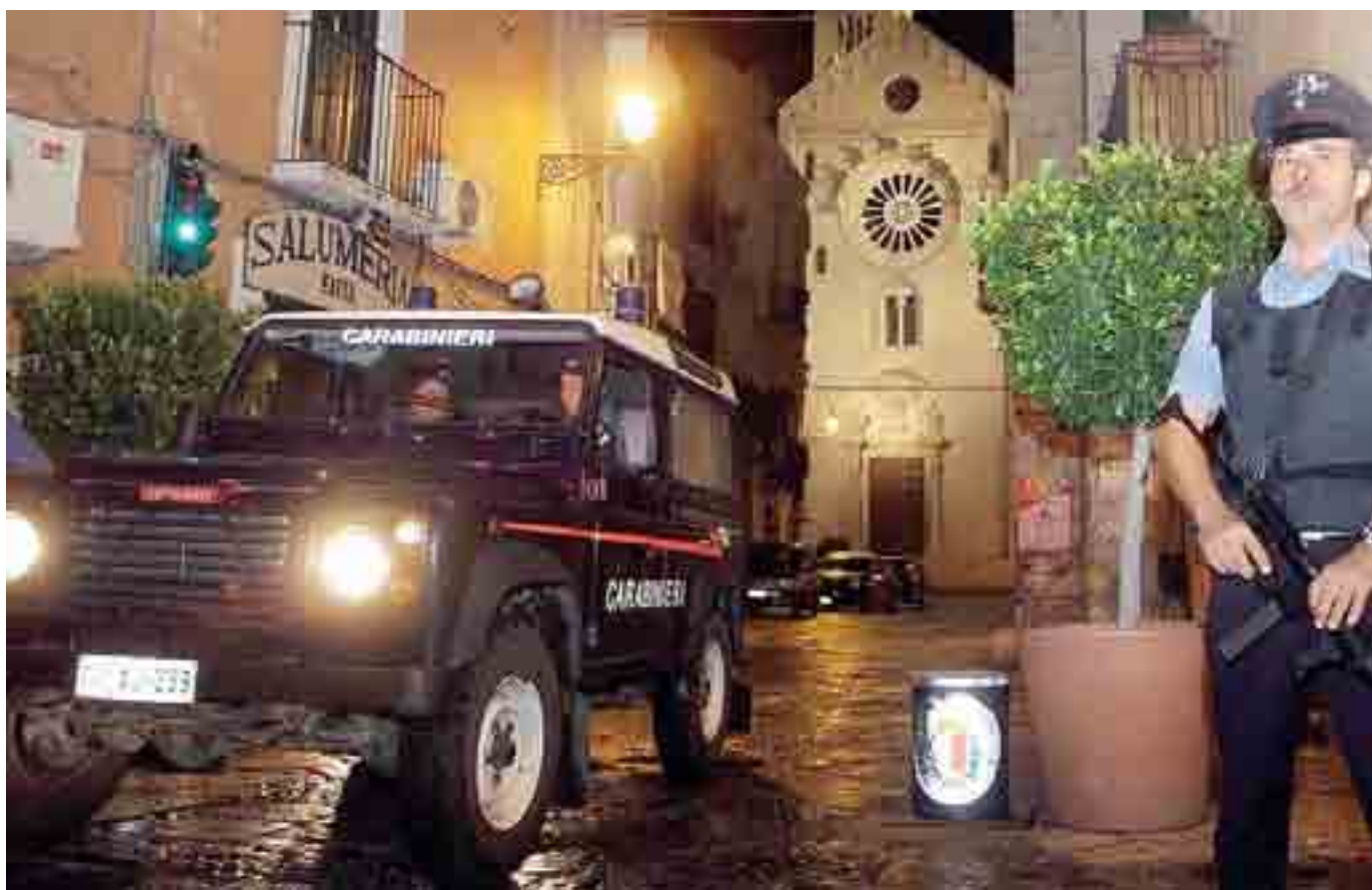
OPERAZIONE CONTRO IL CLAN STRISCIUGLIO Uno dei due blitz, quello dell'agosto 2013

«PRESTO L'INIZIO DI PULIZIA DEI FONDALI»