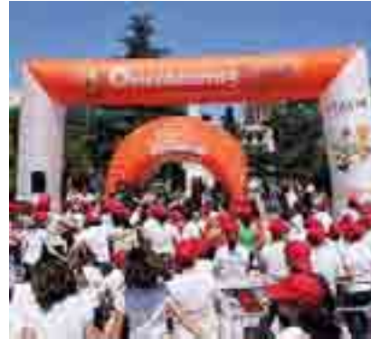
PARTECIPAZIONE Ecco cosa accade

La "Festa a Cielo Aperto di Orienteering" di giovedì 22 maggio è la conclusione di una progettualità che ha permesso a circa 200 alunni, disabili e normodotati, di praticare orienteering