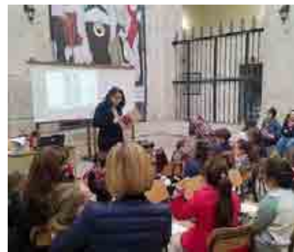
BARLETTA Piccoli lettori a Palazzo San Domenico

Libro come amico, partner, compagno di vita, dunque: lo scopo della campagna, infatti, è quello di portarlo tra la gente, distribuirlo, farlo conoscere, connotandolo di un forte valore sociale e affettivo. È importante sottolineare che l'attività didattica dal titolo "Viaggio nel mondo del libro" realizzata a Palazzo San Domenico lo scorso 10 maggio a cura della Biblioteca Comunale, ha registrato la consueta nutrita ed entusiastica presenza di piccoli lettori che, coinvolti dalla sapiente e qualificata competenza delle operatrici della Cooperativa Lilith med 2000 in servizio presso la Biblioteca, sono stati guidati in percorsi di scoperta della storia del libro, per conoscerne l'evoluzione che ha accompagnato la sua trasformazione da papiro a libro multimediale e per comprendere il percorso che da oggetto d'élite lo ha portato ad essere disponibile per tutti sugli scaffali della biblioteca.