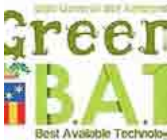
LOGO L'iniziativa «Green Bat»