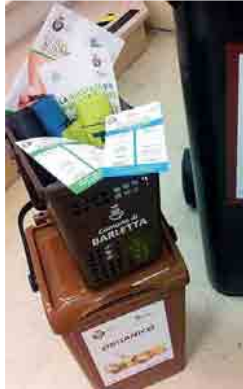
IL KIT Ecco i contenitori