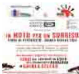
Moto e solidarietà

La manifestazione prevede un motoraduno degli iscritti al Club Bmw al quale sono invitati a partecipare tutti i possessori di motocicli e non, con appuntamento a Castel del Monte. Contestualmente durante la mattinata dalle 8.30 sino alle 13.30 si svolgerà una contribuzione volontaria presso lo stand temporaneo del club, con regolare emissione di ricevuta. L'evento è patrocinato dal comune di Andria tramite l'Assessorato al Marketing Territoriale e dalla Provincia Bat. [a.los.]