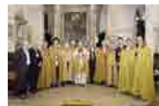
LA CERIMONIA I neo cavalieri

● BARLETTA. Si è tenuta domenica scorsa la cerimonia d'investitura nella Chiesa di Sant'Andrea della Associazione insigniti militare Valenziano Ordine dei cavalieri del Cid, presieduta da Ruggiero Piazzolla. La celebrazione è stata officiata da monsignor Giuseppe Paolillo ed ha avuto inizio con la benedizione della spada, quale strumento d'investitura, degli stendardi, delle croci e diplomi dei neo cavalieri con-