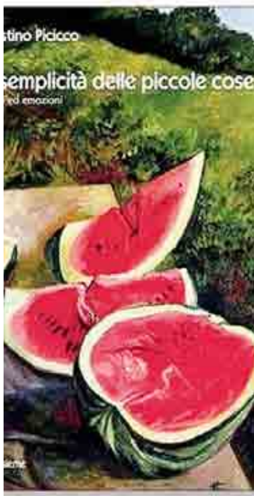
SENSO DELLE PICCOLE COSE La copertina del libro