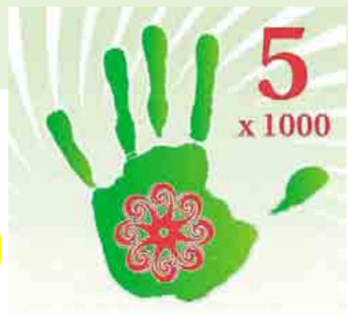
LOGO Il 5x1000 viene fatto conoscere da enti e associazioni

«Dirottata» ad altro scopo una parte dell'Irpef diretta allo Stato