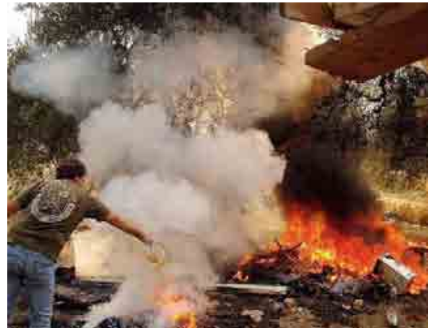
MOLFETTA Un rogo, in una zona non lontana dal centro abitato, provocato da sterpaglie

Le sanzioni potranno essere comminate dalle forze dell'ordine, dal comando regionale Puglia del Corpo forestale dello Stato, dai vigili del fuoco, dal comando di polizia municipale.