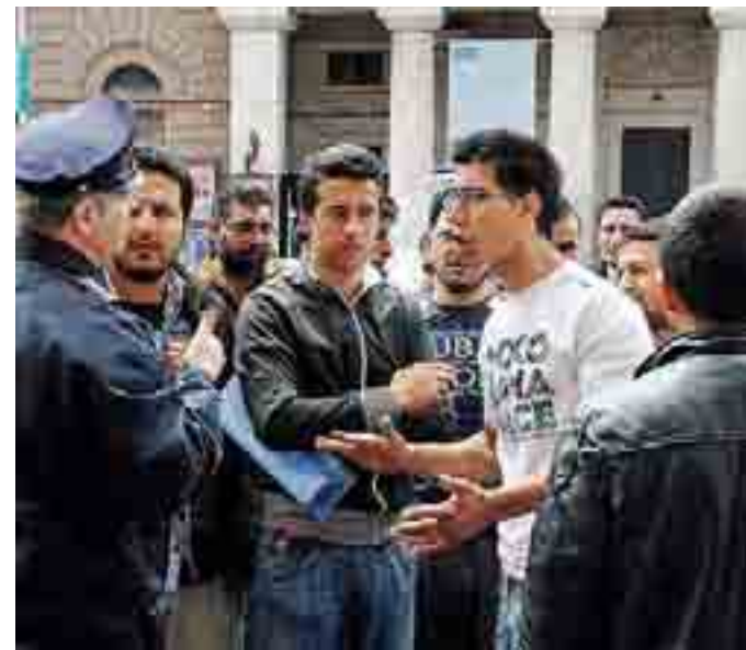
PREFETTURA Il sit-in di un gruppo di richiedenti asilo