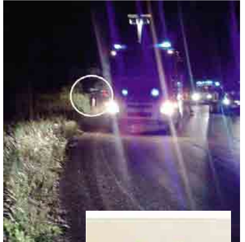
NOCI L'auto dei carabinieri messa fuori gioco da tre malviventi che non si sono fermati a un posto di blocco sulla strada provinciale 239

Resta comunque la gravità di questo episodio. Simbologgia una criminalità sempre più aggressiva e temeraria. Si tratta di banditi che sono pronti a tutto pur di condurre a termine le loro azioni criminali. Facile immaginare cosa sarebbe accaduto se dietro l'auto dei militari vi fossero state altre auto di ignari cittadini. Se anche fossero stati individuati e arrestati, spesso dopo breve tempo tornano in circolazione. Una sicurezza quasi di farla franca che comincia a superare ogni limite. Va detto che dietro i militari ci sono sempre famiglie. E che, per fortuna, l'altra notte si è evitato il peggio.