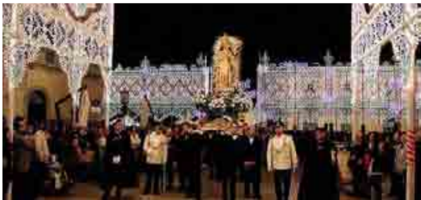
BITONTO Le luminarie montate in occasione della festa patronale in onore dell'Immacolata