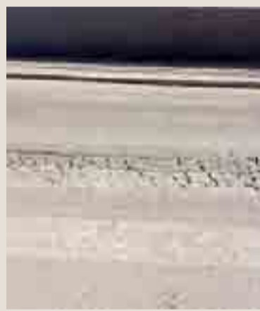
INVISIBILI Ecco le «zebre» da rifare