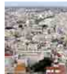
La città di Andria

● ANDRIA. La Regione Puglia e il Ministero dello Sviluppo Economico, d'intesa con l'Ifel-Fondazione finanza ed economia locale dell'Ance ed i Comuni di Andria, Barletta e Molfetta, hanno organizzato per oggi, martedì 27 maggio, alle 15 ad Andria, presso l'auditorium dell'oratorio San Annibale di Francia, via Gran Sasso, un seminario formativo. L'appuntamento è rivolto alle organizzazioni di categoria e professionali inerenti il "Bando Attuativo delle Zone Franche Urbane - Relazione Tecnica "sull'Inquadramento nor-