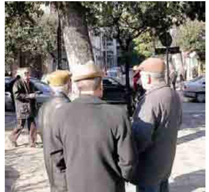
PIANETA ANZIANI Si tenta di riattivare il Centro di via Porta Pia

Il presidente della II commissione consiliare lancia questa idea