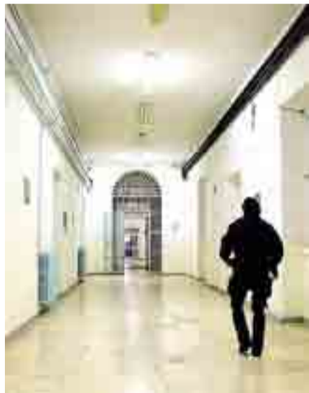
CARCERE Un corridoio del penitenziario di Bari