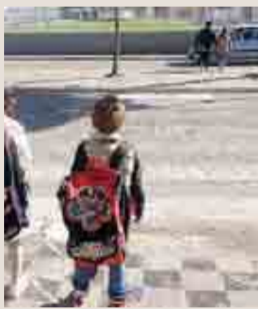
PERICOLO Ecco cosa vede un bimbo

Purtroppo, inoltre, il tratto è particolarmente pericoloso in quanto le auto sfrecciano a velocità sostenuta e non è presente alcun cartello che indica la vicinanza di una scuola. Forse si aspetta la tragedia per intervenire?