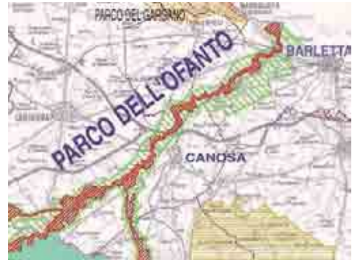
QUALE TUTELA Il fiume Ofanto

Conclusione: «A tal fine il Consorzio è promotore di una serie di Protocolli d'intesa con le più prestigiose Associazioni culturali e ambientaliste, tra cui i Rotary Club, Italia Nostra, "Ruotalibera" Bari e l'Archeoclub».