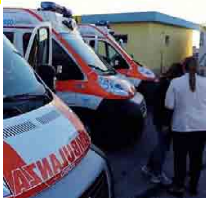
ALL'ALTEZZA DEL COMPITO Le nuove autoambulanze

ANDRIA VERSO LA SOLUZIONE DI UNO DEI PRINCIPALI NODI DELL'EDILIZIA SCOLASTICA CITTADINA