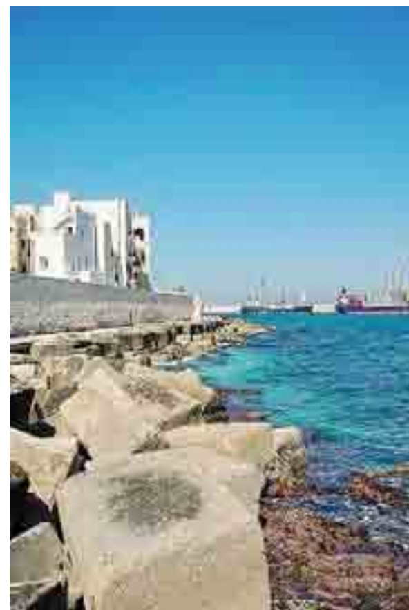
NO TAX A Monopoli, ancora bufera sulla tassa di soggiorno

MOLA PSICOLOGIA, PEDAGOGIA, IGIENE, PRIMO SOCCORSO, DIRITTI DELL'INFANZIA TRA LE MATERIE DELL'INIZIATIVA DEI VOLONTARI DEL MODAVI