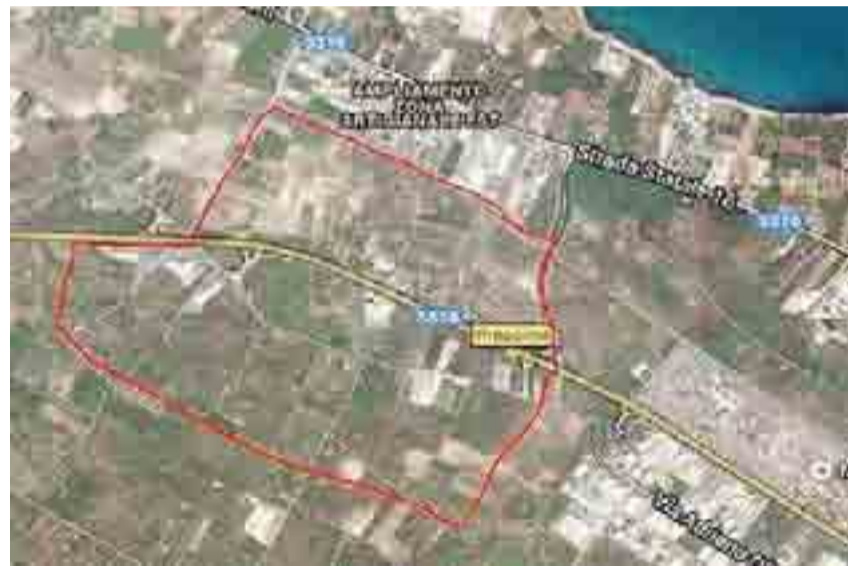
BISCEGLIE La perimetrazione prevista nella zona Asi

L'operazione viene giudicata «un pessimo affare». «La perimetrazione della zona ASI è discutibile anche nel metodo, il Comune agisce in nome di un documento urbanistico che non è stato ancora adottato (il PUG) e nel contempo fa appello al documento vigente (il PRG), dunque due piedi in una scarpa - conclude Di Tullio nel Forum - burocratizzando il dialogo con le istituzioni sovraordinate, l'Amministrazione cela di fatto quello che realmente è mancato e continua a mancare: la partecipazione dei cittadini alle scelte comuni, appare una forzatura decidere le sorti di 250 ettari di prezioso suolo agricolo, nonché di un'area paesaggisticamente rilevante, senza che aver coinvolto nella scelta tutta la cittadinanza, non risulta esserci un piano industriale degno di questo nome e non è chiaro quali tipologie di industrie andranno ad occupare gli spazi previsti».