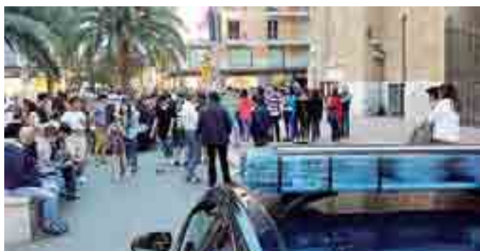
SAN FERDINANDO Capannello di passanti dopo l'aggressione

Un branco di ragazzini schiaffeggia l'uomo, poi fugge all'arrivo dei vigili urbani