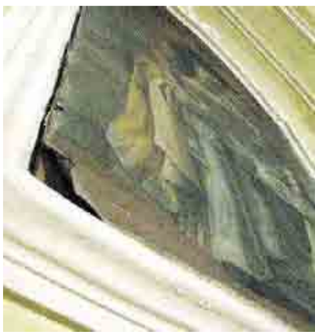
PIÙ ATTENZIONE E' chiesta per la chiesa di San Domenico

Trani, la richiesta di tutela l'ha portata al terzo posto in Italia