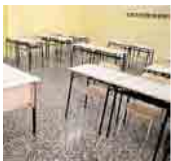
Una aula scolastica