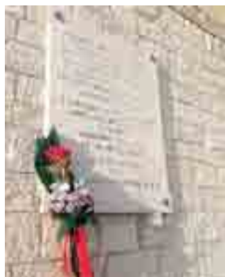
LA LAPIDE Ricorda l'episodio