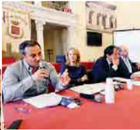
PIANO COMUNALE DELLE COSTE Ieri l'incontro promosso dall'Amministrazione comunale