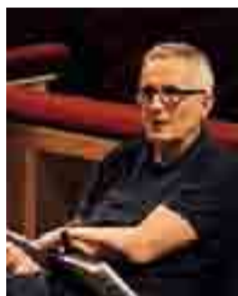
IL REGISTA Marco Bellocchio

Leggere e meditare sulla prefazione al volume, è un'operazione che l'appassionato più aperto mentalmente troverà gustosa oltre che arricchente. Le recensioni di Gallarati - allievo di Massimo Mila ed autore di altri interessanti volumi (ricorderemo il più recente L'Europa del melodramma. Da Calzabigi a Rossini ) - si leggono con estremo piacere ed anche quando il giudizio di fondo non è poi positivo, viene espresso con proprietà ed eleganza. Gallarati non è di quelli che per acquisire prestigio ed autorevolezza «sparano a zero»!