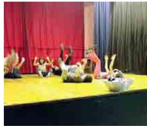
IMPEGNO E SORRISI Un momento delle prove dello spettacolo