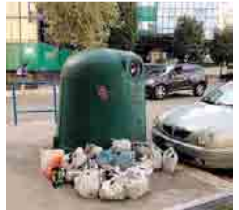
DEGRADO La campana è piena e le bottiglie fuori

«Stiamo parlando di piazza Trieste e Trento dove si trovano anche il palazzo degli uffici municipali, il comando della polizia municipale, la storica scuola elementare "Oberdan", la scuola media e sono presenti tante telecamere - prosegue Montaruli - Questo luogo in pieno centro cittadino è diventato ricettacolo di rifiuti abbandonati, in particolare bottiglie in vetro in enorme quantità, molto pericolose. A due passi da quel luogo indegno esiste anche il monumento ai Caduti del mare