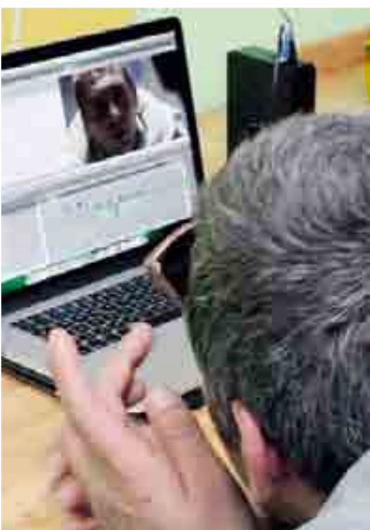
UNA SCENA DEL FILM «Very, very different»