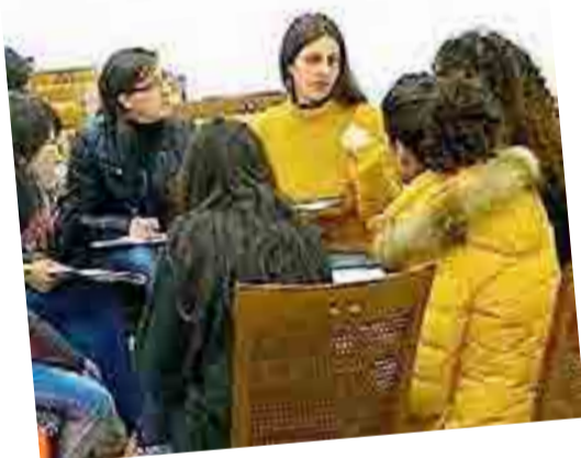
MOLA Lezioni per aspiranti «Tata»