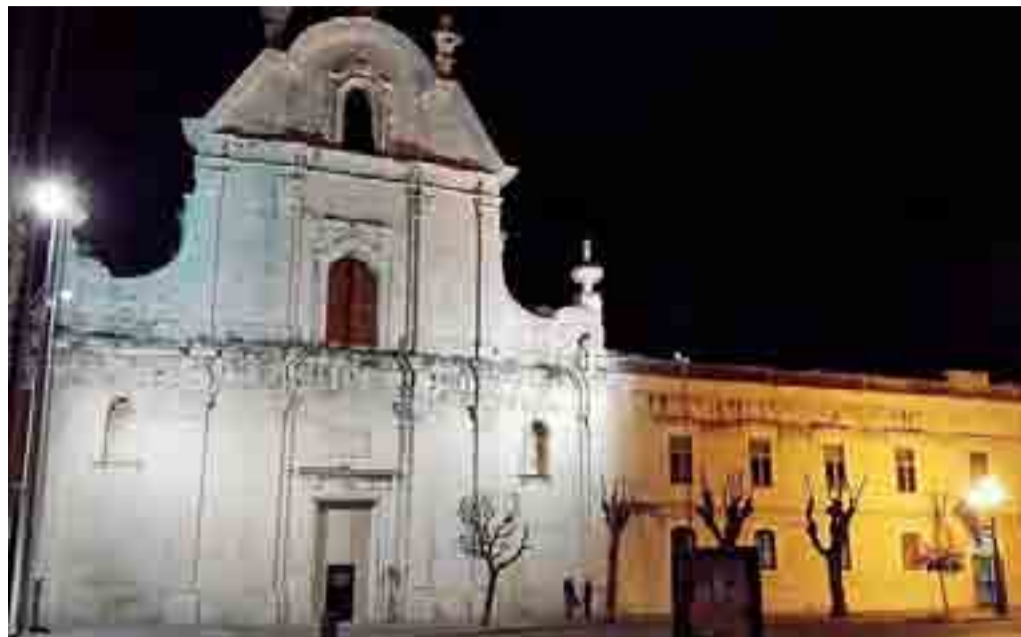
DA RESTAURARE La chiesa di Santa Maria del Pozzo

Il complesso comprende il campanile romanico e l'adiacente ex convento, da tempo adibito a carcere femminile