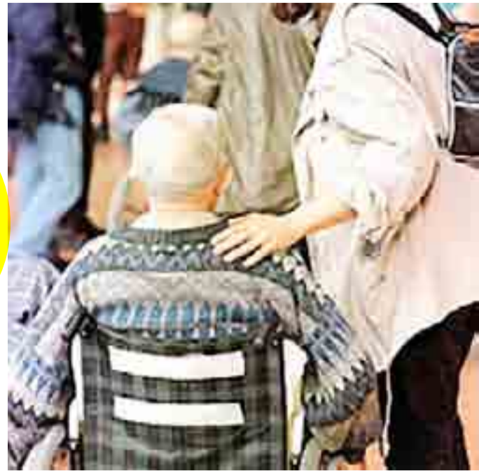
ASSISTENZA Tanti i campi di intervento per chi intende impegnarsi nel volontariato