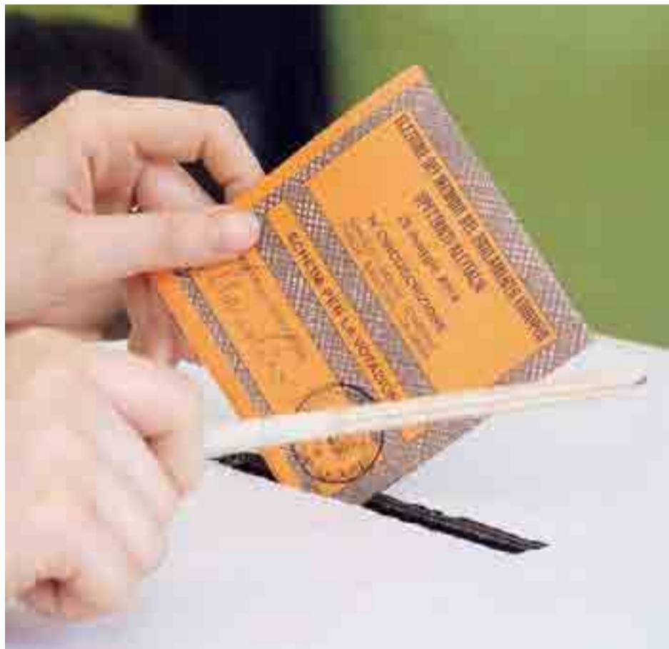
IL VOTO PER L'EUROPA Seggi chiusi ieri sera alle 23, poi lo spoglio delle schede elettorali

Altre quattro ore per recuperare, ma l'impresa si presentava davvero improba. [r.dal.]