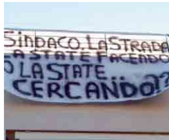
PROTESTE Uno striscione che campeggia su una delle abitazioni