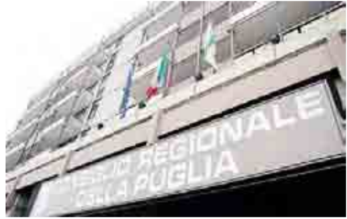
FERIE Il Consiglio regionale della Puglia sospende i lavori dall'11 al 22 agosto

Nello stesso periodo agostano saranno regolarmente aperti, invece, sia pure con inevitabile riduzione di personale, gli uffici al pubblico dei vari assessorati. [g. arm.]