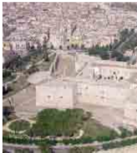
BARLETTA Una panoramica aerea