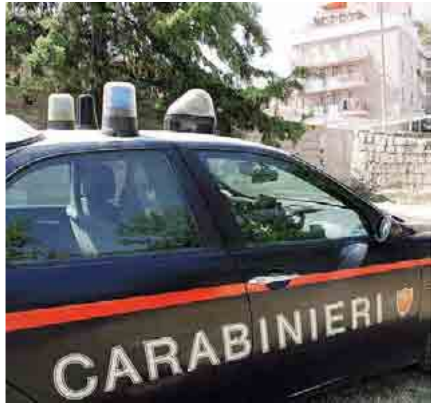
GIOVANE IN OSPEDALE Litigio in discoteca, sono intervenuti i carabinieri

Il giovane barlettano è attualmente ricoverato nel reparto di chirurgia del «Monsignor Raffaele Dimiccoli» e dovrebbe rimanerci almeno per una decina di giorni sotto la stretta osservazione, per le cure del caso, del personale medico e paramedico.