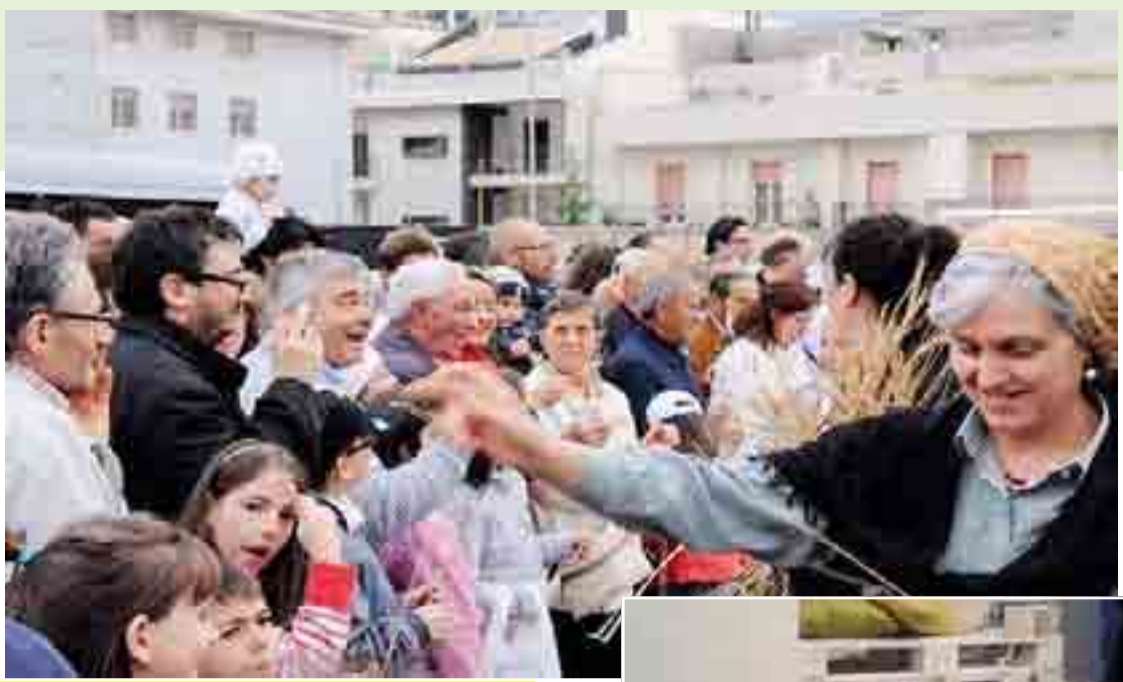
ALTAMURA ExpoMurgia è anche un momento per vivere o visitare la città, assaporare, conoscere le nuove realtà

A ffari & vita sociale. E' il binomio su cui da sempre punta ExpoMurgia. Non è solo una vetrina. E' anche un momento per vivere o visitare la città, assaporare, conoscere le nuove realtà.