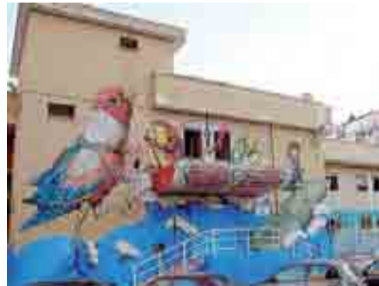
L'ex liceo Socrate è occupato dai migranti dal 2009

Conclude il primo cittadino: «Sono felice di chiudere dieci anni di buon governo con questo atto politico importantissimo dal punto di vista concreto e simbolico. L'ex Socrate diventerà un luogo di seconda accoglienza legale e questa è una realtà che può cambiare il destino non solo dei migranti, ma anche di chi li accoglie».