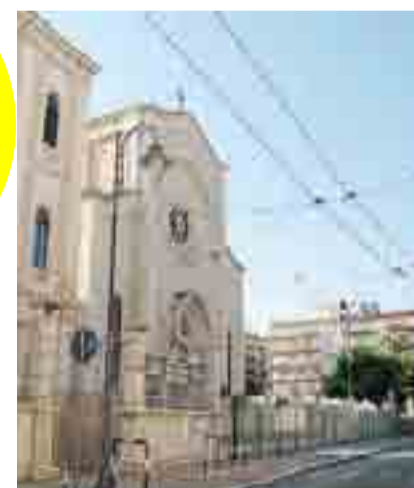
L'ORATORIO Piazza Redentore in festa

ternazionale dedicata dal 1919 a salvare la vita dei bambini e difenderne i loro diritti, svolgerà attività di supporto ai laboratori e alle iniziative e di promozione del «Punto Luce» aperto nel quartiere Libertà ed implementato dall'associazione Mama Happy. L'associazione Kreattiva effettuerà con i ragazzi i giochi multimediali sul tema dell'intercultura.