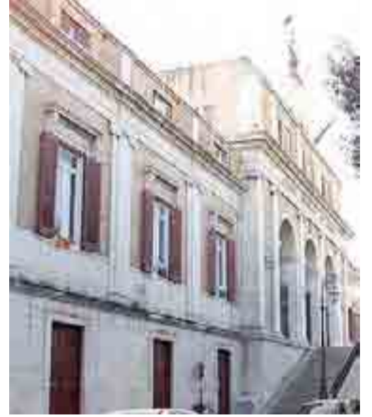
SENZA TREGUA La polemica tra maggioranza ed opposizione

La conclusione: «Che cosa ci racconteranno, questa volta? Quale favola? Quali scuse troveranno per giustificare una così grave situazione? I consiglieri di maggioranza faranno sentire il loro peso, se ne hanno uno? Sono consapevoli di avere una responsabilità diretta? Intanto in uno studio sulla situazione economico-finanziaria degli Enti locali da parte del Ministero degli Interni (piattaforma Openbilanci), sui dati dei finanziari capoluoghi italiani Andria è tristemente inserita nella top 10 dei Comuni finanziariamente meno virtuosi. Con che coraggio l'assessore al Bilancio sminuisce le gravi criticità evidenziate dalla Corte dei Conti?»