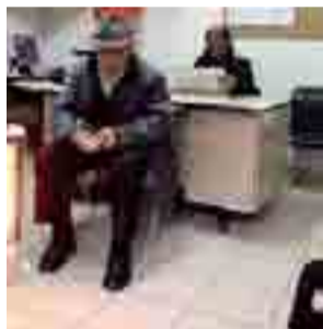
ASSISTENZA Verso una svolta

La II Commissione consiliare permanente ha quindi, su proposta del presidente, chiesto non solo di procedere all'assegnazione reale e concreta degli appartamenti di edilizia residenziale pubblica agli aventi diritto, ma anche di accogliere favorevolmente la proposta dell'Unitalsi di destinare l'immobile, con appositi propri finanziamenti rivenienti dall'8 x 1000, a centro disabili ed anziani. "La Commissione - ha quindi concluso il presidente Cannone - ha auspicato che gli Uffici comunali competenti accelerino l'iter amministrativo intrapreso, così da non perdere tale importante soluzione, chiedendo all'Amministrazione comunale di attivarsi immediatamente su tale importante vicenda, predisponendo i necessari indirizzi politici al Settore Socio-sanitario del Comune di Andria".