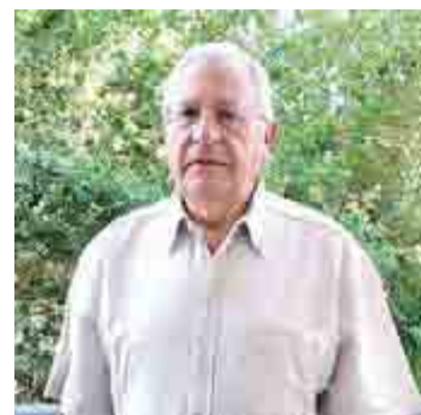
L'AUTORE Enrico Bagnato

La poesia raggiunge chi vuole, senza costrizioni, divieti ed ordini impartiti dall'alto. La poesia di Bagnato non chiede permesso e raggiunge il cuore di chi è disposto a lasciarsi andare.