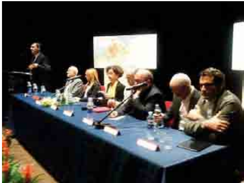
TEMPO DI PUG Un momento dell'illustrazione del «Piano» al teatro Lembo