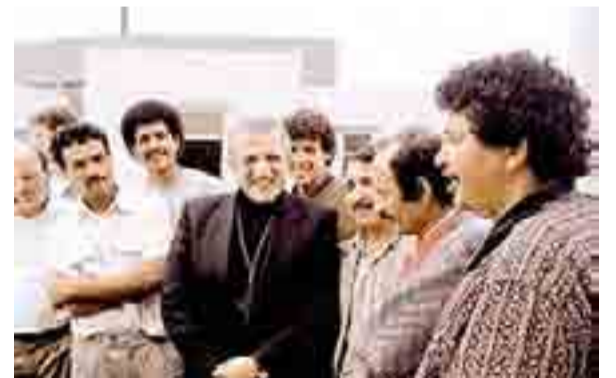
ACCUGLIENZA Don Tonino Bello durante uno dei suoi incontri pastorali e sotto il vescovo monsignor Luigi Martella

lo». L'incontro - si legge in un comunicato - promosso nel trentesimo anniversario dell'istituzione della Casa, vuole promuovere una riflessione sulla necessità di aprire i luoghi di accoglienza, ripensando modalità nuove di interscambio, che sappiano leggere e accogliere le istanze del tempo presente». «L'osmosi con il mondo esterno - aggiungono - crea circoli virtuosi di relazioni, incontri, scambi e opportunità concrete, indispen-