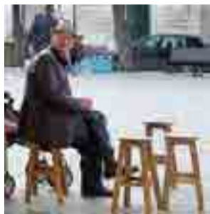
ATTENZIONE Ai pensionati

ANDRIA LA CONFRATERNITA CHE COLLABORA CON IL SERVIZIO DI PRONTO INTERVENTO DEL «118»