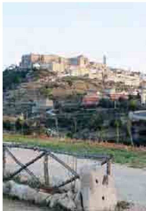
MINERVINO Una panoramica

MINERVINO NEI GIORNI SCORSI LA VISITA DEL POPOLARE ATTORE, ACCOLTO DAL SINDACO SUPERBO