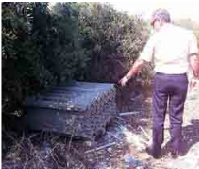
ABBANDONO CRIMINALE Lastre contenenti amianto in campagna

esempio come già segnalato, dalle coperture di alcuni dei capannoni in abbandono siti in contrada San Francesco molti anni addietro utilizzati come industria di bibite. Molto spesso però si verificano comportamenti incivili messi in atto da chi rimuove tegole e vasche di eternit e le smaltisce abusivamente, abbandonando impunemente nell'agro questo materiale potenzialmente pericoloso. La conferma viene dal nucleo delle guardie ambientali e dalla polizia provinciale che hanno segnalato al Comune la presenza di diverse micro discariche abusive a cielo aperto a Bisceglie, chiedendone la celere operazione di bonifica.