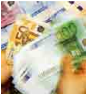
Rapinatori via col bottino

Insomma la sicurezza in città è minata da tanti episodi che quasi quotidianamente fanno registrare fatti di cronaca violenti e preoccupanti. [gd]