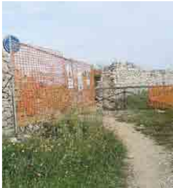
PISTA SBARRATA Il cantiere sulla pista ciclabile