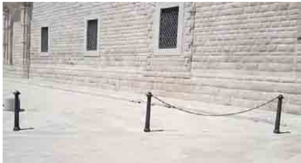
APERTO AL TRAFFICO Le catene sparite da uno dei varchi