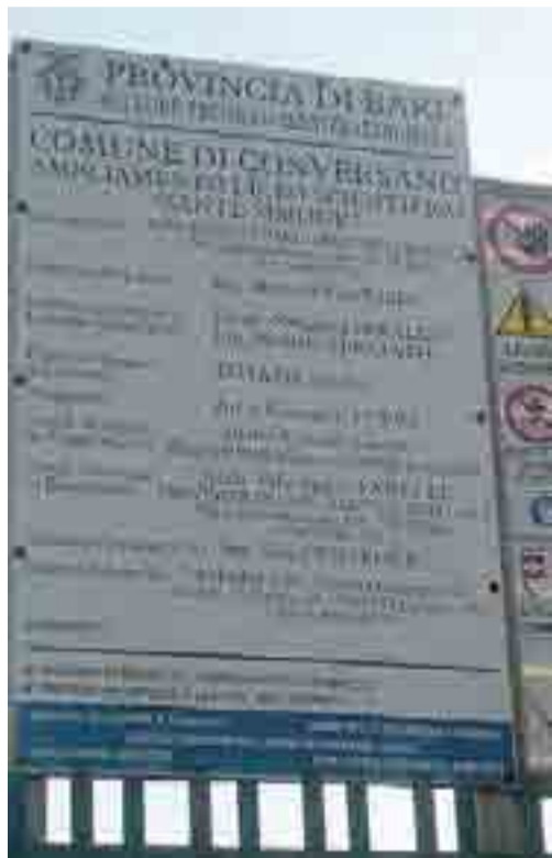
IL LICEO Il cantiere del «Simone» accusa ritardi

Agli assessori ai Lavori pubblici e alla Pubblica istruzione, il consigliere di minoranza chiede «di riferire al consiglio comunale lo stato dell'arte, quali sono gli atti formali di sollecito dell'amministrazione comunale nei confronti della Provincia per il prosieguo e la consegna dei lavori e quali sono gli atti che l'amministrazione comunale intende produrre per denunciare questi gravi ritardi sia alla Provincia che al prefetto di Bari».