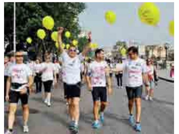
RACE FOR THE CURE La bellissima corsa di ieri a Bari

Ancora una volta è l'inesauribile energia dei bambini che cambia il mondo e la città. Così come mi piace ricordare che prima delle premiazioni sul grande palco eretto alla rotonda Giannella di fronte ai giardini alle spalle del mare si sono alternate delle cantanti di eccezione. E come non provare un'emozione profonda quando è toccato pro-