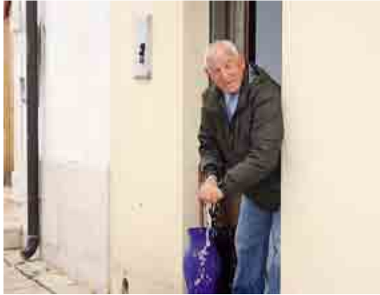
VIGILI AL LAVORO A Sammichele numerosi i locali al piano terra allagati (a sinistra un'immagine eloquente) In basso a destra una tromba d'aria nel cielo di Turi