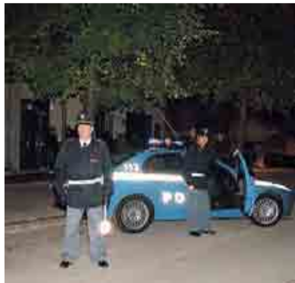
CONTROLLI NOTTURNI Per contrastare rapine ed aggressioni

Grazie alla coraggiosa reazione della vittima e all'immediato intervento dei carabinieri i rapinatori sono stati individuati e tratti in arre-