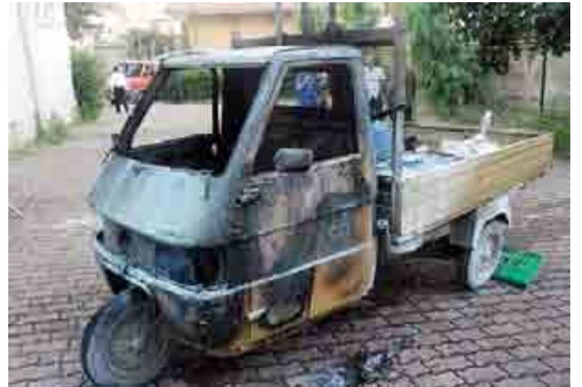
BINETTO Il mezzo per la raccolta dei rifiuti bruciato dalle fiamme

L'episodio cade alla vigilia della competizione elettorale in cui sono contrapposte due liste che in queste settimane hanno discusso in maniera accesa e approfondita del futuro della cittadina: le accuse non sono mancate. E gli ultimi comizi hanno lanciato un ampio dibattito sul futuro della città.