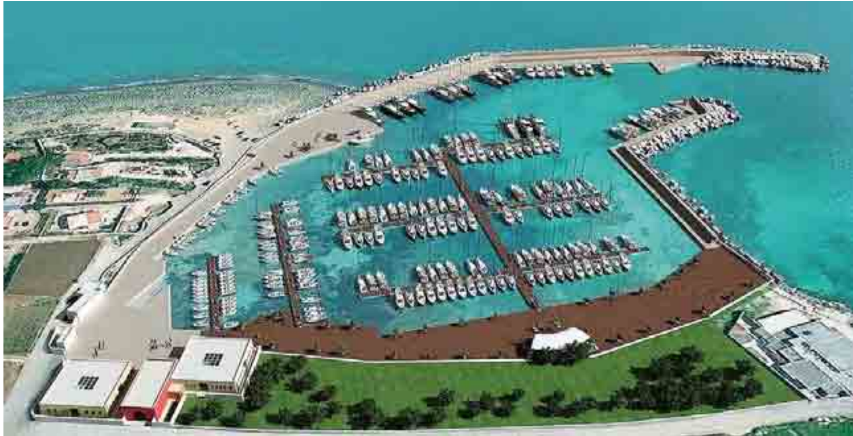
IL PROGETTO La visione aerea di Calaponte Marina nella grafica dei progettisti; in basso l'impianto come appare oggi oltre la recinzione che ancora lo divide dalla strada

«La società che gestirà l'impianto ha assicurato 40 posti al Comune. Dobbiamo capire come metterli a disposizione della gente»