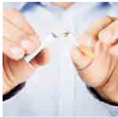
Oggi torna l'iniziativa della Lilt

«Aspirare alla vita» - si legge in un comunicato - un'azione volta a sensibilizzare l'opinione pubblica sugli effetti negativi derivanti dal consumo del tabacco sulla salute umana, significa anche decidere di volersi bene e rispettare la propria e l'altrui vita senza continuare a farsi del male consumando tabacco». Aspirare è un termine che appartiene al mondo dei fumatori, abituati ad aspirare sostanze nocive per loro e per chi li circonda, ma significa