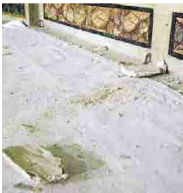
SEGNI DEL TEMPO Necessari interventi di tutela