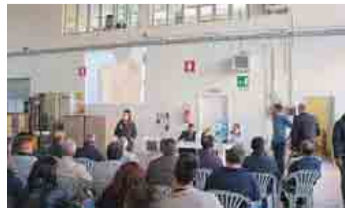
SOCCORSI NEI CAMPI Un momento dell'iniziativa