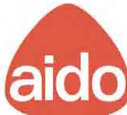
LOGO Associazione italiana donatori organi

Successivamente, alla fine di giugno (data da stabilire), presso la sede AVIS di Trani (in