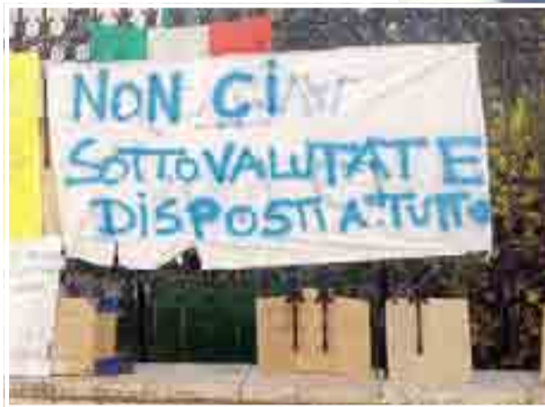
GRAVINA Il sit-in di protesta dei disoccupati davanti a palazzo di città

nuazioni di ogni genere hanno toccato il mio, il nostro essere persone, provocando in me, in mio marito e soprattutto, e sottolineo soprattutto, in nostro figlio, di appena 10 anni, uno smarrimento unico. Ebbene sì. Suo padre è stato anche minacciato di morte oggi», si legge sulla pagina facebook dell'assessore, che ha denunciato tutto alla Procura. Come già era accaduto in passato, con risposte immediate dal mondo della giustizia.