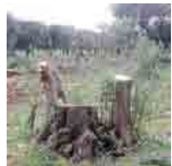
MALATO Albero d'ulivo sezionato

«Il Ciheam di Bari - dicono ancora in una nota - fu scelto come sede per lo svolgimento del corso perché da oltre 30 anni si occupa di prevenire e controllare l'entrata di patogeni da quarantena non solo a livello regionale, ma in tutta l'area mediterranea. Il Centro di ricerca internazionale, quindi, è dotato di strutture idonee a manipolare patogeni da quarantena, garantendone l'assoluto isolamento. I ceppi del batterio utilizzati durante il corso - si legge ancora -