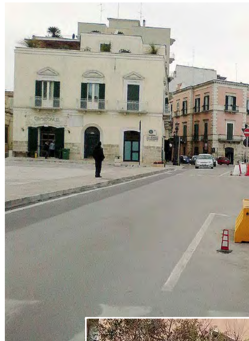
PIANO TRIENNALE In alto, piazza Marconi dove è previsto il rifacimento della rotatorie. A destra, la scuola di Palombaio: l'edificio dovrebbe essere interessato da lavori di manutenzione

guarda il piano di edilizia scolastica. Grazie infatti al piano del governo di Matteo Renzi per le scuole, Abbaticchio potrà utilizzare, in deroga al patto di stabilità, più di un milione di euro che sarà utilizzato per la sistemazione del plesso centrale della «Don Milani» di Palombaio e altri interventi di manutenzione straordinaria negli edifici scolastici della città. I progetti, così come richiesto dal governo, sono immediatamente cantierabili e i lavori, intoppi burocratici permettendo, potrebbero partire in tempi davvero rapidi.