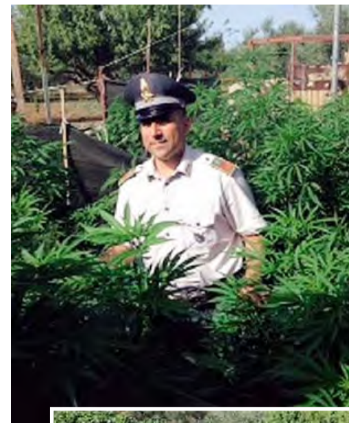
MARIJUANA NELL'ORTO Trenta piante di marijuana scoperte dai finanziari in un orto. L'uomo arrestato avrebbe ricavato oltre mille dosi per un valore di circa 10mila euro

Il micro-clima favorevole della zona rendeva un ulteriore contributo per la crescita rigogliosa delle piante per la cui cura venivano utilizzati fertilizzanti e prodotti chimici specifici. I finanziari dopo aver estirpato le piante le hanno sequestrate insieme ai semi che erano pronti per essere seminati: l'uomo è stato arrestato in flagranza per coltivazione illecita di sostanza stupefacente e sottoposto agli arresti domiciliari.