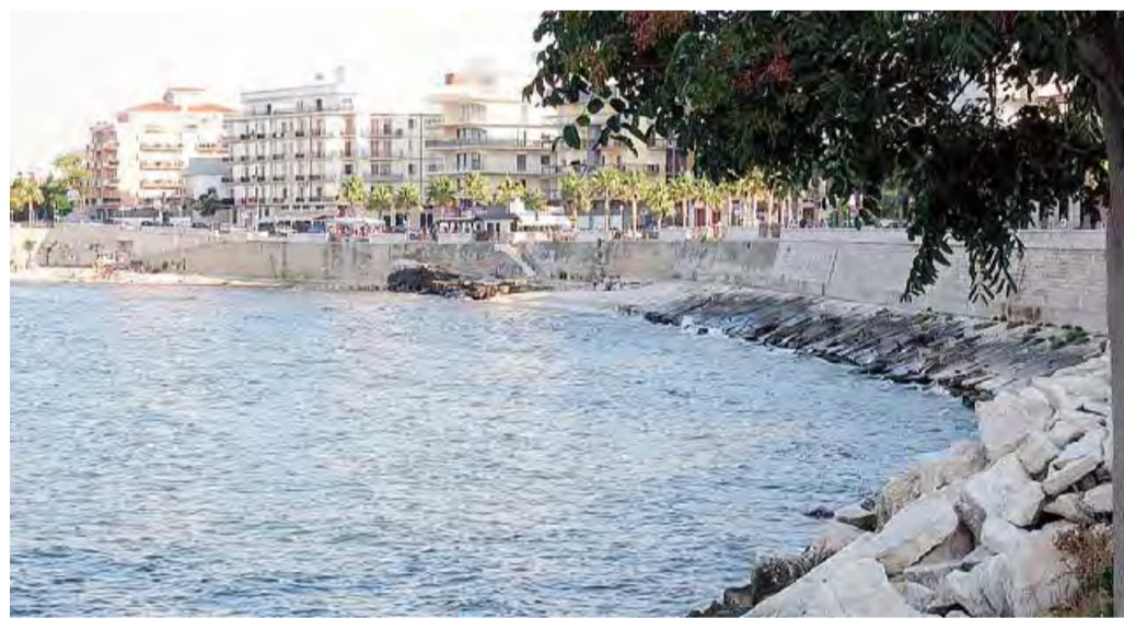
TEATRO DELLA MANIFESTAZIONE Il lungomare verso Colonna

Quanto alle Matinelle, «è l'unico punto del litorale coincidente con i rilievi dell'Arpa (che finora ha certificato il mare di Trani come "eccellente", ndr) - conclude l'esponente di Legambiente -, perché Goletta prevede il 60 per cento delle sue analisi agli sbocchi ed il 40 ai lidi: se dovessero emergere criticità anche lì, il cittadino ne tragga le conclusioni».