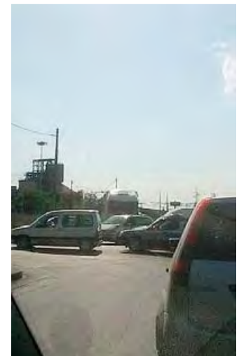
IN CODA In via Andria

Anche le corse di treni della Ferrottramviaria, intensamente utilizzate dai più giovani, potrebbero essere ricollegate con corse di bus per il mare in modo da evitare un considerevole flusso di pedoni (spesso indisciplinati) in una zona ad elevato traffico e, quindi, ad alto rischio.