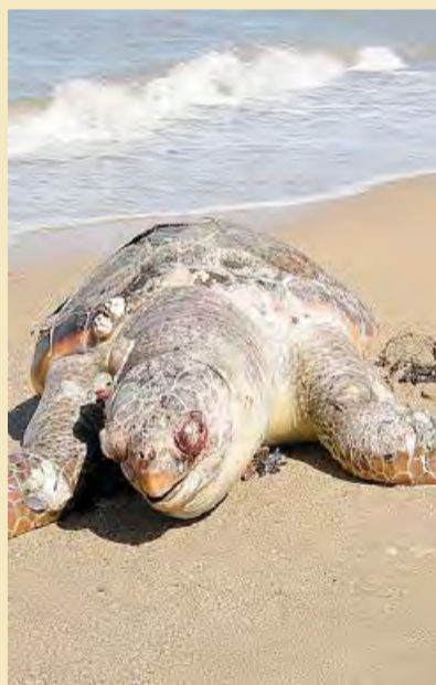
PRIVA DI VITA Una «Caretta caretta»