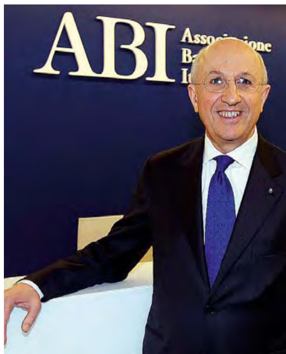
PATUELLI Il presidente dell'Abi oggi riunisce l'esecutivo

aumentate a 168,5 miliardi, +24% rispetto ad un anno fa. Segnali meno negativi arrivano invece dal fronte dei prestiti, che a giugno sono stati pari a 1.842,7 miliardi in calo del 2,2% rispetto alla caduta del 3,1% del mese precedente. Se i dati sul Pil dovessero migliorare non è escluso, sottolineano all'Abi, che i prestiti entro fine anno possano prima azzerare la caduta e poi tornare positivi tra i prestiti specie da quelli alle famiglie.