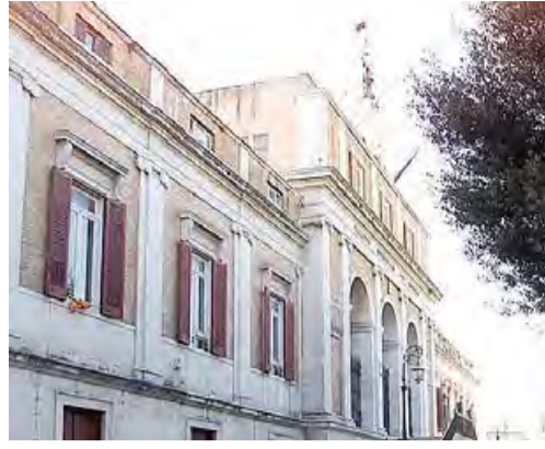
ELEZIONI IN VISTA Andria, il Comune

La presa di posizione dei Giovani Democratici