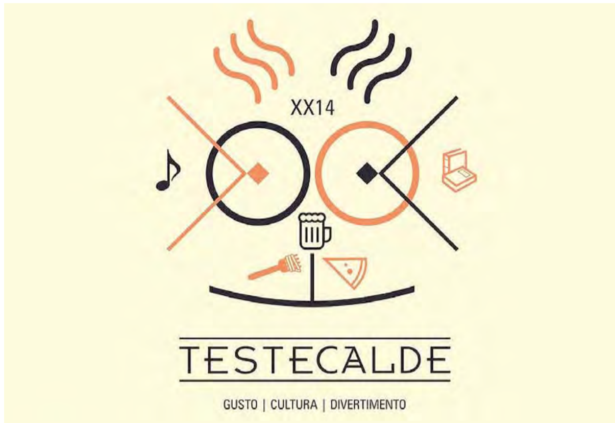
IL LOGO A sinistra il logo del locale che verrà inaugurato questa sera alle 20