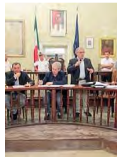
CONSIGLIO Torna oggi

L'EVENTO -Stasera, in collaborazione con il presidio Libera di Barletta, saranno ospitati i volontari delle altre città per un bel momento di socializzazione. Un appuntamento utile soprattutto perché serve a confrontare le esperienze, scambiare informazioni sui temi dell'antimafia ed anche, più semplicemente, scambiare quattro chiacchiere in buona compagnia. La serata sarà allietata da tanta musica e divertimento.