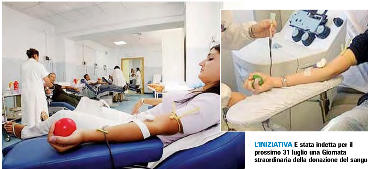
L'INIZIATIVA È stata indetta per il prossimo 31 luglio una Giornata straordinaria della donazione del sangue

Sappiamo bene, infatti, che il sangue è un farmaco non riproducibile in laboratorio e, se dovessimo averne mai bisogno, potrebbe esserci donato unicamente dall'altruismo di un uomo.