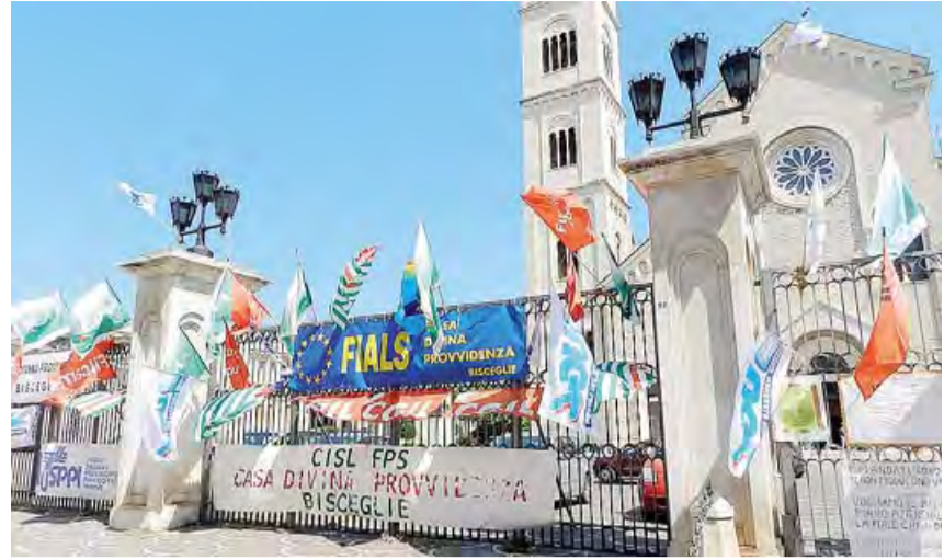
PROTESTA PERENNE L'ingresso della Casa divina provvidenza a Bisceglie