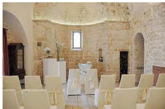
MATRIMONI Uno dei luoghi dove poter svolgere il rito civile

● BISCEGLIE. Per la celebrazione dei matrimoni civili a Bisceglie si dovrà osservare un regolamento comunale, approvato dalla giunta, formato da otto articoli. Oltre al sindaco, su richiesta degli interessati, le nozze civili possono essere celebrate da consiglieri ed assessori, nell'orario di servizio dell'Ufficio di Stato Civile (o previo pagamento di una tariffa se fuori orario) nei seguenti luoghi: sala consiliare (al momento inagibile), atrio del palazzo di città, ex monastero Santa Croce e anfiteatro sul mare. Sono esclusi dalle celebrazioni dei matrimoni civili i seguenti giorni: 1 gennaio, Pasqua e Lunedì dell'Angelo, XXV Aprile, 1° Maggio, festa patronale di agosto, 8 dicembre, dal 24 al 26 dicembre e 30 e 31 dicembre. Va presentata un'apposita domanda quindici giorni prima del lieto evento. Le tariffe non comprendono servizi aggiuntivi: l'allestimento della sala, l'esecuzione di musica e canti. Il regolamento stabilisce che «non è ammesso prima, durante e dopo il rito, il lancio o lo spargimento di riso, pasta, confetti, petali, coriandoli o altro materiale che crei pericolo per terzi e che imbratti luoghi per loro