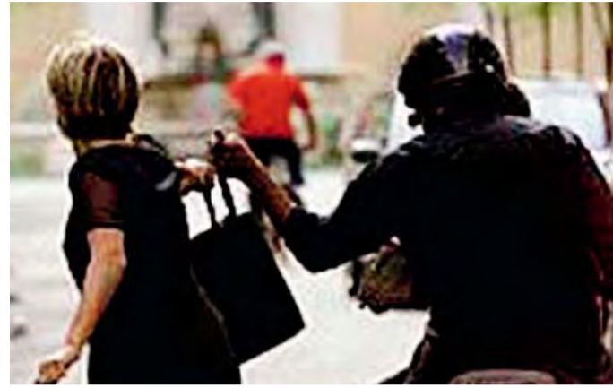
SCIPPATORI Tre giovanissimi sono stati acciuffati dai carabinieri dopo la denuncia della vittima

I tre avrebbero aggredito alle spalle un 65enne tranese che passeggiava in via Amedeo