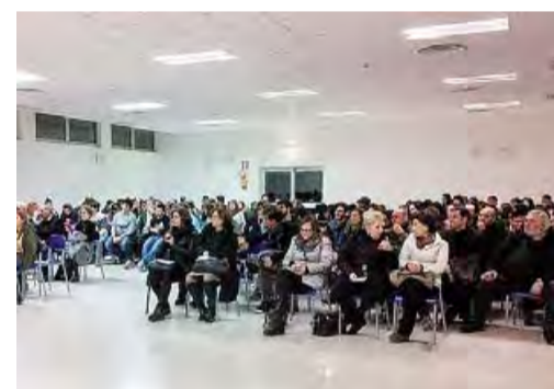
FILOSOFIA Incontro all'auditorium del liceo

«Quella immediatamente successiva alla comparsa del mes-