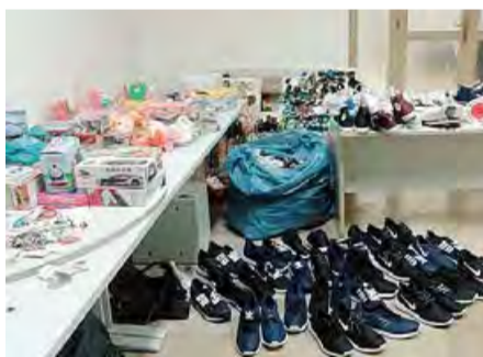
CONTRAFFATTA La merce sequestrata

I venditori privi di autorizzazioni ed extracomunitari hanno abbandonato le bancarelle e si sono dati alla fuga tra la gente. Il servizio della polizia municipale è stato predisposto a seguito delle numerose segnalazioni degli esercenti regolari del mercato. [ldc]