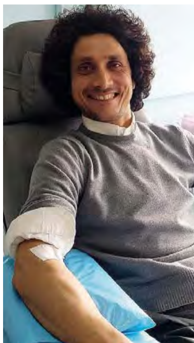
CIVILTÀ Un donatore di sangue

● TRANI. Continua a mietere successo il concorso fotografico dell'Avis targato «selfie» con l'obiettivo è reclutare iscritti soprattutto giovani nell'ambito del magico mondo della donazione di sangue. «Fatti un selfie mentre doni il sangue, e partecipa all'originale concorso che l'Avis Trani ha deciso di dedicare agli iscritti», scrivono i donatori. È possibile partecipare fino al 1 maggio, postando il selfie sulla propria bacheca facebook e taggando la pagina dell'Avis Trani. Vincitore sarà chi pubblicherà la foto che al primo maggio avrà ricevuto il maggior numero di «mi piace». Il premio sarà un week end per due persone.