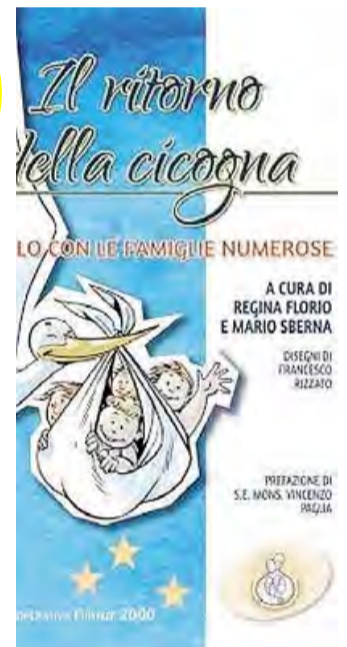
IL LIBRO Domani la presentazione