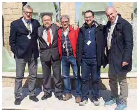
DONATORI La rappresentanza della «Lattanzio»