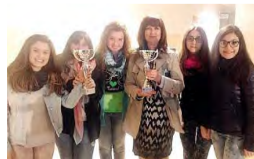
PRIMI Alunne della media «Marconi»