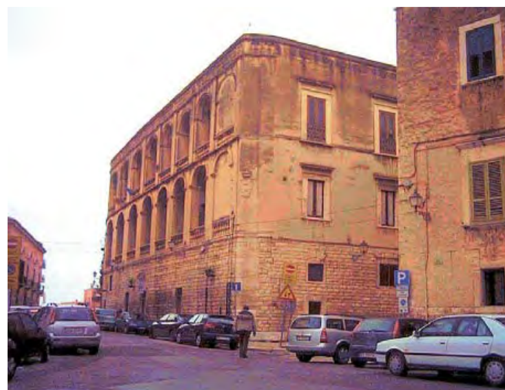
VERSO IL VOTO Polemica per la scelta degli scrutatori