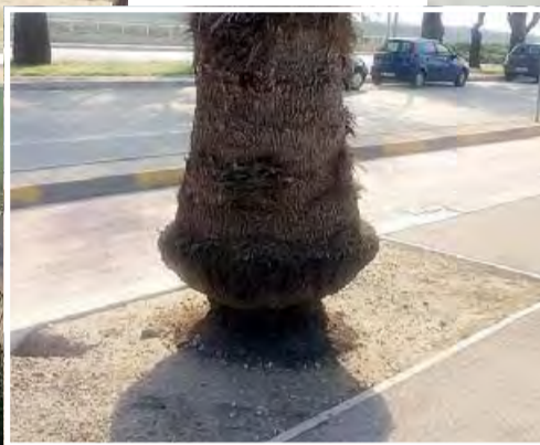
BRUTTO E BELLO Clic della manutenzione mancata e tramonto «californiano»