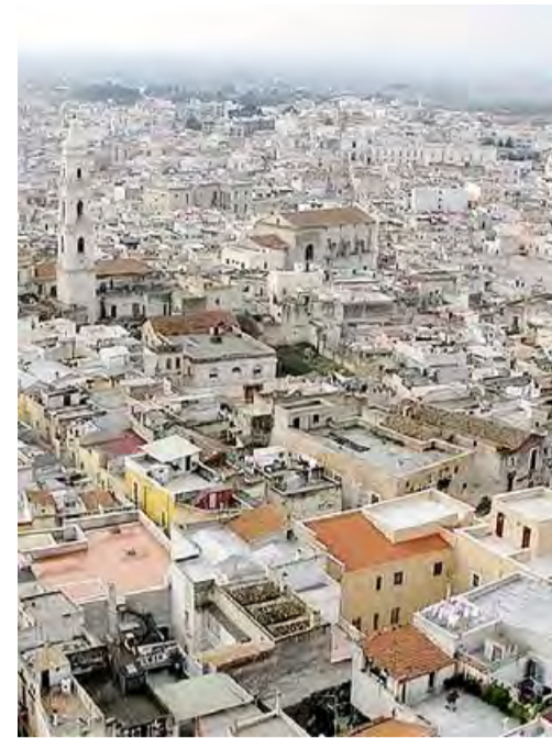
SCUOLA PER ADULTI Attivata una nuova opportunità in città

È stato istituito presso la scuola secondaria «Gaetano Salvemini»