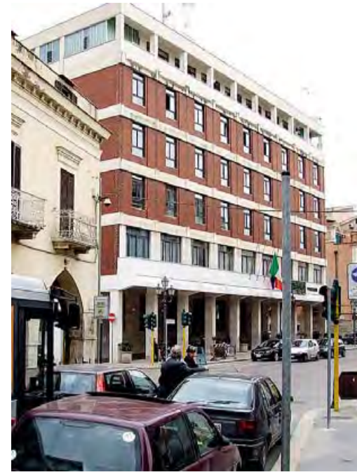
INIZIATIVA PER IL WEB Barletta, veduta su Palazzo di città

internet del Comune di Barletta, di conoscere meglio il ruolo e l'attività di ogni singolo consigliere comunale, proprio attraverso l'attività svolta al fine di essere più vicino ai cittadini».