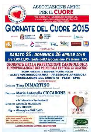
- Giornate del Cuore 2015

Due giornate dedicate alla prevenzione cardiologica per l'individuazione dei principali fattori di rischio.