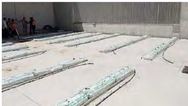
L'ESPERIMENTO L'orto sul cemento all'interno del carcere

Ogni martedì, da un mese, lasciano le sbarre alle spalle. Per tagliare siepi, eliminare sterpaglie e ripulire aree verdi di tutti: quelle del Parco nazionale di Lama Balice, un polmone che dal mare alla Murgia ossigena una gran fetta di area metropolitana. E lo