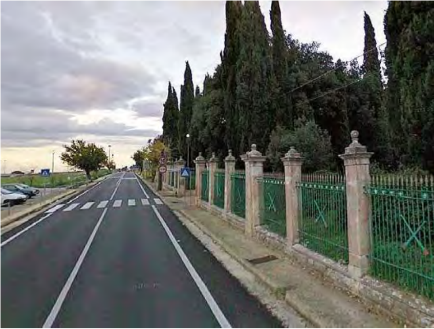
PERIFERIA Il cimitero alle porte di Minervino