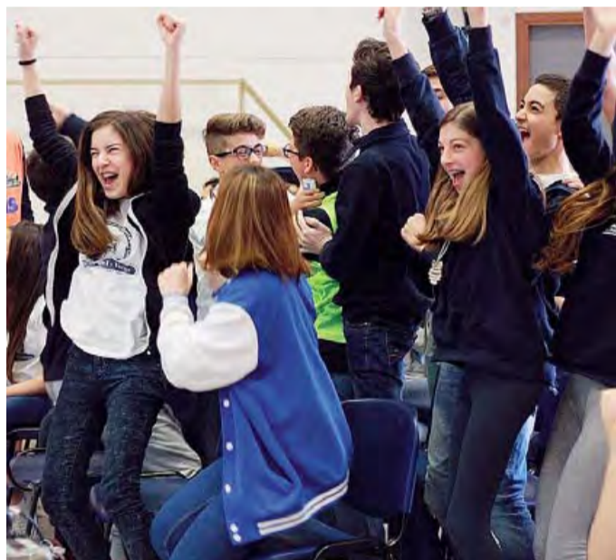
MILLE RAGAZZI COINVOLTI Entusiasmo tra gli alunni del concorso

Si è concluso il tour barese nelle scuole