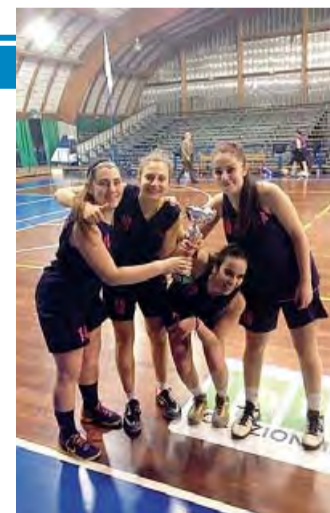
PINK BARI Vittoria con sorriso

Nell'ultimo quarto le due squadre si sono fronteggiate con vigore e la maggiore freschezza atletica delle campane hanno riportato il punteggio in equilibrio a pochi minuti dalla fine. Ma le baresi guidate in regia da Scara-