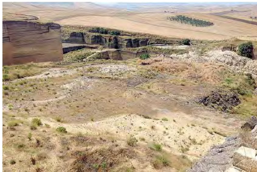
SARÀ UNA DISCARICA? L'area interessata dagli impianti

Il documento inviato dalla Cogeam ha evidenziato numerose incongruenze