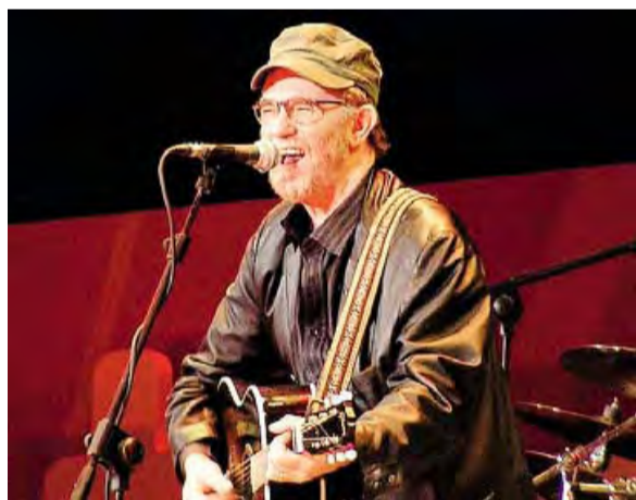
CANTAUTORE Francesco De Gregori