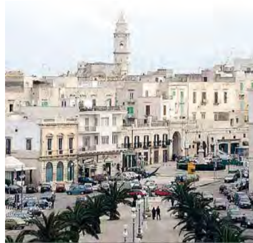
RILANCIO DEL TERRITORIO Una veduta di Molfetta