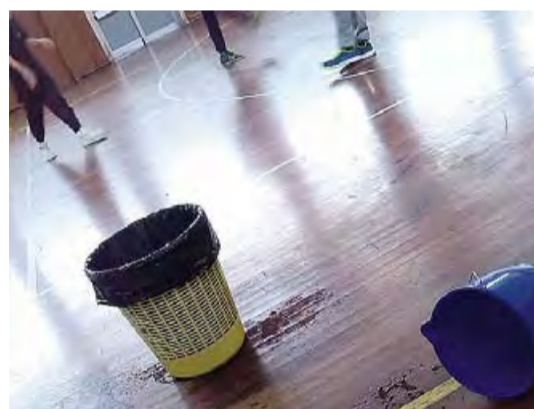
CADE L'ACQUA | Un secchio per contenere l'acqua

sodi come quelli dei giorni passati, che hanno messo a rischio la sicurezza degli studenti e compromesso lo svolgimento delle attività didattiche».