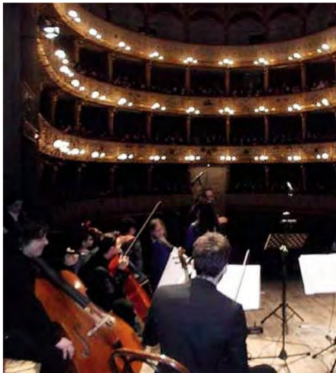
BARLETTA «Diffrazioni sonore» al Curci

■ Selezione volontari per progetti di servizio civile In attuazione del Bando dell'Ufficio Nazionale per il Servizio Civile - Regione Puglia - per la selezione di volontari da impiegare in progetti di servizio civile nel territorio pugliese, ai sensi della legge 6 marzo 2001, n.64, pubblicato il 16 marzo 2015, il Comune di Andria comunica che verrà effettuata una selezione per un numero complessivo di 10 unità (volontarie e volontari) da impiegare, nel territorio comunale, nei seguenti progetti di servizio civile: "Rinverdir tutt'ora" (5 posti) e "Fare strada insieme" (5 posti). Tutte le informazioni riguardanti i progetti di servizio civile possono essere richieste all'Ufficio Servizio Civile del Comune di Andria, piazza Umberto I (dalle 9 alle 12, dal lunedì al venerdì - telefono 0883 290290) e sono comunque acquisibili attraverso l'apposito link Servizio Civile Nazionale del sito internet istituzionale del Comune di Andria ( www.comune.andria.bt.it ). Le domande di ammissione dovranno essere inviate alla attenzione del Responsabile Servizio Civile Nazionale e dovranno pervenire entro e non oltre le ore 14 del 16 aprile 2015 presso il Servizio Protocollo del Comune di Andria, con sede in Piazza Umberto I - Andria. Il corretto procedimento di presentazione delle domande, nonché la relativa modulistica, possono essere visionati consultando i seguenti link: http://www.serviziocivile-regione.puglia.it http://www.comune.andria.bt.it/AlboPretorio/Concorsi