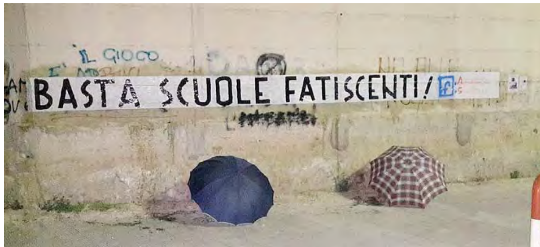
LO STRISCIONE DI PROTESTA | ragazzi si sono deliziati con un messaggio inequivocabile