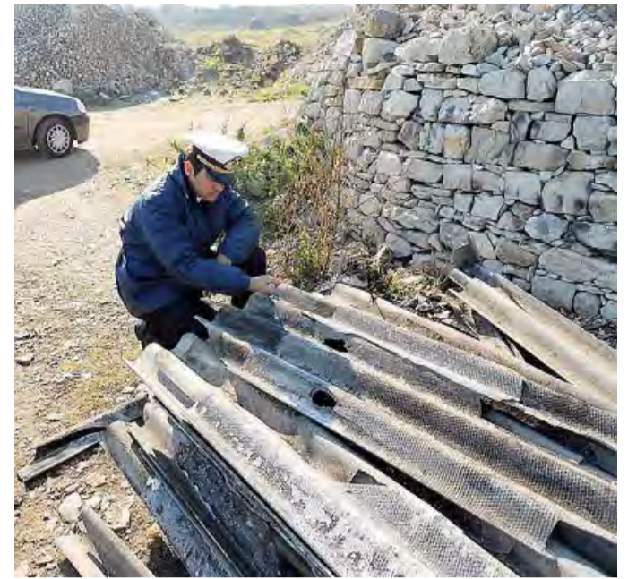
ABBANDONO DIFFUSO Quello delle lastre di eternit

Stanziati per consentire lo smaltimento in sicurezza