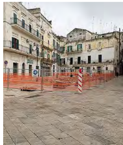
GRAVINA Il cantiere in piazza della Repubblica

tieri nel rione Fondovico, oggi privo di una rete fognaria efficiente. Il rione mostrerà il suo nuovo volto fatto di strade ripavimentate, nuovo basolato, miglioramento dell'arredo urbano, adeguamento delle reti idrica, fognaria e di pubblica illuminazione. Sempre nell'ambito di «Gravina Reset» si interverrà per la riqualificazione dei margini urbani. [ma.dim.]