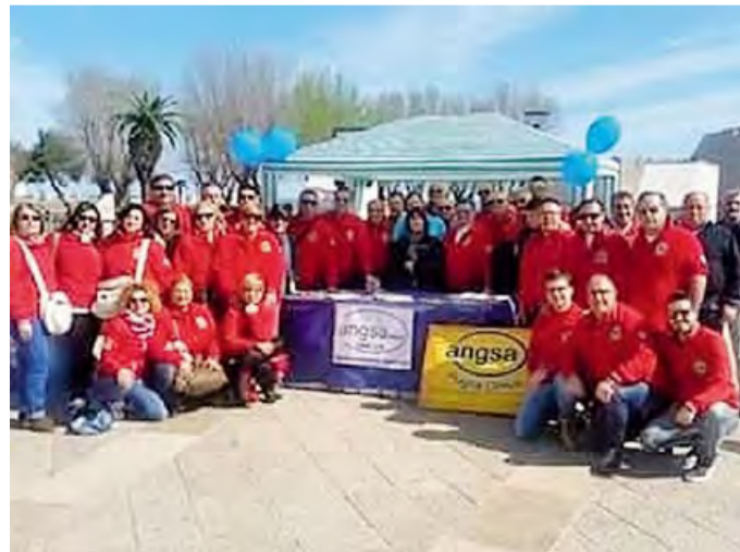
ENTUSIASMO | La foto di gruppo con i volontari