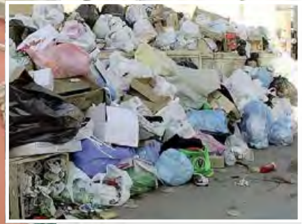
MONOPOLI A Palazzo di città è polemica sulla gestazione dell'Ambito di raccolta ottimale dei rifiuti (Aro 8)

MONOPOLI TIENE BANCO LA GESTAZIONE DELL'AMBITO. SOTTO ACCUSA L'AMMINISTRAZIONE ROMANI CHE «HA GESTITO LA QUESTIONE IN MODO FRETTOSO»