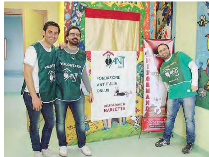
SORRISI E BURATTINI | Gli animatori che hanno recitato per i bimbi

I bimbi li guardavano sorpresi forse senza realizzare cosa ci facevamo lì, vestiti da pagliacci, in un luogo dove tutto è sempre diverso. Poi, pian piano, in compagnia della mamma o dei papà, si sono