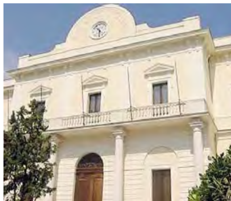
GRAVINA Il Comune