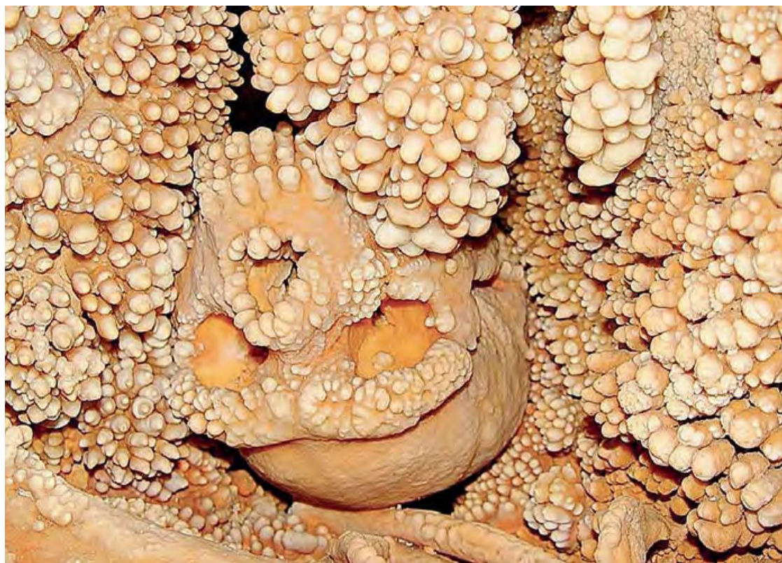
ALTAMURA I recenti dibattiti sulla datazione dell'Uomo preistorico stanno attirando un numero crescente di turisti