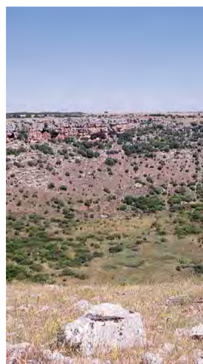
DOLINA CARSIKA Un'immagine del Pulo