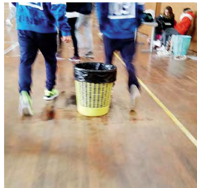
DISAGI | ragazzi mentre fanno attività ginnica

«Oltre alla scarsa attenzione, gli istituti pagano gli scarsi investimenti pubblici e la manutenzione sempre più carente»