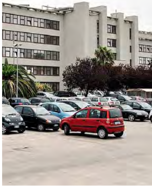
IL PROCESSO Il Tribunale penale di Bari