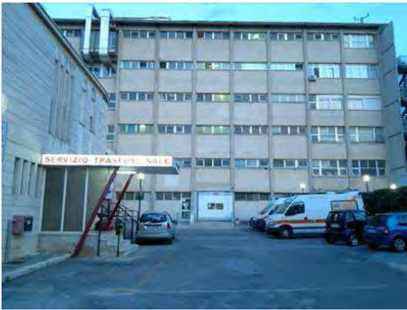
Ospedale di Molfetta