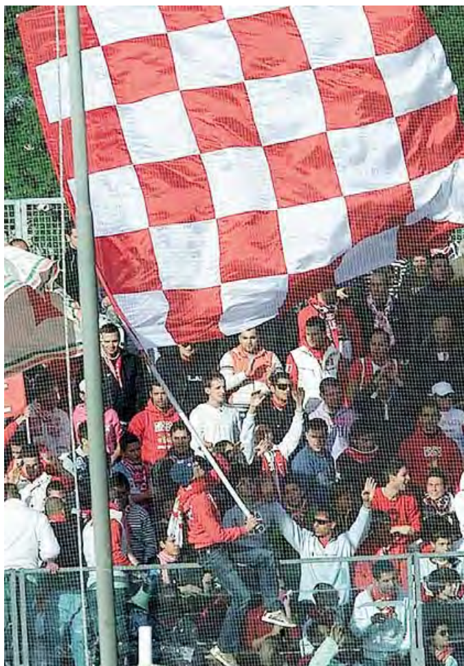
PROGETTO BARLETTA Tifosi biancorossi in attesa di novità (Calvaresi)

CALCIO SERIE D VINCENZO DE SANTIS, NUOVO DIRETTORE SPORTIVO