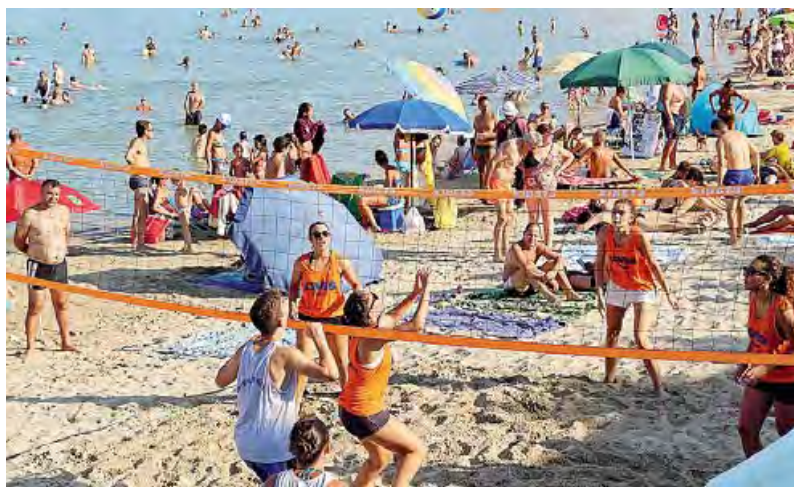
SPORT E SOLIDARIETÀ La manifestazione dell'Avis alla Baia del Pescatore a Trani

● TRANI. Concluso con un bilancio positivo il consueto appuntamento con lo sport e la solidarietà organizzato dalla sezione tranese dell'Avis sulla spiaggia della Baia del pescatore, nell'incantevole scenario della penisola di Colonna di Trani. L'Avis nel week end ha proposto la formula collaudata della sensibilizzazione alla donazione di sangue unita alle attività sportive di calcio e volley. Di scena l'undicesima edizione del beach soccer e la nona del sand volley, tradizionale appuntamento estivo che ha visto la partecipazione di oltre 200 persone, per lo più giovanissimi. L'edizione 2015 ha registrato un boom di iscritti: 16 le squadre di volley ai nastri di partenza, 6 quelle di beach soccer. Sfide entusiasmanti, iniziate sabato pomeriggio e concluse soltanto ieri sera, nonostante il gran caldo ma col conforto del mare, pronto ad accogliere in ogni momento giocatori e spettatori. Ai due tornei classici, l'Avis ha aggiunto un altro momento sportivo, la "Camminavis", una mini maratona non competitiva per le vie del lungomare ideata con la collaborazione di 3 associazioni locali del mondo dell'atletica: Trani Marathon, Tommaso Assi e Road Runners. Al termine della