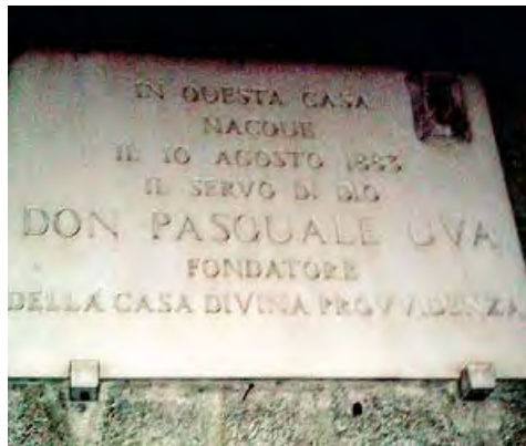
LA TARGA L'epigrafe errata