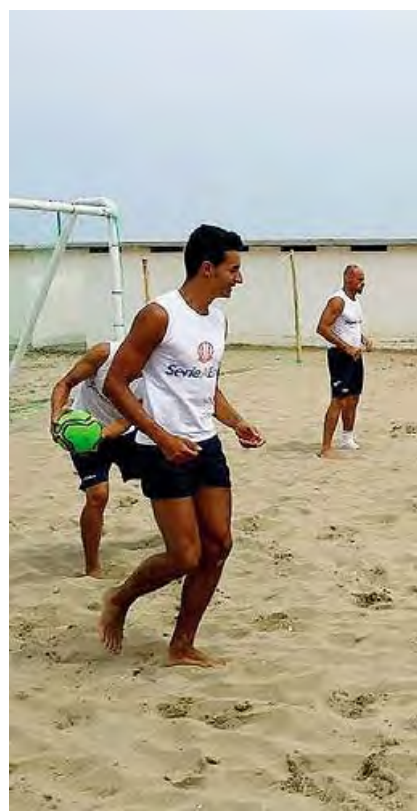
Il Barletta Beach Soccer in allenamento

LA PROSPETTIVA -Dietro questa situazione, qualora le suddette strade non dovessero portare ad una soluzione, è inutile nascondere che c'è la seria prospettiva che Barletta, o meglio, la città della Disfida nel calcio potrebbe essere rappresentata dall'Audace Barletta di Prima categoria.