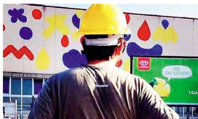
Dopo lo stadio «San Pio» oggi tocca alla parete d'ingresso delle piscine