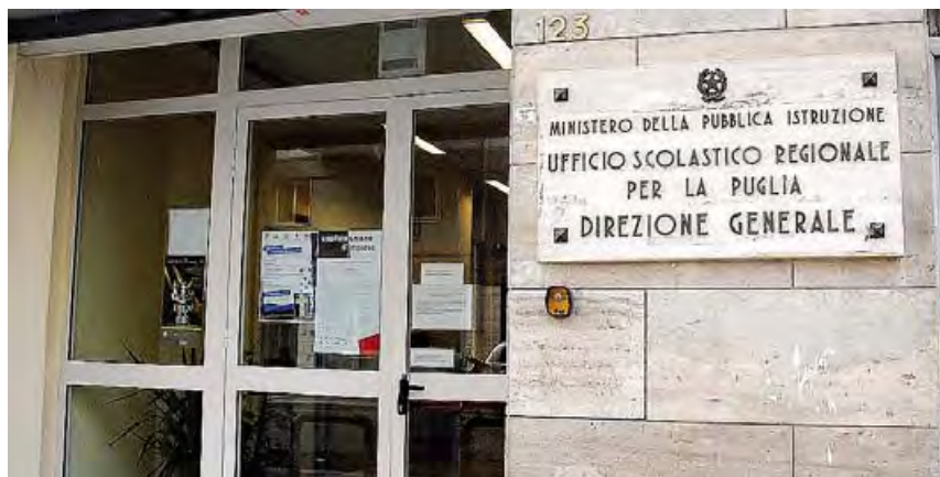
PROTESTA Oggi sit-in davanti all'ufficio scolastico regionale

Dall'esame attento delle tabelle che riassumono le assunzioni previste, è infatti possibile notare come alcune aree risultino penalizzate. I docenti di sostegno nelle graduatorie per insegnare alle scuole medie superiori sono suddivisi in quattro aree: la scientifica (ad01), la umanistico-linguistico-musicale (ad02), la tecnico-professionale-artistica (ad03) e la psicomotoria (ad04). Dei 92 docenti precari che diventeranno titolari di una cattedra di sostegno tra qualche mese nella provincia di Bari, 41 appartengono alla prima area, 46 alla seconda, zero alla terza e 5 alla quarta. E sono proprio i precari dell'area tecnica che oggi protestano con un sit in dinanzi all'Ufficio Scolastico Regionale della Puglia, durante un incontro con i sindacati, e valutano un ricorso al Tar.