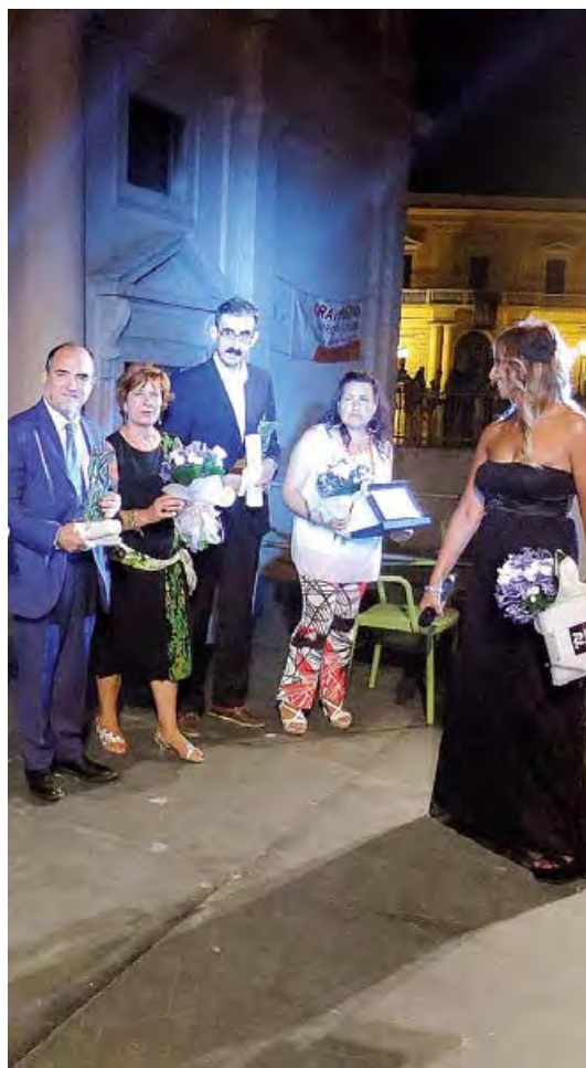
LA CONSEGNA Una fase della serata

CANOSA LA CERIMONIA SI È TENUTA SUL SAGRATO DELLA CATTEDRALE DI SAN SABINO