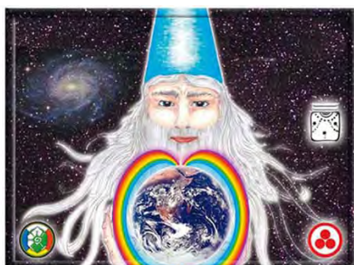
BARI FIERA DEL LEVANTE PAD. 181 SAN NICOLA

Centro di Servizio al Volontariato San Nicola