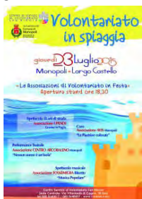
La locandina dell'evento

La festa itinerante del volontariato, organizzata dal Centro di servizio al volontariato “San Nicola” con le associazioni dell’area della ex provincia di Bari, quest’anno si concluderà con l’evento “Volontariato in spiaggia”, giovedì 23 luglio a partire dalle 18.30 a Monopoli.