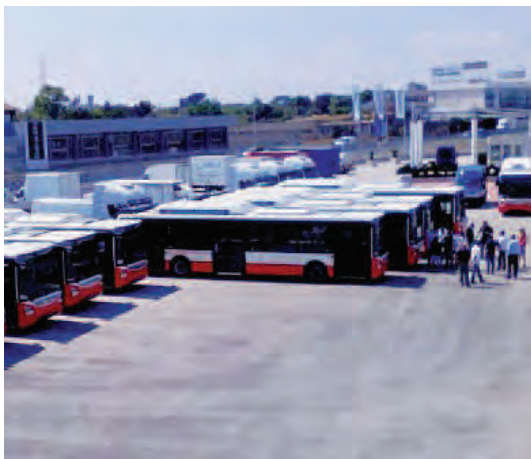
■ I nuovi dodici bus Amtab

Uno dei 12 nuovi mezzi Amtab si è fermato durante il percorso