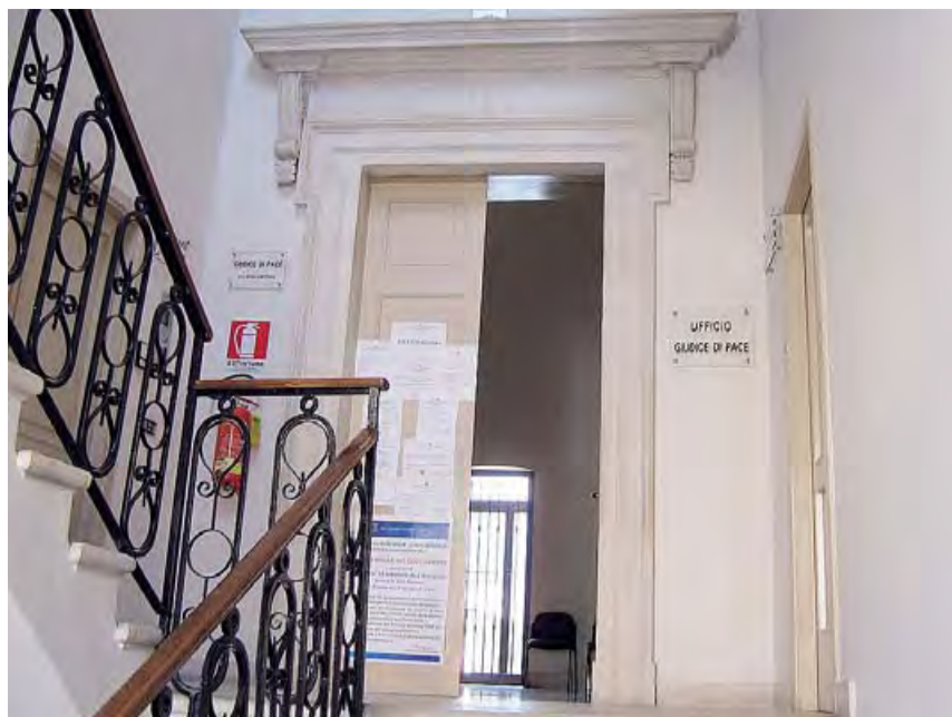
NUOVI DEBITI Si tratta di pagamenti di sentenze, emesse quasi tutte dal Giudice di Pace