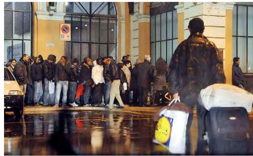
LA FILA PER MANGIARE I pasti per i poveri sono distribuiti e consumati all'aperto

In passato c'erano solo le suore di Madre Teresa di Calcutta che offrivano 30 posti letto». Oggi a Bari sono disponibili circa 200 posti letto. «Continuiamo a ripetere che sono insufficienti», dice il volontario. E prosegue: «Qualcuno dimentica che questa è una grande città metropolitana». Poi allarga il discorso. «Con l'abolizione della Provincia abbiamo perso un interlocutore importante; forse non si può materialmente governare insieme Bari e la Città metropolitana». Macina spiega: «Bari è meta di senza fissa dimora di tutta la provincia di Bari, nei paesi non ci sono i servizi che offre Bari e quindi finiscono per riversarsi tutti qui». Ricorda cosa accadde lo scorso anno. «La macchina dell'acqua nell'estate 2014 fu realizzata grazie alla Provincia,