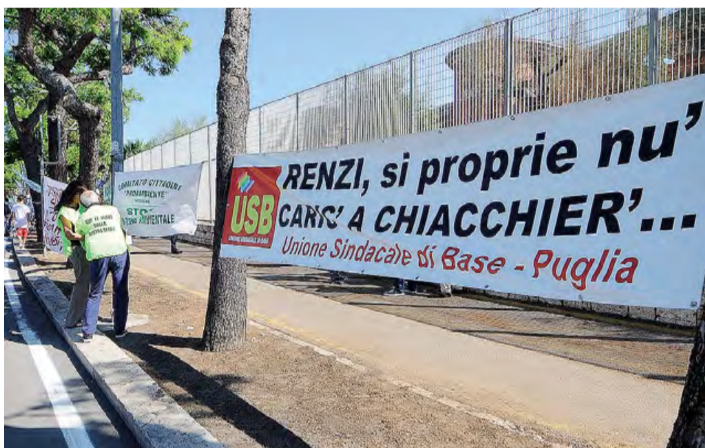
LA CONTESTAZIONE Uno degli striscioni ai cancelli della Fiera del Levante

E la sera i diseredati cenano sui cofani delle auto e sulle panchine. «Sos» dai volontari