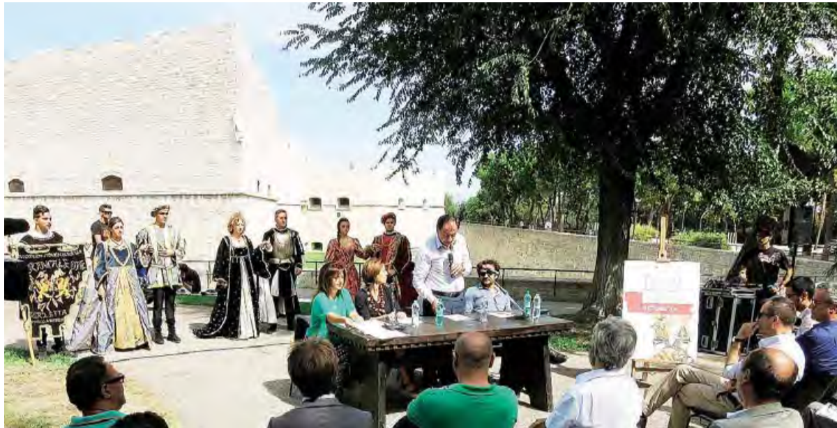
DISFIDA 2015 Severe critiche sono state rivolte dal segretario del Pd alla giunta comunale e agli organizzatori dell'evento

«In questi giorni in cui tanto si magnifica sugli eventi organizzati per la celebrazione della Disfida di Barletta, non si può tacere sulle discutibili procedure e modalità messe in atto dall'Amministrazione