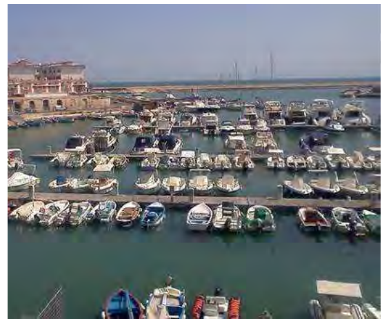
Il porto di Bisceglie

Sarà l’occasione per esporre l’intera attività del Circolo della Vela, ringraziare quanti hanno reso possibile lo svolgimento stesso dei corsi e la partecipazione a questo progetto e costituirà l’opportunità per rimandare l’appuntamento alla stagione invernale.