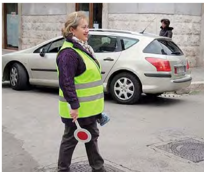
«NONNI VIGILI» Il Comune ha garantito l'attivazione del servizio

Ma il sindaco ha promesso un urgente intervento, almeno per quanto riguarda le «zebre». E non è escluso che gli interventi siano in già in arrivo.