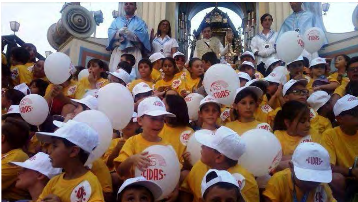
i bambini "griffati" Fidas sul Carro Trionfale

Grazie a un accordo con il Comitato Festa Patronale, i piccoli a bordo del Carro Trionfale durante la tradizionale sfilata della domenica quest'anno hanno indossato magliette e cappellini gialli griffati "Fidas"