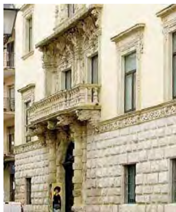
LA SEDE Palazzo della Marra