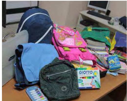
Materiale didattico © n.c.

Quest'anno si attendono risultati ben superiori alle precedenti edizioni in considerazione del fatto che nella passata edizione sono stati 53 gli Enti no profit coinvolti rispetto alle 64 associazioni che collaboreranno all'iniziativa nei 7 punti vendita Coop Estense di quest'anno.