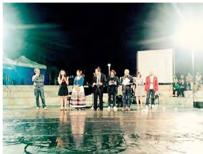
COMMozione Un momento della serata