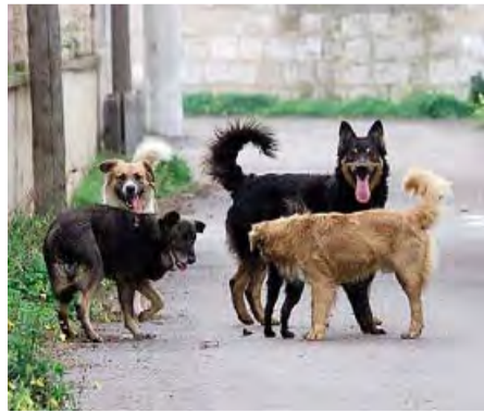
RANDAGI Servizio ricovero e gestione