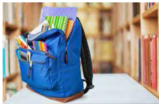
scuola © n. c.

Ai docenti, in particolar modo, esprimiamo il nostro ringraziamento per la passione e l'impegno che metteranno in campo in quest'anno scolastico.