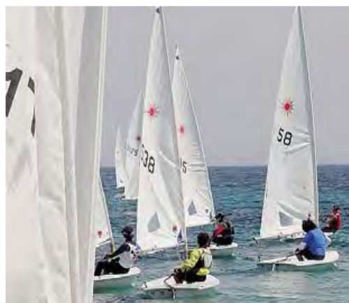
SPORT PER ECCELLENZA La vela

Alla manifestazione conclusiva saranno presenti tutti i partecipanti al progetto, i rappresentanti della Regione Puglia e il sindaco di Bisceglie, i presidenti dei partner del progetto (FIV, Bisceglie Approdi, Rotaract Club, Un mondo per tutti, Pegaso), i dirigenti scolastici dell'Istituto di Istruzione Superiore «avv. G. Dell'Olio», della scuola media «R. Monterisi» e dell'Istituto di Istruzione se-