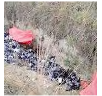
ALTAMURA I colombi morti

● ALTAMURA. La Lipu di Gravina e Altamura grida all'orrore per il ritrovamento nelle campagne altamurane di tre sacchi di immondizia con le carcasse di circa 100 colombi che sono morti dopo una violenta cattura.