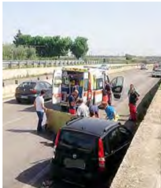
CORATO Il luogo dell'incidente

La notizia della morte del giovane barbiere si è sparsa presto in città. Non solo i clienti della sua bottega di via Crocifisso ma anche le persone che lo conoscevano meno lo hanno descritto come «un uomo allegro e sorridente». Lascia la moglie e tre figli.