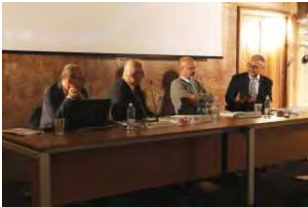
Il tavolo dei relatori

Sussidiarietà, democrazia e volontariato. Sono questi i concetti chiave attorno ai quali si è sviluppato l'incontro regionale, tenutosi nei giorni scorsi nella sala conferenze del Centro polifunzionale dell'Uniba sul tema: "La nostra storia: esperienze al servizio dei territori. I CSV della Puglia e le organizzazioni di volontariato si confrontano con le Istituzioni sulla Riforma del Terzo settore", organizzato dal Coordinamento dei Centri di servizio pugliesi (Csvnet Puglia), con il patrocinio dell'Università degli Studi di Bari.