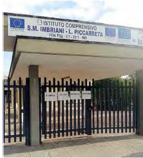
CORATO L'ingresso della scuola media «Imbriani» e, nella foto più grande, la recinzione che riduce il cortile della scuola di 2mila mq

Così gli operai hanno delimitato l'area privata montando una recinzione del tutto simile a quelle uti-