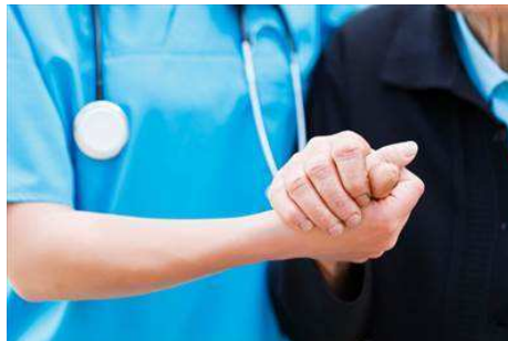
Alzheimer anziani assistenza

Si terrà a Molfetta (Fabbrica San Domenico) il 18 e 19 settembre, il corso di aggiornamento "Malattie Neurodegenerative: approccio integrato nel territorio". L'evento organizzato dall'associazione Alzheimer e Malattie Neurodegenerative Molfetta Onlus con il patrocinio del Comune di Molfetta, dell'Asm e con il contributo di Fb Health, Geofarma, .itfarm, Jeannot, Network Contacts, Lions Club Molfetta; rientra nel programma delle attività della XXII giornata Mondiale dell'Alzheimer.