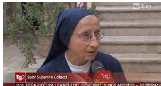
durante il servizio andato in onda su Rai Due

Un po' di storia per coloro che magari non conoscono la realtà in questione: