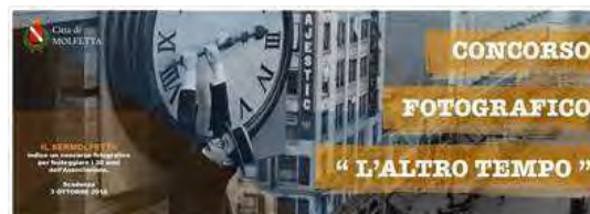
Concorso fotografico "L'altro tempo"

Il 2015 è per la Pubblica Assistenza Sermolfetta un anno importante, ricco di eventi per celebrarne i 30 anni di attività: fondata nel 1985 ha una storia ricca di esperienze ed eventi da raccontare, tappe di un percorso articolato che l'ha portata a divenire, a partire da quella associazione fondata da un gruppo di giovani “folli”, una tra le realtà di volontariato più grandi della regione Puglia.