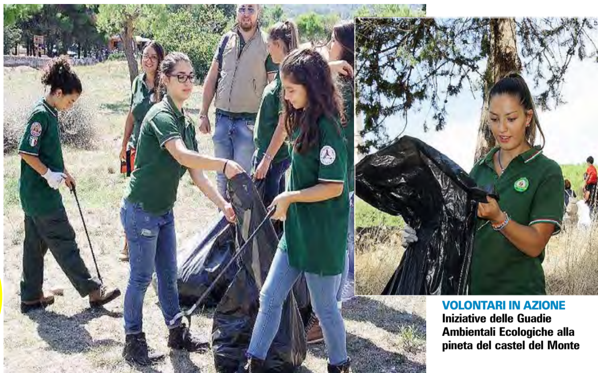
VOLONTARI IN AZIONE Iniziativa delle Guardie Ambientali Ecologiche alla pineta del castello del Monte

In tre ore riempiti oltre 16 sacchi di bottiglie, barattoli e rifiuti indifferenziati