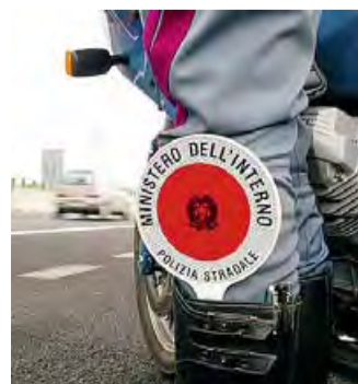
POLSTRADA Bloccati ricettatori

● Un autocarro cerca di seminare sulla statale 16 una pattuglia della polizia stradale. Nel cassonetto pezzi di ricambio per auto, compresi due blocchi motore di possibile provenienza furtiva. Denunciati il conducente e il suo collaboratore, due cittadini turchi con permesso di soggiorno. Hanno dichiarato di aver comprato il tutto da un anonimo demolitore napoletano. In costante aumento i furti d'auto.