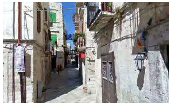
Via Piazza, nel centro storico

Al termine si brinderà tutti insieme ad un traguardo di grande rilevanza per le realtà associative sia in termini di presenza concreta sul territorio e sia in termini di assistenza alle persone che vivono la disabilità.