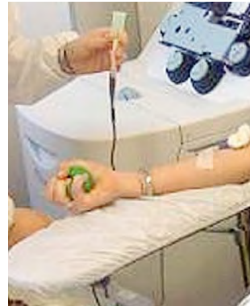
SANTERAMO La donazione del sangue è al centro della «Festa del volontariato» che si terrà da oggi a domenica 20 settembre

Ad aprire la lunga manifestazione, stasera due convegni che si terranno a Palazzo Marchesale. Il