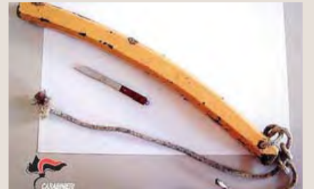
SANTERAMO Il bastone e il coltello

SANTERAMO / Due giovani Avevano bastone e coltello denunciati dai CC