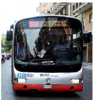
AMTAB Vittima degli scrocconi

● Il servizio di trasporto pubblico per la Campionaria preso d'assalto da «portoghesi» e scrocconi. Nel fine settimana la maggioranza dei viaggiatori ha ommesso di comprare il biglietto, arrecando non pochi danni alle casse dell'Amtab. Molti i furbi, ma anche tanta gente convinta che «durante la fiera i bus sono gratis». Già da ieri rafforzato il numero dei controllori.