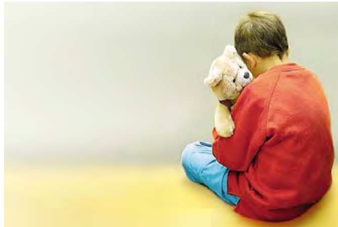
AUTISMO In Puglia le persone affette dalla sindrome sono circa 40mila

La decisione è stata presa con la delibera 1340 della Giunta Regionale Vendola, poco prima dell'insediamento della nuova Giunta Emiliano. E le famiglie sono sul piede di guerra per difendere i diritti dei loro figli. Che fine faranno i soldi che la Regione Puglia destinava agli interventi educativi ABA? E cosa farà la Regione in sostituzione di questo contributo per i nostri figli? Sono queste le domande con cui una delegazione di genitori