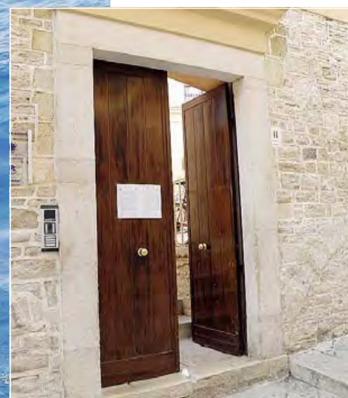
ACCOGLIENZA L'ingresso del centro «Santa Maria Goretti» di Andria