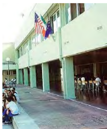
MONOPOLI L'esterno del Polo liceale e alcuni degli insegnanti madrelingua volontari d'inglese che sono impegnati anche nella parrocchia di San Francesco da Paola per un progetto benefico