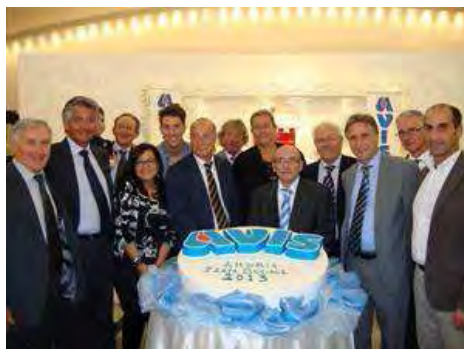
Ventennale di costituzione socie e simpatizzanti della sezione di Andria dell'AVIS

Un'occasione di crescita per l'Avis di Andria in termini di contatto con i giovani, di promozione della donazione e soprattutto un'occasione per divulgare questa pratica solidaristica nel tessuto sociale. A distanza di quasi dieci anni l'associazione sposa il progetto del servizio civile ovvero la opportunità messa a disposizione dei giovani dai 18 ai 28 anni di dedicare un anno della propria vita a favore di un impegno solidaristico inteso come impegno per il bene di tutti e di ciascuno e quindi come valore di coesione sociale.