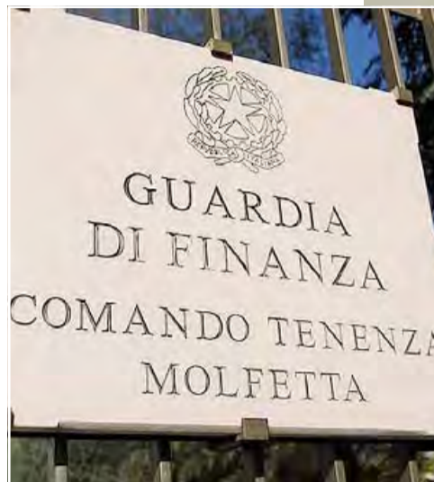
MOLFETTA La sede della tenenza della Guardia di Finanza. I militari hanno scovato una presunta evasione fiscale di 1,5 mln per omessa dichiarazione

Per il titolare dell'altro panificio è scattata «soltanto» la segnalazione all'Agenzia delle Entrate.