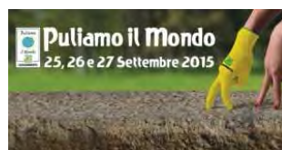
La locandina della manifestazione

Parte domani il grande week-end di pulizia di "Puliamo il Mondo 2015", la campagna di volontariato ambientale organizzata in Italia da Legambiente in collaborazione con la Rai e che da 23 anni coinvolge migliaia di volontari per ripulire dai rifiuti spazi urbani e aree verdi.