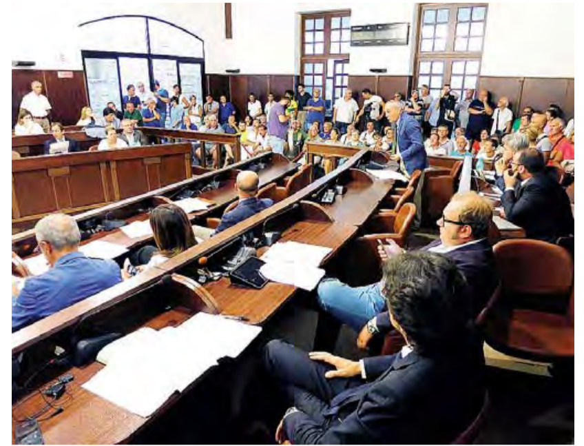
TRANI L'aula consiliare