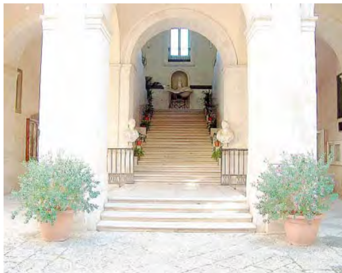
BITONTO L'atrio di Palazzo Gentile sede dell'amministrazione comunale

Per ognuno di loro, il regolamento approvato dal Consiglio comunale prevede una lunga lista di autorizzazioni e divieti. Tutti coloro che hanno già richiesto l'autorizzazione potranno ritirare i rispettivi contrassegni tutte le mattine, dal lunedì al venerdì, dalle ore 9 alle 12, al comando