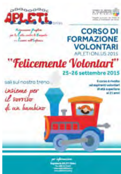
La locandina del corso

Venerdì 25 e sabato 26 settembre si terrà il corso di formazione per aspiranti volontari Apleti Onlus (il 25 settembre dalle 15 alle 20 e il 26 settembre dalle 9 alle 18). Il corso è rivolto a coloro, di età superiore ai 21 anni, che vogliono avvicinarsi e conoscere la realtà dell'oncoematologia pediatrica e ha il fine di inserire nuovi volontari nell'attività ludica ambulatoriale e nel sostegno alle attività di raccolta fondi e sensibilizzazione sul territorio.