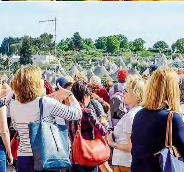
ALBEROBELLO Dall'inizio dell'anno sono transitati dallo lat 40mila turisti incantati dai trulli