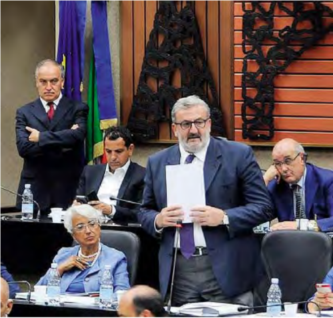
UNANIMITÀ Il governatore Michele Emiliano in Consiglio