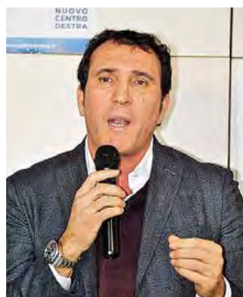
LAVORO Il sottosegretario Cassano

«In Italia ci sono oltre 30 mila scomparsi. Una serie infinita di drammi che continuano a riproporsi di anno in anno con sempre maggiore gravità» ha ricordato Cassano citando quanto sostenuto dall'associazione Penelope (che con 15 comitati territoriali costituiti in Italia, opera da Nord a Sud per sostenere chi vive il dramma della scomparsa di un proprio caro): «Quando le istituzioni preposte collaborano, i risultati arrivano».