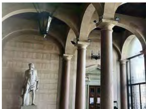
L'interno dell'ex Provincia di Bari

Soggetto di sesso maschile con età compresa tra i 18 e i 36 anni. È l'identikit del donatore ideale così come evidenziato dalle recenti statistiche sul successo dei trapianti di midollo osseo.