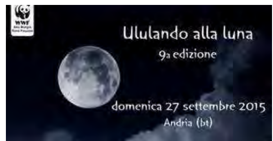
"Ululando alla luna" con i volontari del WWF

Nelle prime tre settimane di settembre, nei giorni martedì, mercoledì e giovedì, dalle ore 19.00 alle ore 22.00 circa, presso la sede di via Vespucci, 114, ad Andria, si raccoglieranno le adesioni, che si perfezioneranno con il versamento della quota che è solo un contributo spese, e la consegna di un invito che consentirà la partecipazione all'evento.