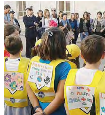
Una precedente edizione dell'evento

Oltre alla giornata dedicata a cittadini e associazioni, la manifestazione sarà realizzata anche nelle scuole. Ogni istituto della città si organizzerà autonomamente con un calendario itinerante e ripulirà parte del quartiere in cui si trova. L'iniziativa gode della collaborazione di Comune di Corato, Asipu, Ente Parco Alta Murgia e Movimento Rete Attiva. [giuseppe cantatore]