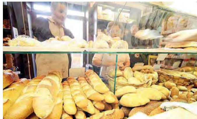
ASSOCIAZIONE ORIZZONTI Ecco la Maratona della solidarietà

dall'Associazione Orizzonti. Si tratta di un piccolo gesto d'amore e solidarietà verso il prossimo meno fortunato. Parte del ricavato, infatti, sarà utilizzato dall'Associazione Orizzonti per contribuire all'aiuto delle tante famiglie bisognose delle città della provincia. Il ticket, su prenotazione, avrà il costo di 40 euro per gli adulti e di 20 per i bambini. Per prenotazioni: info@associazioneorizzonti.org (lasciando gli estremi per un successivo contatto) oppure telefonare al 329 030 3560. Si rinnova,