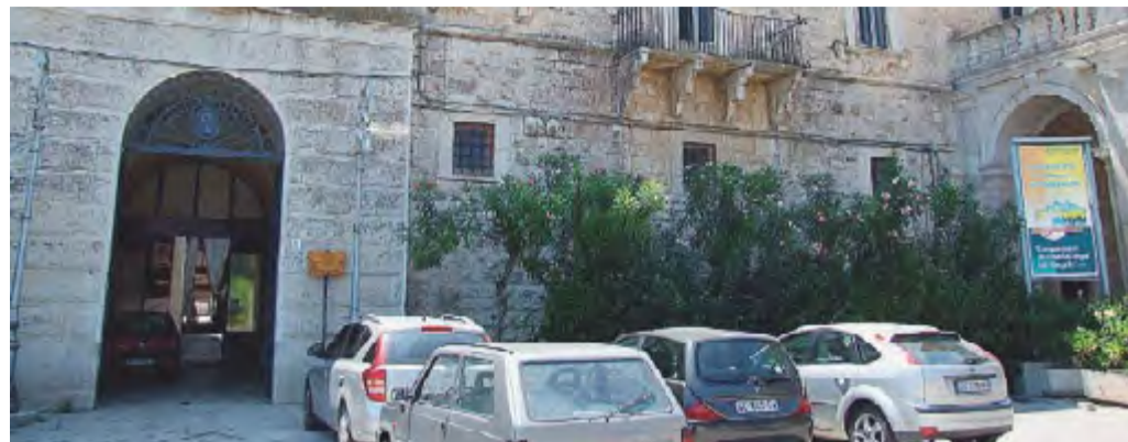
ANDRIA L'ingresso dell'Istituto agrario

«Sei 6 ambienti del plesso Ita andrebbero ristrutturati per allocarvi 3 aule e 3 laboratori, visto che le strumentazioni sono inutilizzabili»