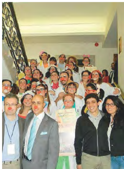
SORRISI Il gruppo andriese

Sarà inoltre disponibile uno stand informativo per coloro che vorranno conoscere meglio la storia e l'evoluzione de L'Albero del sorriso.