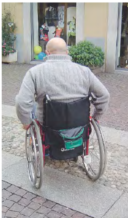
BARRIERE Nasce l'osservatorio comunale

I soggetti che intendono partecipare alla manifestazione d'interesse potranno prendere informazioni sul sito internet del Comune di Trani. Sarà interessante seguire poi l'iter dell'impegno e soprattutto la programmazione che verrà in questa importante materia, che spazia anche nei lavori pubblici oltre che nei servizi sociali.