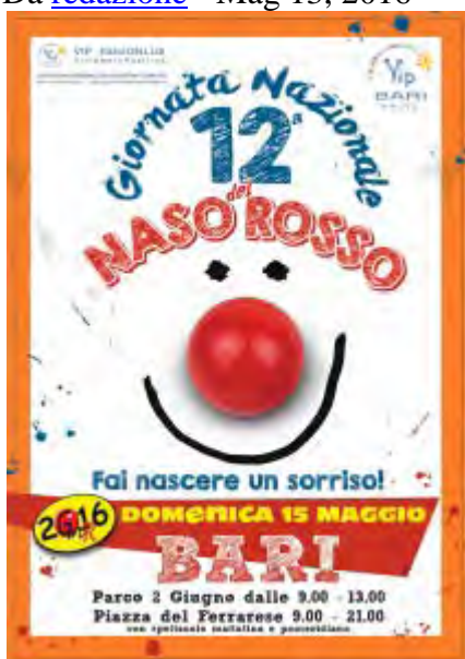
La locandina dell'iniziativa

Il 15 Maggio 2016 per la 12 o volta i clown Volontari delle Associazioni appartenenti alla Federazione VIP (ViviamoInPositivo) Italia Onlus, scenderanno in 55 piazze italiane per promuovere la Missione della Gioia con stand, spettacoli, intrattenimenti e per raccogliere fondi per i progetti della Federazione ViviamoInPositivo.