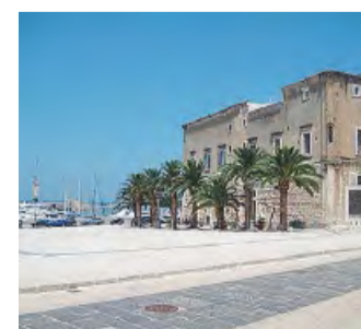
TOUR Piazza Quercia

Il tour si sviluppa in venti tappe, fino al 17 luglio. Venti piazze in cui fare l'aperitivo e divertirsi insieme, dalle 18 alle 22, grazie a musica e tante attività live. A Trani si esibiranno i Far fly trio, cover band di musica pop, le Orecchiette swing, con le loro proposte cover di swing italiano, e gli Electric company, cover band degli U2.