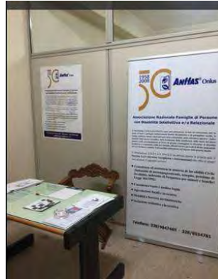
Sede Anffas