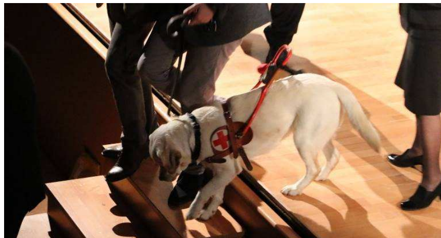
"Due occhi per chi non vede"

L'iniziativa, che si terrà presso il liceo scientifico e linguistico "Tedone" di Ruvo, è organizzata dalla sezione provinciale di Bari dell'Unione Italiana dei Ciechi e degli Ipovedenti, con la collaborazione della sezione di Corato-Ruvo