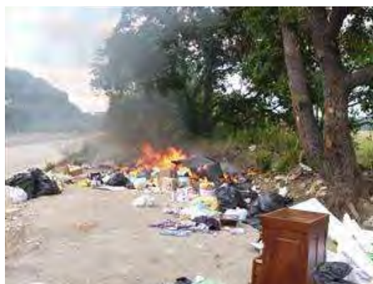
Una montagna di rifiuti in fiamme lungo la strada per Castel del Monte.

A bruciare erano i bidoni destinati ad accogliere i rifiuti dei frequentatori delle ville ubicate al di fuori del perimetro urbano, con l'aggravante che essi si trovavano ai piedi delle querce secolari.