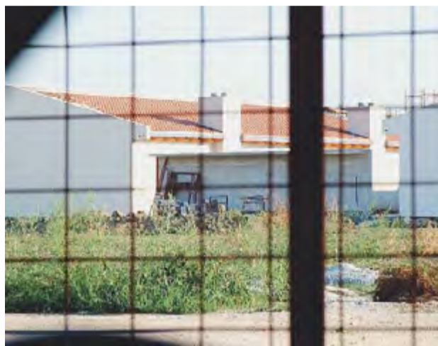
MONTALTINO Le villette finora realizzate

del nuovo borgo di Montaltino, nonché possessore di una licenza per la realizzazione di un agriturismo. Il consiglio comunale di Barletta approvò il progetto per il nuovo borgo di Montaltino la notte tra il 4 ed il 5 Agosto 2009. Ad ottobre seguì la convenzione e nel 2010 i permessi a costruire. Poi i processi amministrativi con la sentenza del Tar che nel 2011 annullò il "piano di lottizzazione dell'insediamento turistico-rurale". Pronuncia confermata a Febbraio 2013 dal Consiglio di Stato innanzi a cui avevano promosso appello il Comune e numerosi proprietari interessati al restyling del borgo.