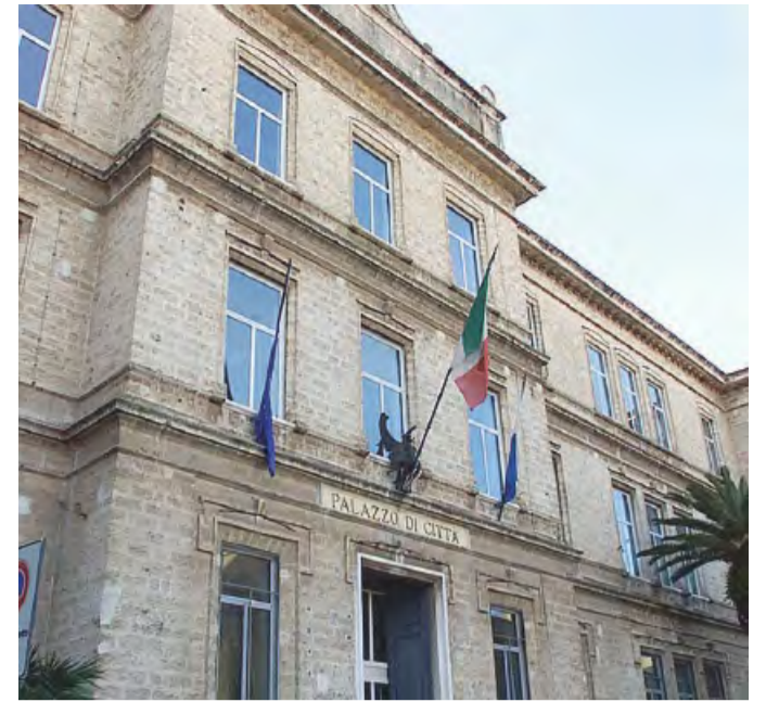
NODO BILANCIO A Palazzo di città

Infine la Tasi, che è il tributo sui servizi indivisibili destinato alla copertura dei costi degli stessi erogati dal comune, resta confermata al 2,5 per mille, con l'esenzione dell'abitazione principale e relative pertinenze delle unità immobiliari assimilate all'abitazione principale. Si applica invece lo stesso 2,5 per mille per fabbricati costruiti e destinati dall'impresa costruttrice alla vendita, ma che non siano in tuttora locati. Aliquota dell'1 per mille per fabbricati rurali ad uso strumentale, quattro le categorie di esenzione individuate.