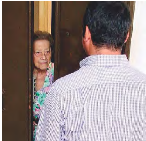
MONOPOLI Tentativi di truffa agli anziani

MONOPOLI TRE CASI IN CITTÀ, UNO NEL CAPOLUOGO, DENUNCIATI AI CARABINIERI, CHE RICORDANO LE REGOLE D'ORO