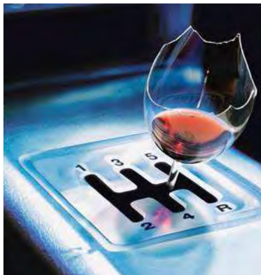
Reati da abuso di sostanze alcoliche e stupefacenti © n.c.

Ai fini dell'assolvimento degli obblighi di formazione continua, l'evento è altresì accreditato presso il Consiglio dell'Ordine degli Avvocati di Trani.