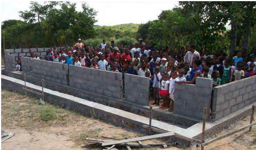
Coraton finanzia la costruzione di una scuola in Madagascar

La maratona di beneficenza firmata "La Banda" ha devoluto parte del ricavato della serata realizzata quest'anno a teatro all'associazione Pro Madagascar che ha sede nella parrocchia San Gerardo