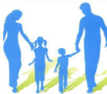
Una Famiglia

Da parte nostra continueremo a vegliare contro gli attacchi alla dignità di ogni essere umano e della famiglia. Staremo vicini a quanti non vogliono arrendersi alla deriva umana e antropologica in atto e con loro (cattolici e non cattolici, credenti e non credenti) continueremo ad impegnarci per una società che sappia dare speranza alla famiglia e ai cittadini frastornati e delusi».