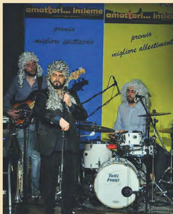
GRAVINA La serata finale al teatro Vida