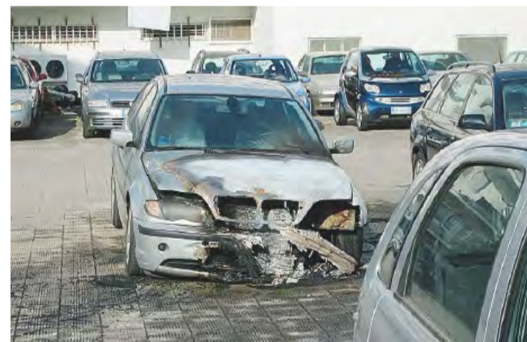
PUTIGNANO Ecco com'è ridotta la Bmw incendiata

Le cause dell'incendio sono ancora tutte da chiarire ma, dalle prime indiscrezioni trapelate, sembrerebbe quasi certa l'origine dolosa. Pare infatti che le registrazioni delle telecamere attive nella concessionaria mostrino chiaramente un individuo che scavalca la cancellata del piazzale e appicca il fuoco alla ruota anteriore della Bmw. I Carabinieri della stazione cittadina, sopraggiunti sul posto, hanno avviato un'indagine per approfondire le circostanze. Se l'ipotesi dolosa dovesse essere confermata, le indagini punteranno ad accertare se l'autore intendesse distruggere solo quell'auto o tutto il «parco».