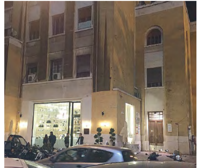
NOTTURNO Il nuovo ingresso del caffè Jérôme, a San Ferdinando