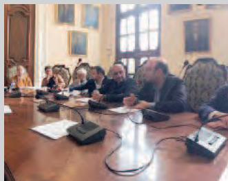
■ La presentazione del progetto