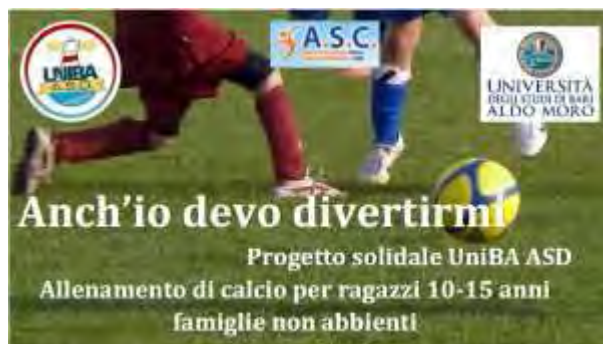
Il progetto Uniba Usd

Sport gratis per i bambini baresi, al di là delle differenze religiose. E' quanto garantirà il progetto "Anch'io devo divertirmi", promosso dall'UniBa ASD (associazione sportiva dilettantistica universitaria) e presentato nell'aula del Senato dell'Università degli Studi "A. Moro".