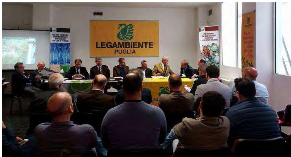
Un Parco Pulito 365 giorni l'anno

Il progetto, promosso e finanziato dal Parco nazionale dell'Alta Murgia e coordinato da Legambiente Puglia, vede il coinvolgimento di amministrazioni locali, aziende e associazioni. Presentata anche l'app "Murgia pulita"