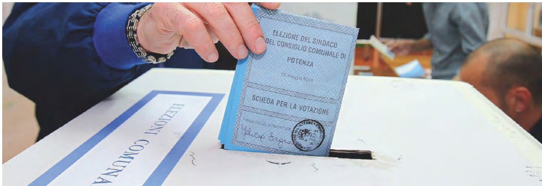
5 GIUGNO Si vota per le Comunali a Minervino Murge e Spinazzola

VERSO LE ELEZIONI COMUNALI SI VOTERÀ DOMENICA 5 GIUGNO, IN UN UNICO TURNO, NEI DUE PAESI MURGIANI DELLA SESTA PROVINCIA