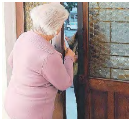
SANTERAMO Si parla di truffe ad anziani

La onlus «Sentieri della legalità» spiega come si può evitare di essere raggirati