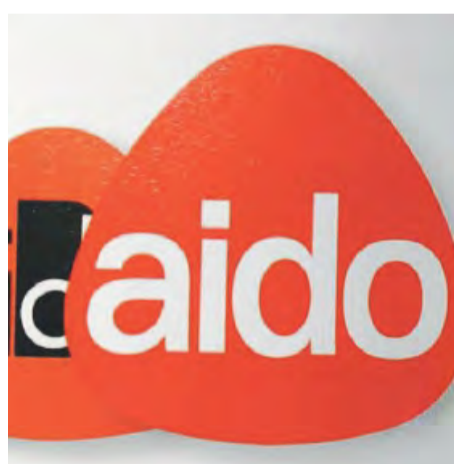
AIDO Associazione donatori organi

Permangono obiettivi prioritari del Consiglio, unitamente al progetto della maggiore diffusione dei gruppi comunali nella provincia attualmente operativi ad Andria, a Barletta, a Bisceglie, a Canosa e a Trani: informare e sensibilizzare la comunità sulle tematiche della donazione e del trapianto di