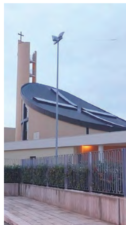
ALTAMURA La parrocchia Redentore

■ Esperti di rilievo nazionale saranno presenti domani ad Altamura per un seminario tecnico-scientifico ed educativo sulla dislessia, alla Masseria «La Meridiana» (contrada Cascettaro). Inizio alle 15.