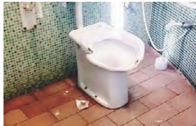
ATTO VANDALICO Distrutto il water del bagno femminile e per disabili di piazza della Repubblica

Le ore in cui il servizio è completo sono ancora troppo poche. Il sindaco, aveva garantito un potenziamento del monte ore