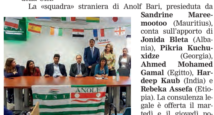
ANOLF I vertici e gli operatori

● Una sede più accogliente e funzionale e soprattutto una squadra di operatori volontari rafforzata per poter facilitare accoglienza, assistenza, ma soprattutto accesso e tutela nel mondo del lavoro attraverso un dialogo continuo con le associazioni del territorio. L'Anolf Bari (Associazione Nazionale Oltre Le Frontiere di emanazione della Cisl) di via Carulli 62 ha presentato ieri progetti e interventi nella tutela e nell'orientamento per i nuovi cittadini e per gli stranieri che si rivolgono a tutte le strutture di categoria della Cisl.