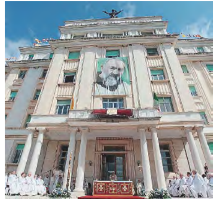
SAN GIOVANNI ROTONDO La messa davanti all'ospedale

La struttura si fregia di essere una eccellenza della sanità meridionale con quasi mille posti letto e 30 reparti