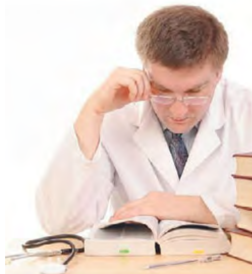
TIMORE Un medico alle prese con il Codice

denziale e problematiche operative ad essa connesse» (Dr. F. Messina), alle 11.15 «Il perimetro della responsabilità del medico, tra linee guida, buone pratiche, colpa lieve e colpa grave» (Prof. A. Dell'Erba); ore 12.15 Dieci punti da valutare prima di assicurare la RC medica (Dr. Cocca); alle 12.30 Venti di riforma: il ddl Gelli (Avvocato Santoro) e il dottor B. Delvecchio. Interverrà anche il dottor Vito Mascolo, chirurgo ortopedico. Alle 12.45, dibattito e conclusioni finali.