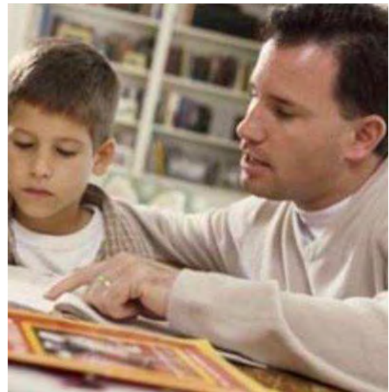
Genitori e scuola

Tale progetto di promozione della lettura ad alta voce ai bambini nasce dall'alleanza tra pediatri e bibliotecari che l'associazione sostiene da diversi anni. Ai genitori verranno offerti suggerimenti per leggere ad alta voce ai loro figli, gesto piacevole che crea abitudine all'ascolto, aumenta i tempi di attenzione, accresce il desiderio di imparare a leggere».