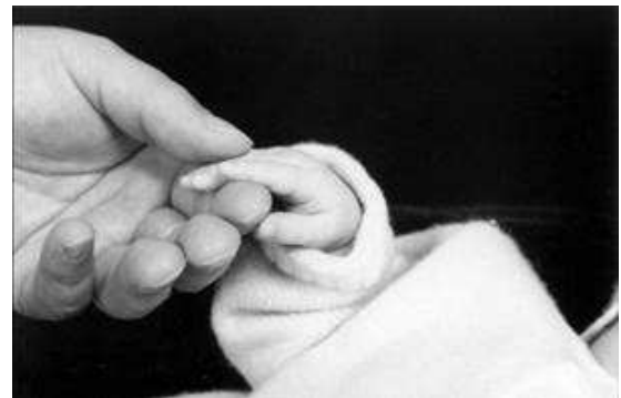
Festa della Mamma

La cittadinanza è invitata a partecipare.