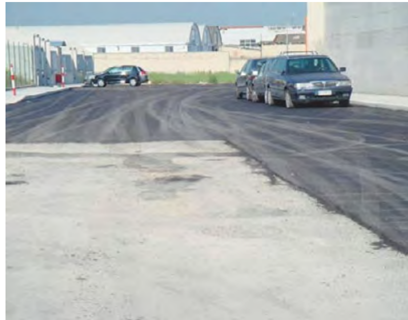
IL MISTERO Via dei Muratori la strada che non ha pace e una «identità certa»