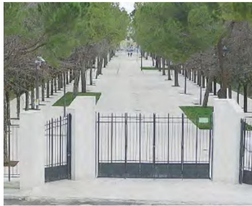
VOLONTARIATO Nel viale della villa le associazioni

Oggi si celebra l'Happening del volontariato