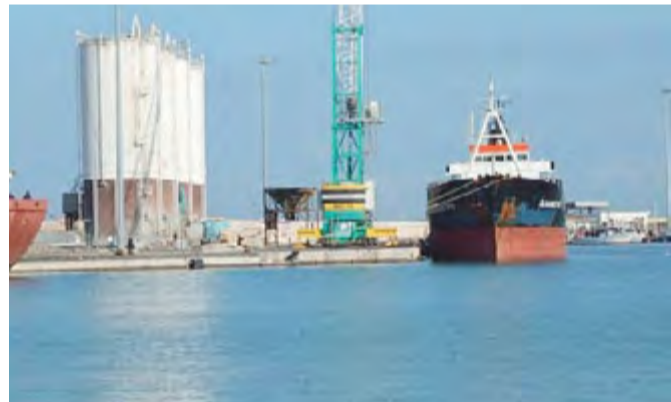
ECONOMIA Il porto di Barletta

E poi: «Decisivo sarà ora il rilascio della validazione dell'opera da parte del Provveditorato delle Opere Pubbliche che si esprimerà dopo aver preso visione della relazione contenente tutti i pareri rilasciata dall'Autorità Portuale del Levante. Il rilascio della validazione dell'opera consentirà all'Autorità Portuale del Levante di pubblicare il bando di gara a conclusione del complesso iter au-