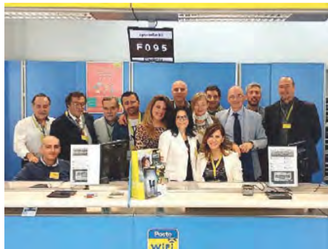
IL RICONOSCIMENTO Il personale dell'ufficio postale «Trani centro»