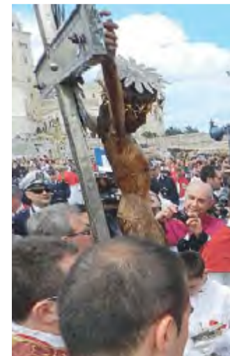
TRA I FEDELI Il Crocifisso

Infine, alle 20.30, vi sarà adorazione della Croce animata dalla pastorale giovanile cittadina.