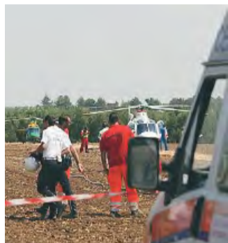
Sul luogo della strage