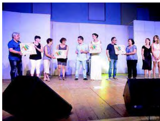
L'edizione 2015 de Il Giullare