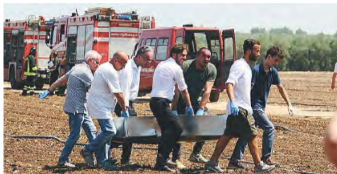
I soccorritori in azione

SPORT E SOLIDARIETÀ MESSAGGI DI PENNETTA, VINCI, INGLESE, GRECO E DELL'EX CT CONTE