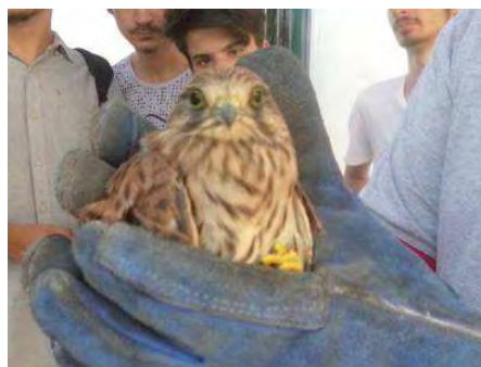
Falco grillaio

Il piccolo volatile, subito rifocillato, presentava una ferita all'artiglio ed lussazione all'ala destra. Immediatamente è stato portato e consegnato al personale del Comando della Polizia Municipale, che provvederà a recapitarlo al centro recupero della fauna protetta di Bitritto (Ba) per le cure specifiche.