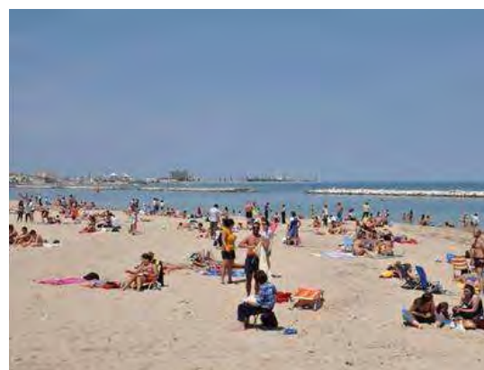
La spiaggia di Pane e pomodoro

Il servizio, che riguarda l'intera regione, è il risultato della cooperazione tra le Associazioni Rangers d'Italia sezione Puglia, il Coordinamento regionale delle Guardie di FareAmbiente e il Gruppo Ripalta area protetta (Gruppo Rap), federato alla Federazione nazionale Pro Natura.