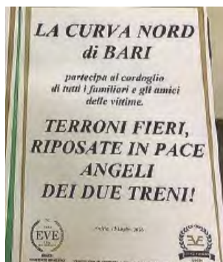
MANIFESTO I tifosi del Bari