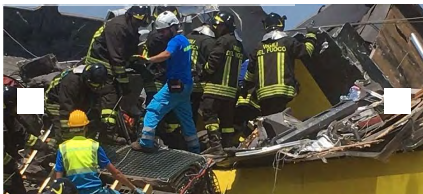
Incidente ferroviario del 12/7/2016