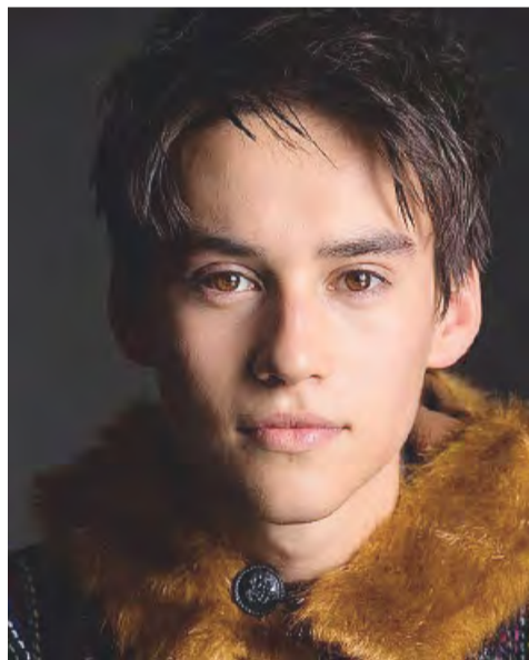
GENIALITÀ L'americano Jacob Collier. Sopra, Sergio Rubini

Il geniale 22enne Jacob Collier inaugurerà - a ingresso libero - in piazza Moro a Locorotondo (BA), con uno spettacolo solista caratterizzato da alta innovazione tecnologica ed immenso talento musicale individuale.