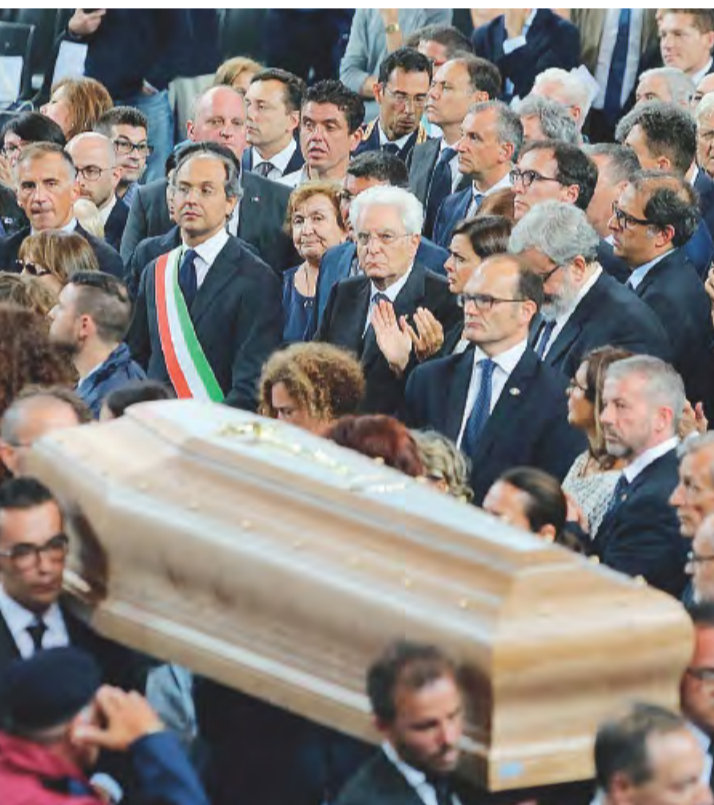
La disperazione di alcuni parenti delle vittime prima del rito del commiato che ha concluso i funerali celebrati da mons. Mansi