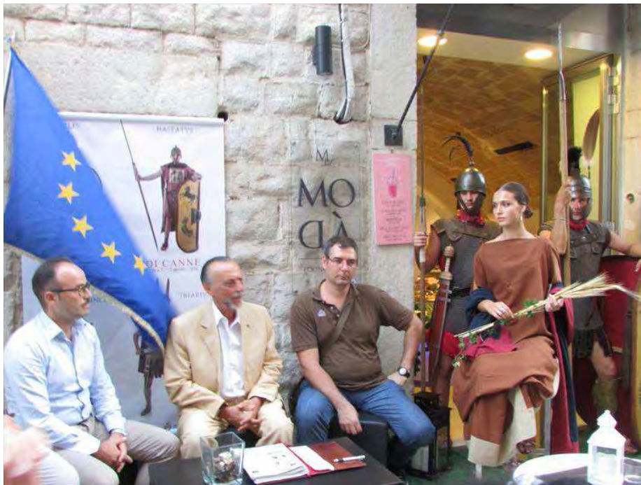
Presentazione eventi per la Battaglia di Canne

Il Comitato Italiano Pro Canne della Battaglia intende mettere in evidenza l'importanza storica che tale avvenimento, datato 216 a.C., ha per il nostro territorio