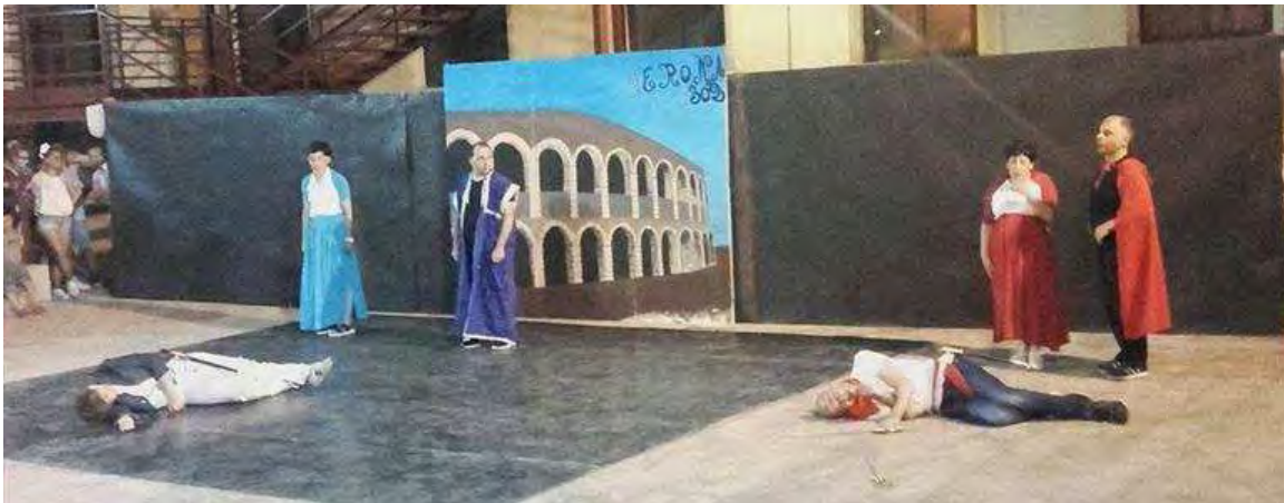
Romeo e Giulietta, lo spettacolo dei ragazzi dell'ass. Neverland © AndriaLive

Questa sera, il musical interpretato dai ragazzi diversamente abili dell'ass. di volontariato andriese approda all'Altro Villaggio a Castel del Monte