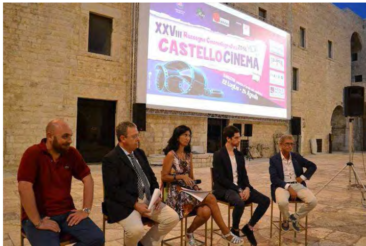
Castello Cinema, "Disabilità e famiglia"