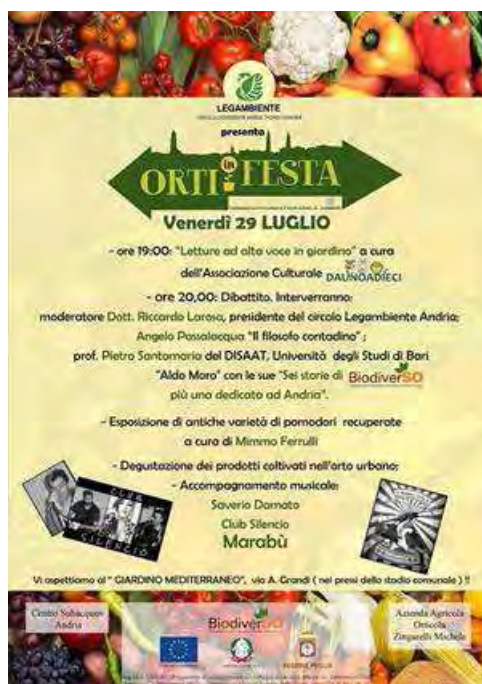
"Orti in festa", #coltiviamolacittà con i volontari di Legambiente