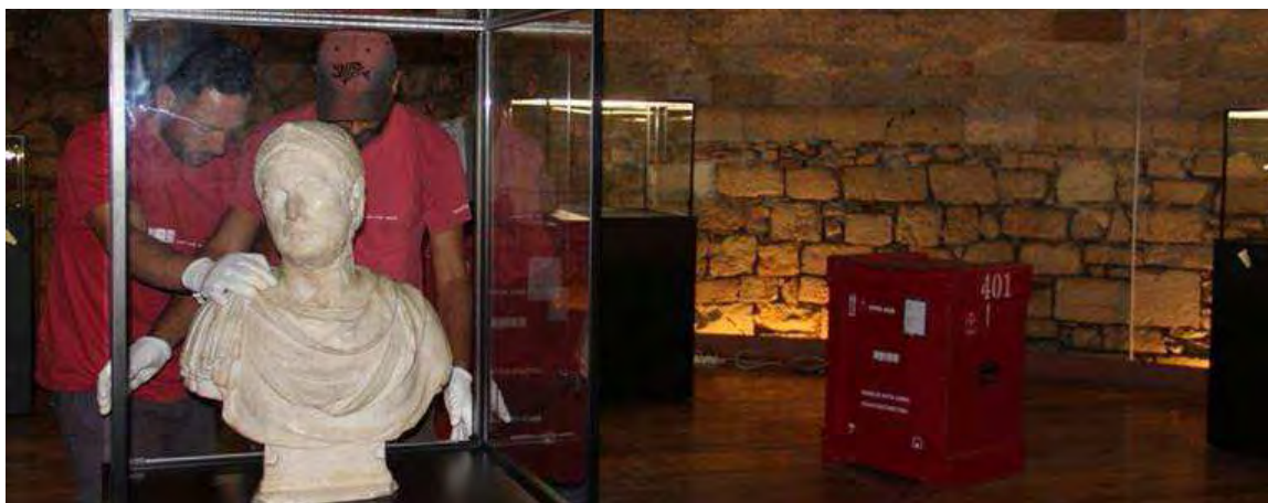
Il busto di Annibale

E' stato ripristinato il sistema di servo scala per disabili che consente direttamente l'accesso ai sotterranei dal fossato