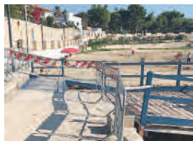
FUORI SERVIZIO Disabili «condannati»