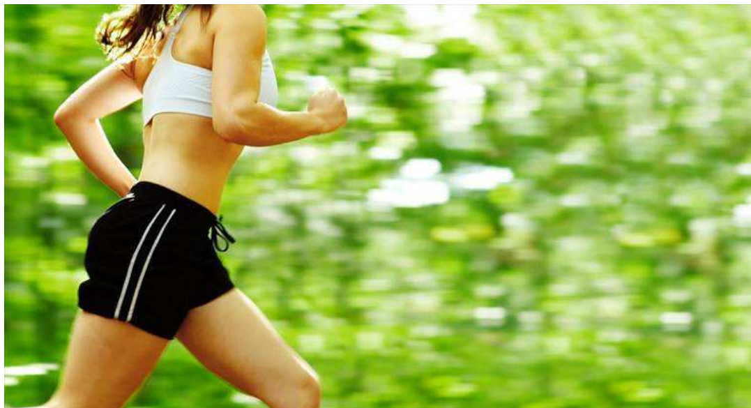
Una ragazza che corre

L'appuntamento con gli organizzatori è fissato alle 18 all'Executive center