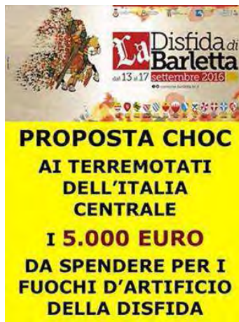
Locandina per la donazione

Sicuramente, con un piccolo ma grandissimo sforzo di intelligenza e di solidarietà, Barletta annullerà un inutile sfoggio di megalomania da spettacolo (ricordiamo che tutto il baraccone della Disfida 2016 costerà lo spunto di appena 50.000 euro, e vedremo il risultato finale...) ma darà una concreta mano di aiuto a quegli altri Italiani che, ricordandosi della Disfida come atto di orgoglio per l'unità nazionale, si sentiranno più uniti a noi. E noi Barlettani (quelli veri, quelli con la B maiuscola) a loro. Noi vigileremo. Ah sì. Statene certi... Ed è una vera "minaccia", altro che!