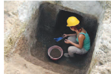
STUDIO E RICERCA Alcuni momenti dello studio sul campo