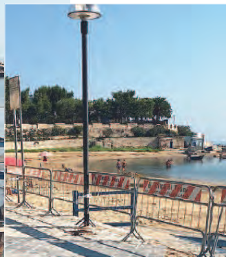
BAIA DEL PESCATORE La pedana di accesso per i diversamente abili alla spiaggia è completamente inutilizzabile