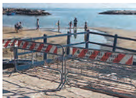
LA PEDANA L'inagibilità