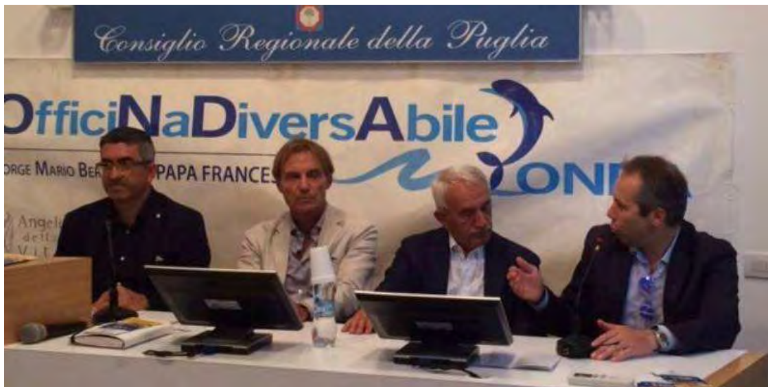
Angeli della Vita in Fiera per presentare il report del progetto Onda

L'obiettivo è inserire i ragazzi diversabili in un contesto sociale insegnando loro un mestiere