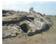
CULTURA Ecco la storia

È stata presentata la terza edizione del Campo Scuola di Archeologia, presso la necropoli arcaica di Pietra Caduta (IV sec. a.C., circa). Questa iniziativa didattica ed archeologica è organizzata dalla Fondazione Archeologica Canosina Onlus e dal Ministero dei Beni e delle Attività Culturali e del Turismo, con la collaborazione della Dromos.it Soc. Coop. ed il patrocinio del