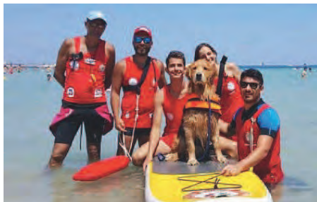
I VOLONTARI I bagnini con un «collega» a quattro zampe