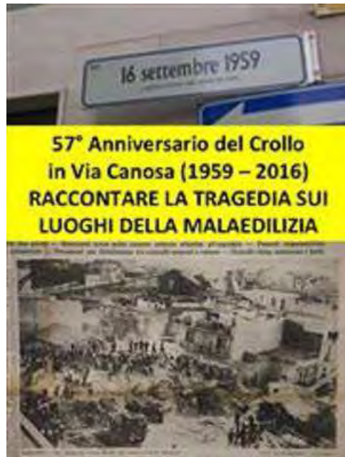
Locandina 57° anniversario crollo via Canosa © Comitato pro Canne Battaglia

Funzione religiosa di suffragio nel Santuario dell'Immacolata Concezione (Chiesa dei Monaci) in via Milano