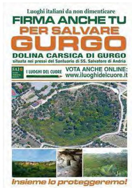
Salviamo il Gurgo, basta un click!

Maggiori informazioni sulla pagina Facebook creata per l'evento a questo indirizzo.