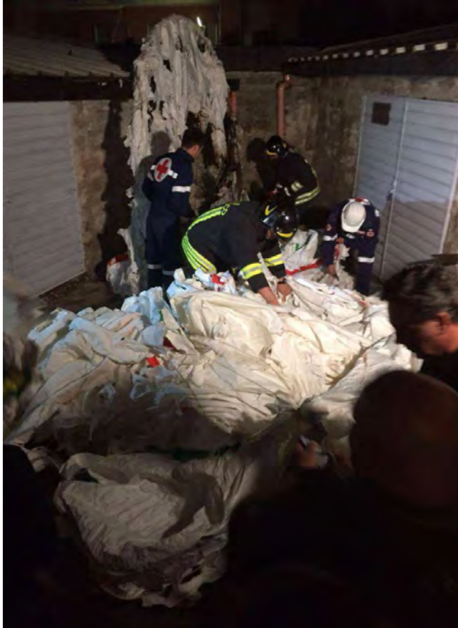
Il Pallone

Il Pallone si è staccato dal suolo alle 22,09 ed è "caduto" alle 22,30 in via Giuseppe Milano, nel cortile di un'abitazione, senza causare gravi danni