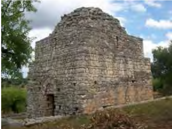
Il tempietto di San Bartolomeo a Castellana

C'è tempo sino al 30 settembre 2016 per partecipare alla settima edizione del Concorso Fotografico "Passeggiando tra i Paesaggi Geologici della Puglia" a cura dell'Ordine dei Geologi della Puglia e della Sigea – Società Italiana di Geologia Ambientale – Sezione Puglia, con il patrocinio della Regione Puglia.