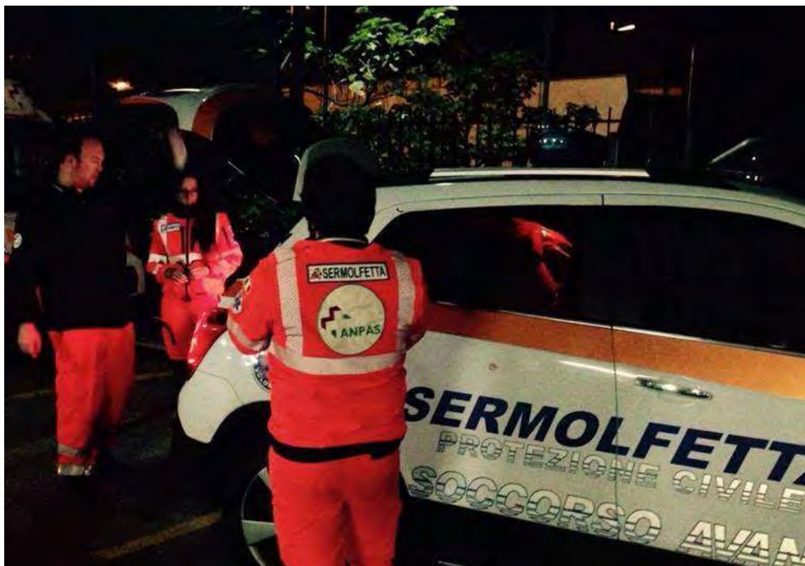
Sermolfetta in partenza per Macerata

Una delegazione dell'associazione è partita ieri sera alla volta del centro fiere Villa Potenza di Macerata