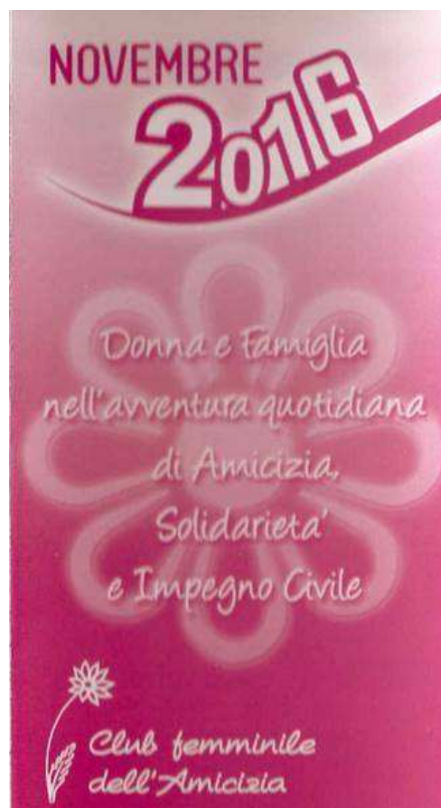
Il Novembre del Club Femminile dell'Amicizia

Per informazioni contattare i numeri: 3343311423 – 0803021615 – 3342754424.