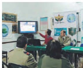
L'INCONTRO La sede barese dei Rangers

Le segnalazioni non hanno riguardato, però, solo il demanio marittimo, ma anche rifiuti ed igiene urbana, abbandono abusivo dei rifiuti,