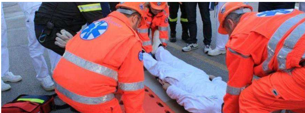
Corso Formativo per Soccorritori

2° Corso di Formazione per Soccorritori addetti ai mezzi di trasporto e soccorso di feriti e infermi del Servizio di Emergenza ed Urgenza Sanitaria