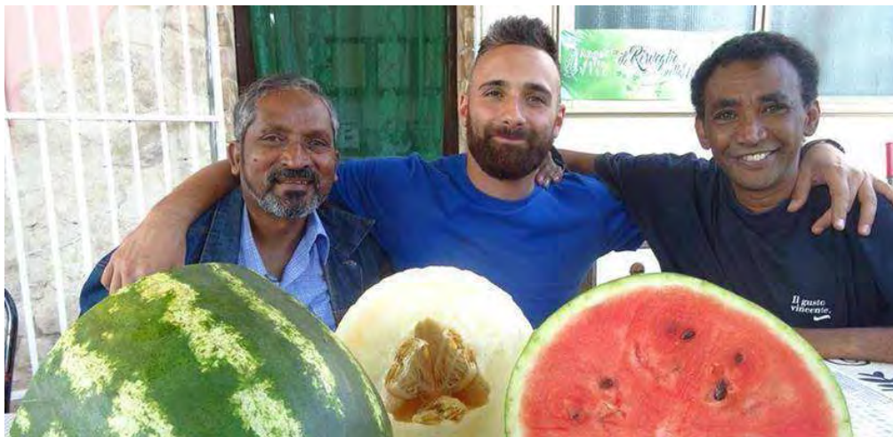
Verde Bianco Rosso, immigrati volontari

L'iniziativa di inclusione sociale a favore dei migranti voluta da Angeli della Vita