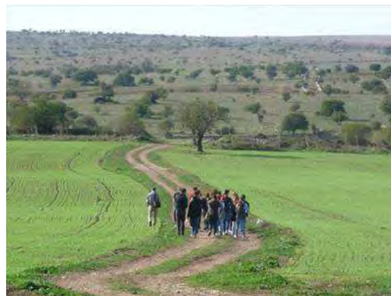
Il Parco nazionale dell'Alta Murgia

L'associazione ha adottato 33 chilometri di sentiero attrezzandoli con segnaletica minima orizzontale e propone per domenica 6 novembre (Murgia Fiscale percorso AGR 09 AM – 13 km) un'attività aperta al pubblico in un territorio che comprende antichi tratturi in agro di Bitonto, Altamura, Toritto, jazzi, vecchie cisterne e la grotta di Curto li Rizzi.