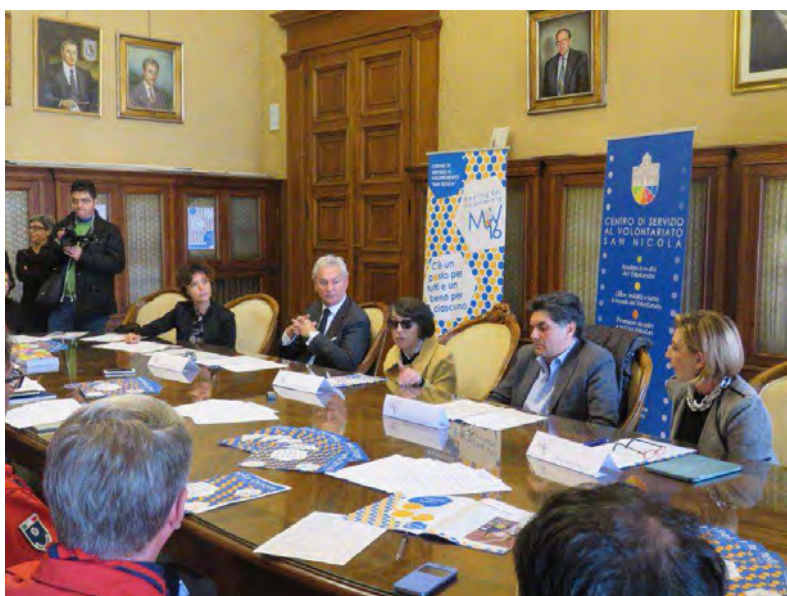
Luogo Bari - sala Giunta Comune di Bari

“C’è un posto per tutti e un bene per ciascuno” è il titolo della IX edizione del Meeting del volontariato che si svolgerà sabato 3 e domenica 4 dicembre alla Fiera del Levante di Bari, nel Padiglione 9 e nell’Impact Hub.