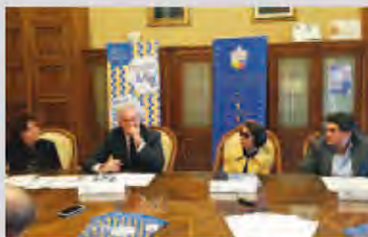
■ La conferenza stampa di presentazione

Il programma e tutte le informazioni sulla manifestazione sono disponibili su www.meetingdelvolontariato.com