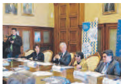
LA PRESENTAZIONE Al Comune