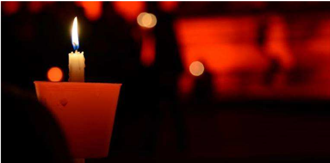
La fiaccolata per le "matri dilaniate"

Un corteo per sostenere le mamme delle vittime dell'incidente ferroviario del luglio scorso