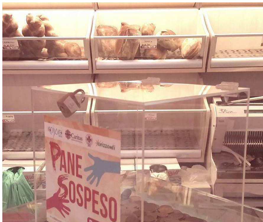
Pane sospeso

I volontari saranno presenti negli esercizi commerciali aderenti e informeranno dell'iniziativa i clienti e tutti coloro che vorranno conoscerne meglio le modalità