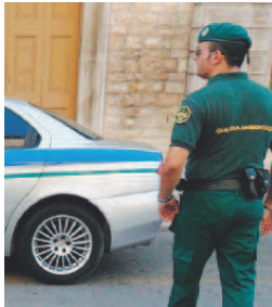
CONTROLLI Le guardie ambientali

"È un'azione - si motiva nella relativa delibera approvata dalla giunta municipale - finalizzata a rendere più efficiente la salvaguardia dell'ambiente e la diffusione della cultura della sostenibilità per favorire quei cambiamenti dei comportamenti che contribuiscono ad innalzare la qualità della vita dei cittadini". Buoni propositi. Ma ciò che conta alla fine sono i risultati. Peraltro l'agro di Bisceglie è molto esteso e quindi per raggiungere un livello di efficacia del servizio suddetto vi è la necessità di un impiego maggiore di uomini e mezzi, così come di un investimento più elevato. Con tali prospettive si sarebbe potuto valorizzare o affiancare le guardie campestri del locale consorzio autonomo con cui l'analoga convenzione negli anni è stata progressivamente ridotta nonostante i risultati raggiunti. Tuttavia la nuova iniziativa va a supportare l'attività di controllo che spetta alla polizia municipale e che risente della cronica carenza di personale. Infatti si è preso atto che con l'avvio del sistema di raccolta dei rifiuti "porta a porta" su tutto il territorio comunale in molte aree della città, sia in ambito urbano che soprattutto extra urbano si registra l'abbandono abusivo di rifiuti di ogni genere sul suolo pubblico e in aree private oltre all'inosservanza delle varie ordinanze emesse dal sindaco e