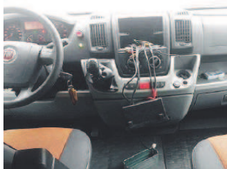
MOLA Il taxi sociale «alleggerito»

Il taxi sociale è il servizio gratuito che i volontari svolgono per trasportare disabili anziani non autosufficienti di Mola. Il servizio funziona «a chiamata». L'utente può essere prelevato dalla sua abitazione e accompagnato per esempio al suo medico, all'ufficio postale per ritirare la pensione, in chiesa.