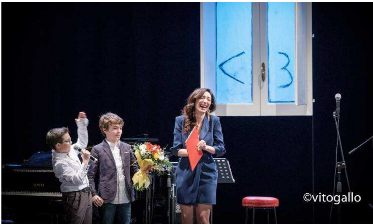
Coraton, uno spettacolo fatto col cuore

Sabato sera il teatro comunale ha accolto la 13esima edizione della manifestazione che da anni convoca gli artisti per una "staffetta" all'insegna della beneficenza, verso "la città ideale"