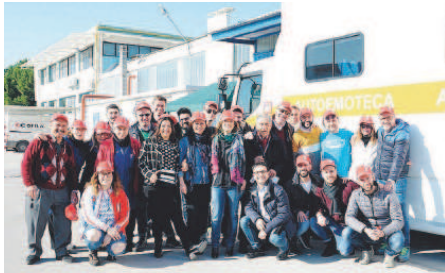
IMPEGNO E BONTÀ La foto di gruppo dei donatori e dei volontari