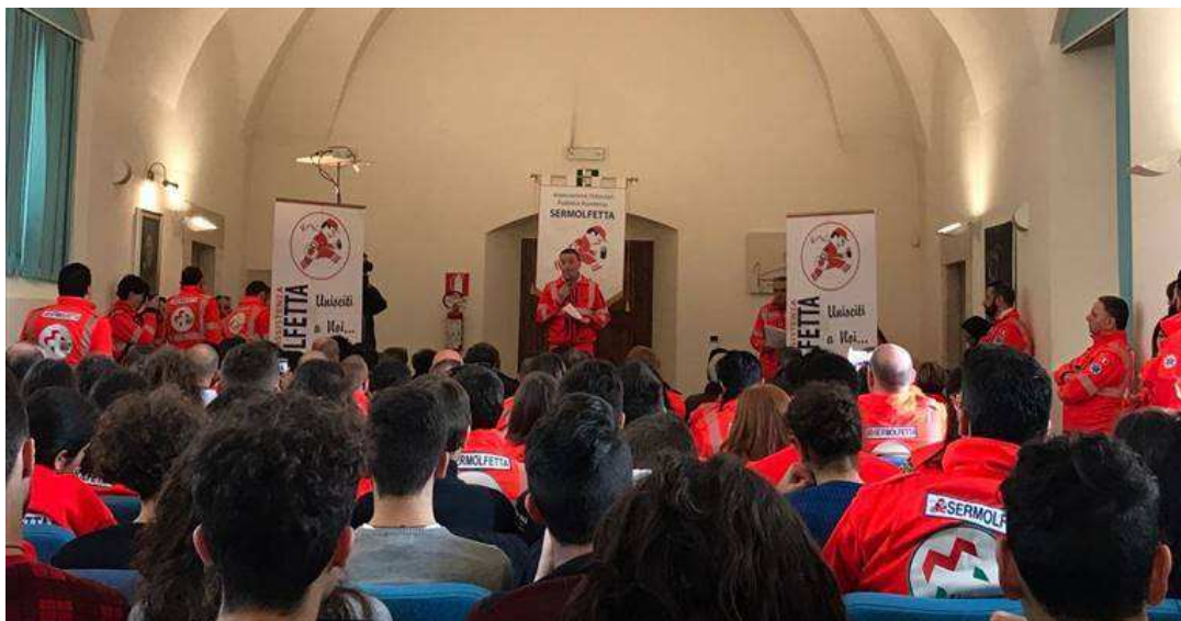
I ragazzi del SerMolfetta

Ieri la donazione pubblica al sindaco di Bolognola, città colpita dal sisma