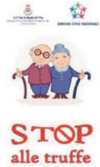
ONESTÀ Evento da non perdere

● BARLETTA. Il progetto di Servizio Civile Nazionale "Carosello 2015" attualmente attivo presso il settore Servizi Sociali del Comune di Barletta, ha organizzato una serie di incontri con lo scopo di informare e sensibilizzare la cittadinanza su quelle che sono le truffe più frequenti ai danni degli anziani. La tranquillità e la serenità delle famiglie, talvolta, è messa a repentaglio da malfattori che approfittano della buona fede delle persone, il più delle volte anziani. È dovere dei familiari non lasciarli soli e ricordare loro che è sempre importante chiedere aiuto e segnalare alle Forze dell'Ordine ogni circostanza sospetta. I volontari hanno, quindi, organizzato una serie di incontri informativi dal titolo: "Stop alle truffe", in partenariato con Associazioni e Parrocchie presenti sul territorio, in modo da poter raggiungere e coinvolgere un gran numero di famiglie e anziani interessati. Il prossimo è fissato il prossimo 13 marzo alle 19.30 - Parrocchia Spirito Santo, via G. Boggiano n.43.