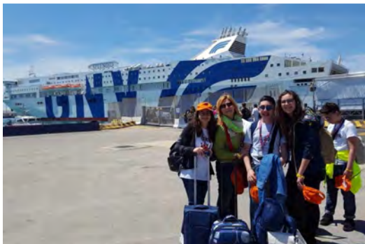
Nave della Legalità

Gli alunni dell'Istituto Santomasi di Gravina vincitori del concorso Falcone