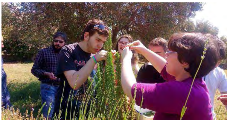
Ragazzi diversabili a Villa Framarino

Nel pieno rispetto dei diritti delle persone con disabilità e con la particolare attenzione, la sensibilità e l'ascolto che il percorso richiede da parte delle comunità, il programma si basa sui principi di inclusione e autonomia, di tutela dei diritti, di partecipazione attiva alla vita politica e sociale, richiamati nella Convenzione Onu dei Diritti delle persone con disabilità, ratificata dall'Italia con la legge 18/2009 e dalla Regione Puglia con decreto di giunta regionale 899/2009. In particolare si riaffermano i principi di accoglienza e condivisione delle “diversità” come naturali specificità di ciascun individuo e della collettività, nei rispettivi percorsi di relazione nei confronti dell'altro, di evoluzione culturale, di esperienza sociale, di crescita e di sensibilità, contro ogni pregiudizio e discriminazione aprioristica.