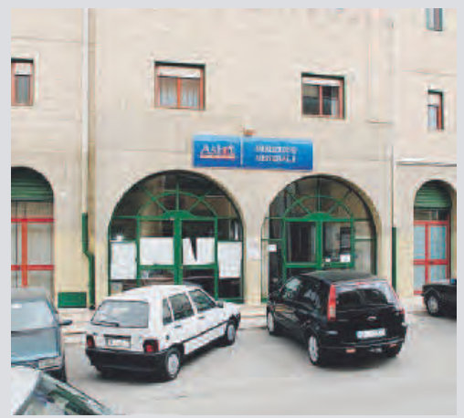
ANDRIA La sede dell'Asl Bat