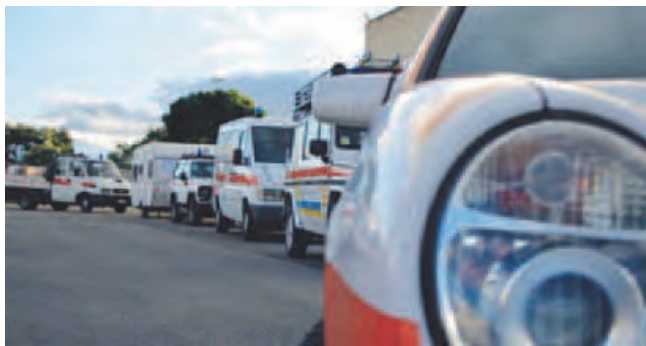
VOLONTARIATO La colonna mobile Misericordia regionale

le celebrazioni con la consegna degli attestati di partecipazione ai vari interventi dei volontari della Misericordia di Montegrosso, all'interno della colonna mobile regionale giunta nel centro Italia per prestare soccorso ed assistenza alle popolazioni colpite dal terremoto - dicono i