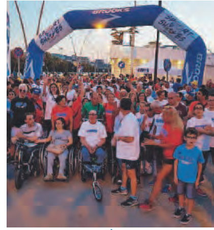
IMPEGNO E CIVILTÀ Tre momenti della gara organizzata dalla sezione di Barletta dei donatori di sangue