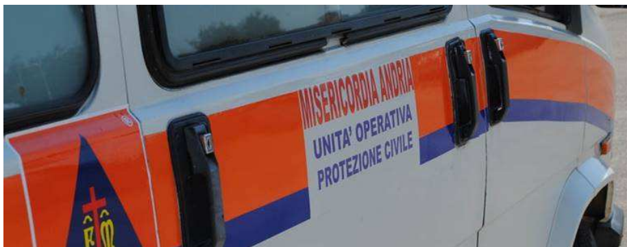
ambulanza misericordia andria

Nell'anno del 25esimo anniversario di fondazione della Confraternita Misericordia di Andria, arriva un'altra importante celebrazione per l'associazione di volontariato andriese: il terzo anniversario dal ritorno all'opera del distaccamento della Misericordia di Montegrosso. L'associazione che opera nei servizi di protezione civile, prima assistenza e formazione, con base operativa nella frazione andriese e diramazioni costanti nella città di Canosa, festeggerà il terzo anniversario all'interno della Parrocchia di “Gesù Giuseppe Maria” proprio a Canosa con una Santa Messa alle ore 19 di domenica 18 giugno. Il rito religioso sarà celebrato da Don Mario Porro storico correttore della Misericordia e sempre attivo attorno al giovanissimo gruppo di ragazzi nato con il distaccamento di Montegrosso.