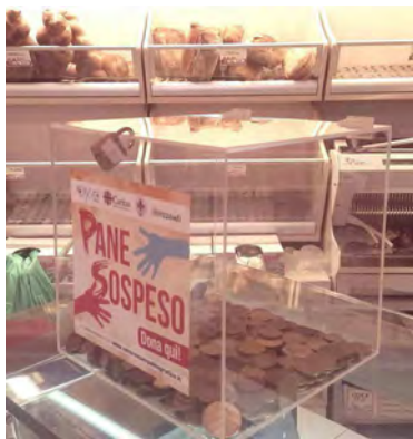
Pane sospeso

Con "Fà il bene e vinci, nello sport e nella vita", il coordinamento organizzatore intende diffondere queste buone pratiche a tutta la comunità e, sull'esempio della scuola primaria Giovanni Bovio, riproporrà un'incursione pacifica negli esercizi commerciali aderenti di coloro che hanno accolto l'appello a sostenere l'iniziativa benefica. I più piccoli delle società Green club, Soccer Ruvo, Real football e Centro sport, insieme ai giovani allievi della scuola di ballo Vivo latino, si incontreranno alle 17 in ciascuno dei cinque panifici della rete solidale per conoscere da vicino le modalità di sviluppo del Pane sospeso, presentate dai volontari e dai panificatori stessi.