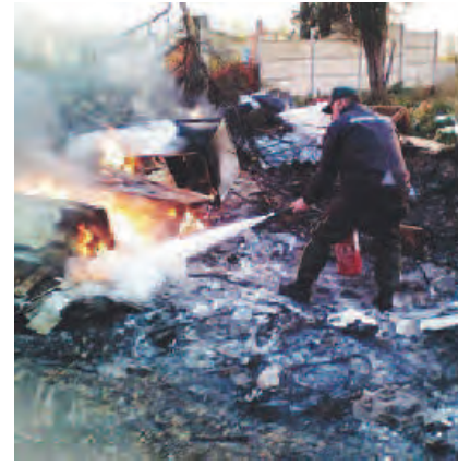
RANGER D'ITALIA Al servizio dell'ambiente

accaduto lo scorso anno con Valenzano, pattugliamo il territorio per segnalare illeciti o intervenire in caso di necessità, l'emergenza ultima ad esempio sono i roghi quasi quotidiani nel rione Japigia. Lo scorso anno con altre associazioni abbiamo gestito un