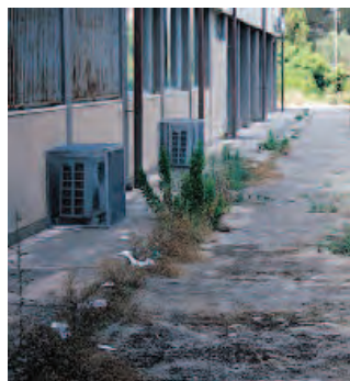
JAPIGIA «Sos» Polivalente

● Forte degrado al Polivalente, il comprensorio di istituti superiori alla periferia di Japigia nei pressi della tangenziale. Erbacce incolte, rifiuti a tappeto, ratti che scorrazzano anche di giorno, infrastrutture vecchie e in decadenza. È quasi finito l'anno scolastico, ma il degrado avanza e chi ci lavora e ci studia chiede soluzioni. La Città metropolitana replica: «Abbiamo erogato finanziamenti».