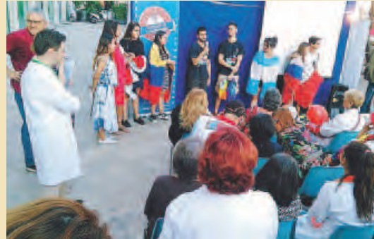
VOLONTARI La festa in piazza Libertà

● Si è conclusa con una buona partecipazione di pubblico la XI edizione della Festa delle associazioni di volontariato organizzata dal Centro di servizio al volontariato San Nicola. In Piazza Libertà cinquanta associazioni e centinaia di volontari hanno incontrato la gente e le istituzioni.