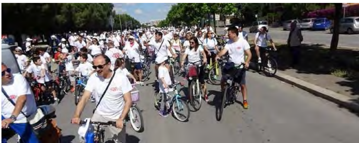
Bicicletтата Fidas

L'evento il 26 luglio in piazza Paradiso con una serie di iniziative