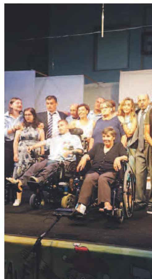
PROTAGONISTI Gli attori sul palco

Gli agenti, incompetenti, ma, particolarmente simpatici, svolgono le indagini ed interrogano tutti gli invitati. La cerchia dei sospettati si restringe su un imprenditore caduto in disgrazia ed un giovane immigrato, indagato dai poliziotti che non rifuggono ad un sentire comune che vuole tutti gli immigrati colpevoli di qualcosa, per il solo fatto di essere im-