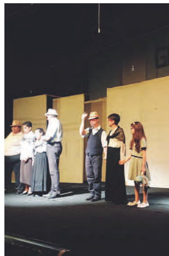
MESSAGGI SPECIALI Tanti i temi affrontati

E nonostante l'assenza di finanziamenti pubblici, il Giullare anche quest'anno è riuscito a camminare con le proprie gambe, superando egli stesso un oggettivo disagio e mostrando quanto, anche le barriere della burocrazia, sia possibile superarle con la forza della passione di chi crede sempre più fortemente in un progetto vincente.