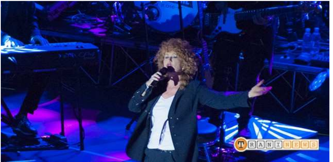
Fiorella Mannoia in concerto a Trani