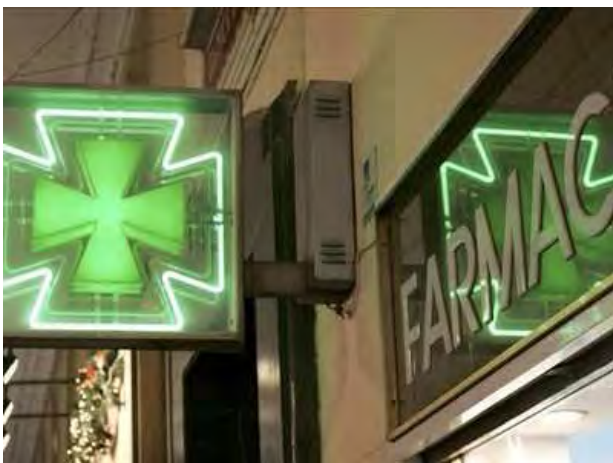
Una farmacia

L'iniziativa dell'Associazione “Nucleo Volontariato Città di Andria” sarà valida fino al 31 ottobre