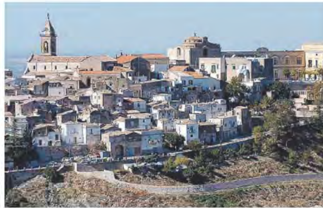
AVVIATE LE RICERCHE In alto la panoramica di Minervino. Sotto la tenenza dei carabinieri

Al momento, proprio perché il caso riguarda una donna adulta, la sua scomparsa viene considerata dagli investigatori come un allontanamento volontario.