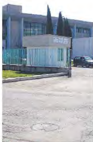
LA SCUOLA L'istituto «Lotti»