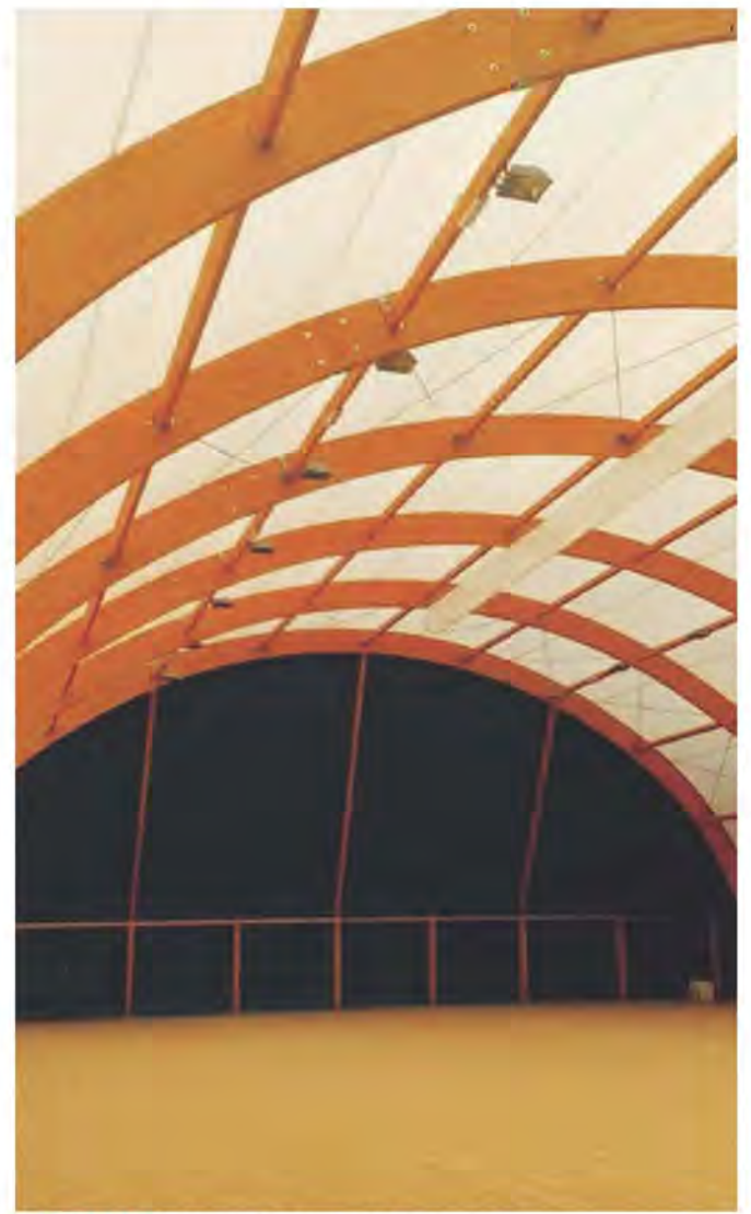
MONOPOLI L'interno dell'impianto tensostatico