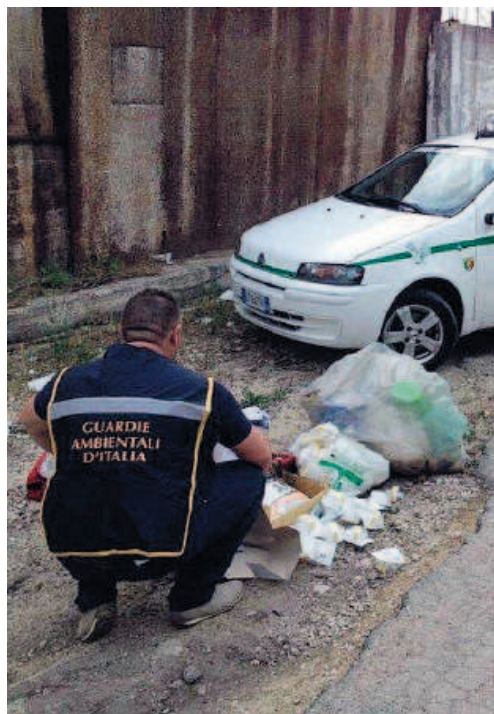
CORATO Le Guardie ambientali al lavoro