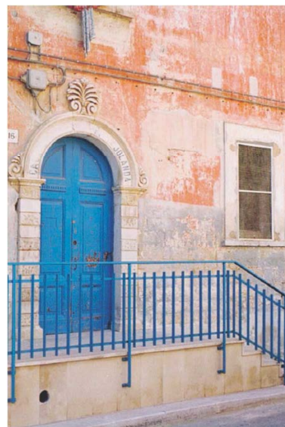
BISCEGLIE L'ingresso della «Principessa Jolanda»

La storica casa di riposo sin dal 1995 ha cessato la propria attività