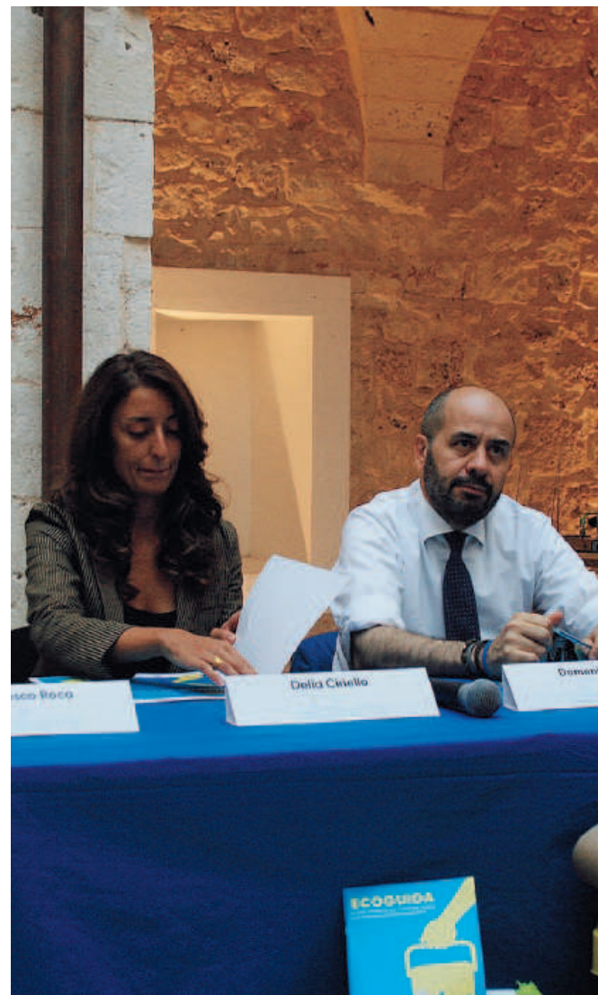
NOCI Un momento della presentazione della nuova raccolta dei rifiuti