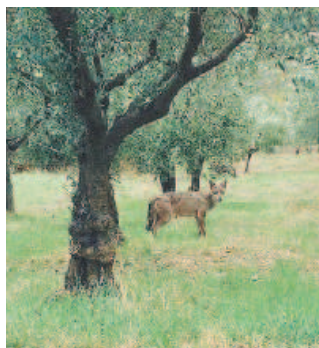
PROTETTO Esemplare di lupo

La guardia zoofila, oltre ad essere iscritta ad un'associazione animalista, riconosciuta, deve seguire un corso di formazione e superare un esame; quindi viene nominato dal prefetto, con la qualifica di guardia particolare giurata, figura normata dal Regio Decreto n. 773 del 18 giugno 1931 per lo svolgimento di servizi di tutela degli animali e dell'ambiente.