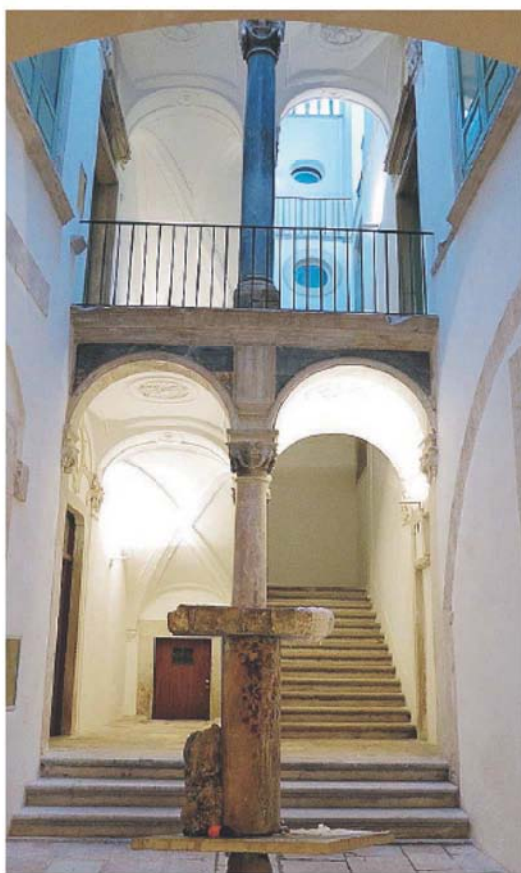
BISCEGLIE L'interno di Palazzo Tupputi

BISCEGLIE È IL TEMA DEL CONVEGNO INTERNAZIONALE CHE SI TERRÀ DAL 13 AL 16 SETTEMBRE A PALAZZO TUPPUTI E NEL TEATRO GARIBALDI