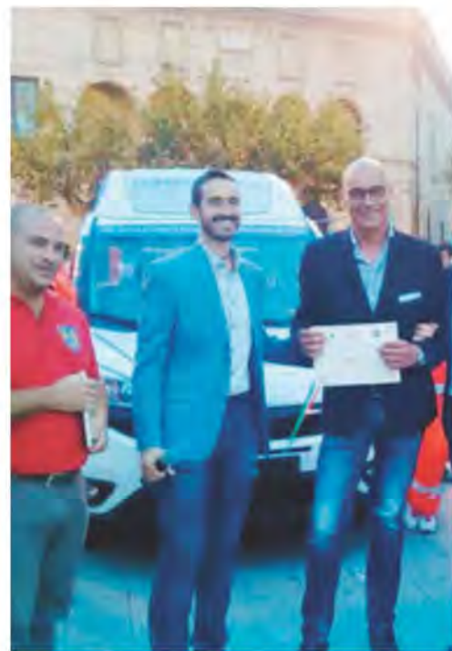
GIOIA DEL COLLE La consegna del taxi sociale