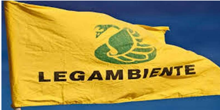
Legambiente - Cassano delle Murge ©

Al via la quinta edizione di: "Puliamo il Mondo", iniziativa creata da Legambiente