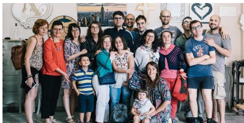
I ragazzi del Clad