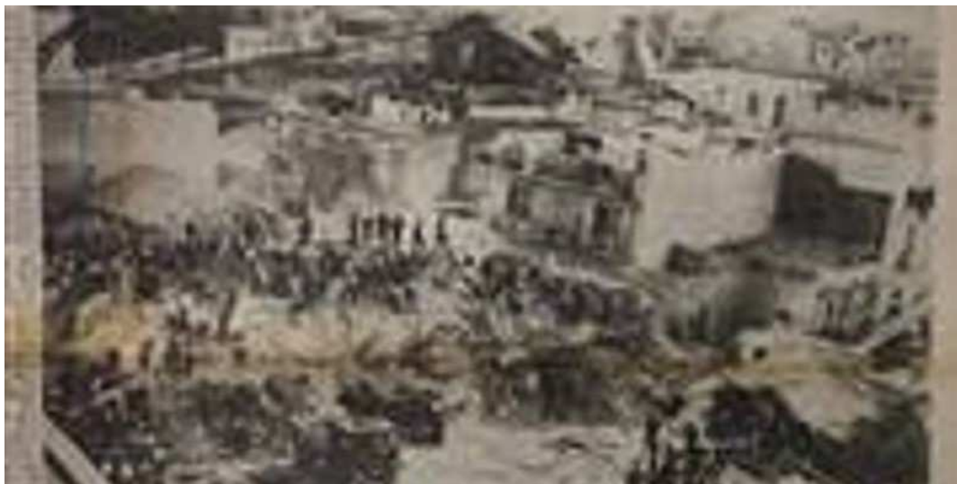
Locandina 57° anniversario crollo via Canosa

Le iniziative del Comitato Italiano pro Canne della Battaglia