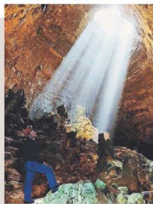
CONCORSO FOTO- GRAFICO Le grotte di Castellana