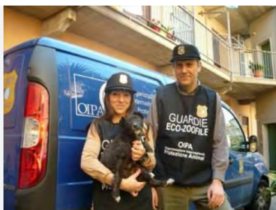
Guardie Ecozoofile OIPA

Dal mese di ottobre fino a metà dicembre saranno aperte le iscrizioni al 4° corso per Guardie Zoofile dell'OIPA Italia Onlus, per la provincia Bat. Le candidature dovranno preferibilmente pervenire a mezzo della compilazione (a mano o a mezzo Pc) del modulo scaricabile alla pagina FB delle Guardie Zoofile OIPA BAT, da trasmettere a mezzo mail o fax (recapiti nel modulo stesso). Qualora non si abbia dimestichezza con i mezzi informatici, si potrà preliminarmente trasmettere la propria candidatura all'indirizzo mail: guardiebat@oipa.org , indicando: Nome, cognome, recapito telefonico, email.