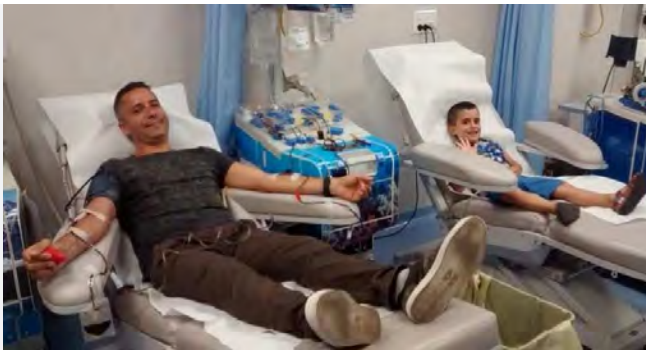
donazione sangue

Quest'oggi, alle ore 18.00, presso la sala conferenze “Padre Giandomenico” del Palazzo Marchesale di Santeramo in Colle si terrà il convegno “La cultura del dono - La donazione del sangue nella generazione dei Millennials”.