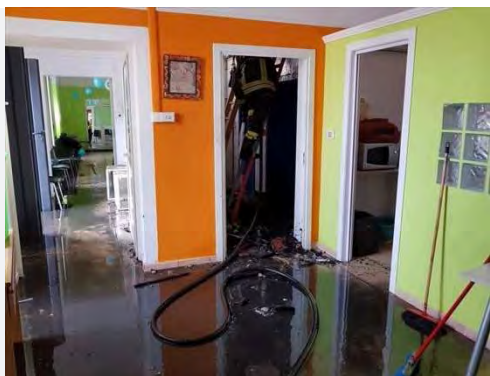
La sede dell'associazione danneggiata dall'incendio

Nel primo pomeriggio di ieri, un incendio, quasi certamente di origine dolosa, ha pesantemente danneggiato la sede dell'associazione "L'Anatroccolo - Onlus". La sede si trova in via Megra, dove è possibile vedere una finestra danneggiata attraverso la quale, con tutta probabilità, i delinquenti sono riusciti a penetrare nella struttura, che a quell'ora della domenica era chiusa.