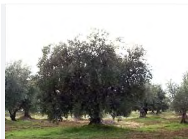
Camminata tra gli olivi ©

Ministero dell'Ambiente. La "Camminata tra gli Olivi", che si svolgerà contemporaneamente in 18 regioni italiane, coinvolgendo gli oliveti di 120 Comuni, è stata recentemente presentata nella sala conferenze dell'Assessorato all'Agricoltura della Regione Puglia a cui ha partecipato anche il comune di Cassano delle Murge in quanto rientrante nella rete Città dell'Olio oltre che aderente all'iniziativa. L'evento organizzato dal locale Circolo di Legambiente e dal Comune di Cassano delle Murge con il fattivo supporto dell'Oleificio Sociale di Cassano, l'Agriturismo Fasano e altre associazioni tra cui la Pro Loco "La Murgianella" avrà inizio dalle ore 9:00.