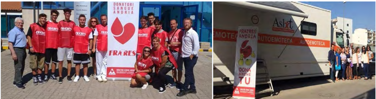
Raccolta sangue Fratres

Domenica 29 Ottobre, dalle ore 8.00 alle ore 11.30, un'autoemoteca sosterrà nei pressi della parrocchia Cuore Immacolato di Maria, ad Andria, per accogliere quanti vorranno contribuire, con la loro generosa disponibilità, a donare l'elemento "vitale".