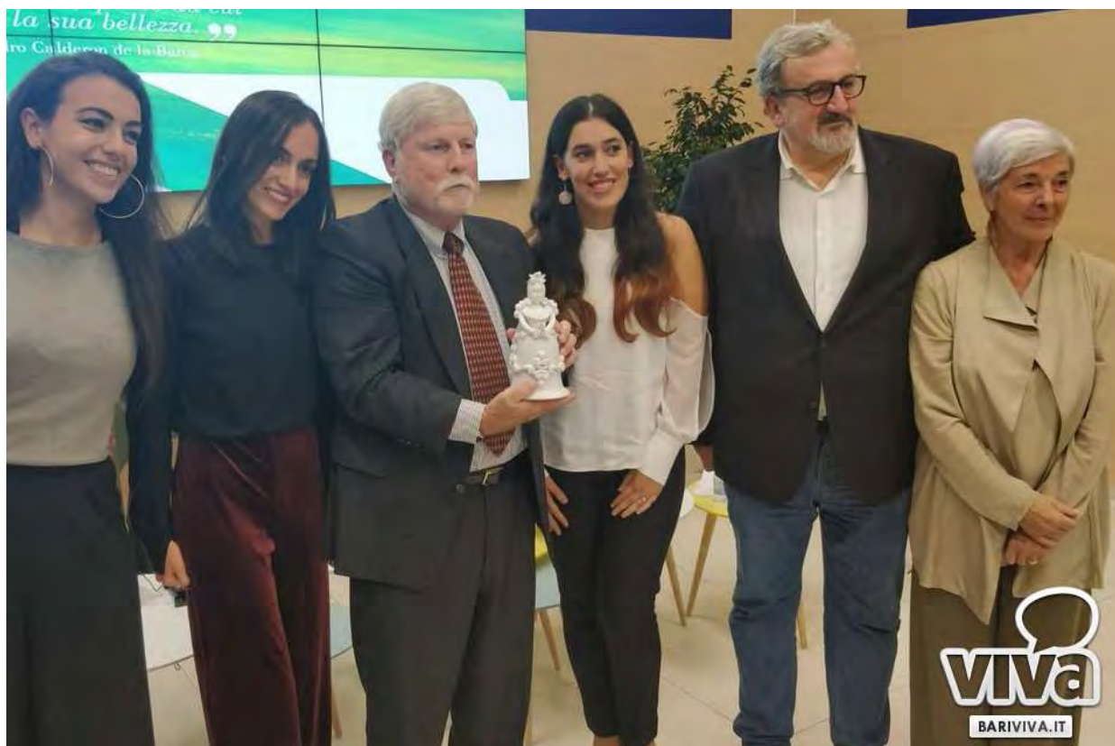
Premio Maria Maugeri, la cerimonia di consegna dei premi