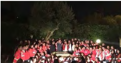
Tanti gli ospiti della serata