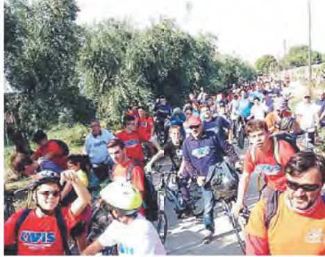
BARLETTA I partecipanti all'evento dell'Avis