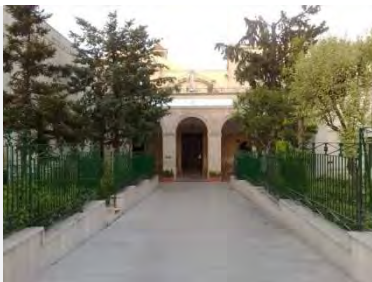
Casa di riposo San Vincenzo

Durate l'anno giubilare che ormai sta per terminare si sono svolti in tutto il mondo pellegrinaggi, convegni, festival e progetti volti a celebrare il carisma al servizio dei bisognosi fondato da san Vincenzo de' Paoli . Due gli episodi che nel 1617 furono decisivi per la vocazione del fondatore: la confessione di un contadino moribondo, che si lamentava dell'abbandono spirituale dei poveri, ispirò il "Primo sermone della Missione" che il Santo predicò a Folleville il 25 gennaio; nell'agosto dello stesso anno, durante la sua esperienza di parroco a Châtillon, san Vincenzo visse a contatto con la miseria e la povertà. Questi due eventi segnarono l'inizio del cammino della Famiglia Vincenziana. Solo pochi giorni fa, dal 12 al 15 ottobre, si è tenuto a Roma il " Simposio internazionale della Famiglia Vincenziana ", al quale hanno preso parte anche i nostri concittadini vincenziani. Da giovedì 26 ottobre a sabato 28, tutti i palesi potranno venerare le reliquie di san Vincenzo de' Paoli presso la cappella della casa di riposo che porta il nome del Santo.