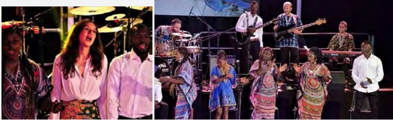
Maldafrica, in oltre 1500 al Palasport per ballare al ritmo di integrazione

Prima assoluta con oltre 1500 spettatori e l'unione di diverse culture all'interno del Palasport di Andria: questo è stato Maldafrica, dal nome del laboratorio musicale voluto dalla Confraternita Misericordia di Andria in collaborazione con un'associazione musicale, e con il coinvolgimento degli ospiti del Centro di Accoglienza Straordinario "Buona Speranza", con sede in via Vecchia Barletta.