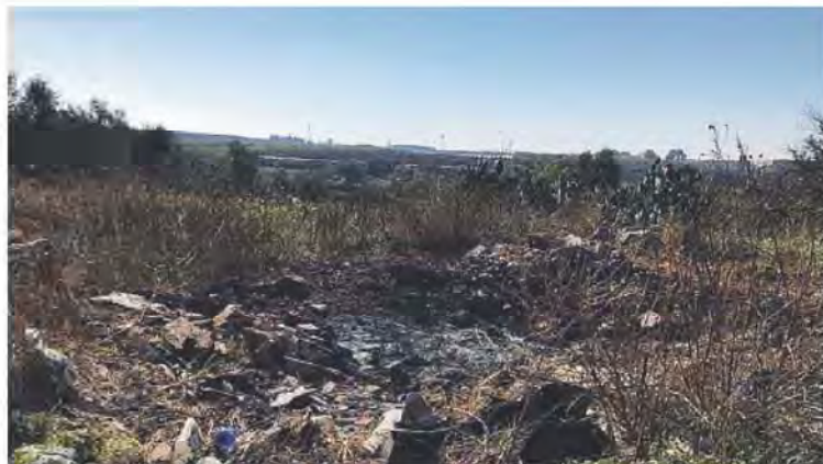
BITONTO A destra un incendio. Uno dei tanti roghi di rifiuti nelle campagne a ridosso della città. A sinistra una immagine «dopo la cura»