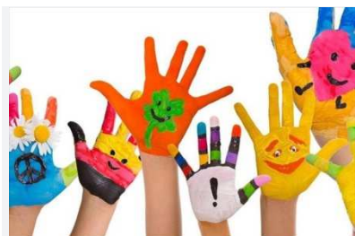
Settimana dell'Infanzia

Il 20 novembre, a conclusione della settimana dell'Infanzia sarà celebrata la Giornata Mondiale dei Diritti dell'Infanzia e dell'Adolescenza voluta dall'ONU sin dal 1989. "Infanzie: storie di infanzia" è il tema della settimana dell'infanzia a Bitonto. Obiettivo: suscitare riflessioni sull'unicità di ogni bambino, sulle diversità che devono essere percepite come una ricchezza che va riconosciuta e valorizzata, e non come fonte di discriminazione.