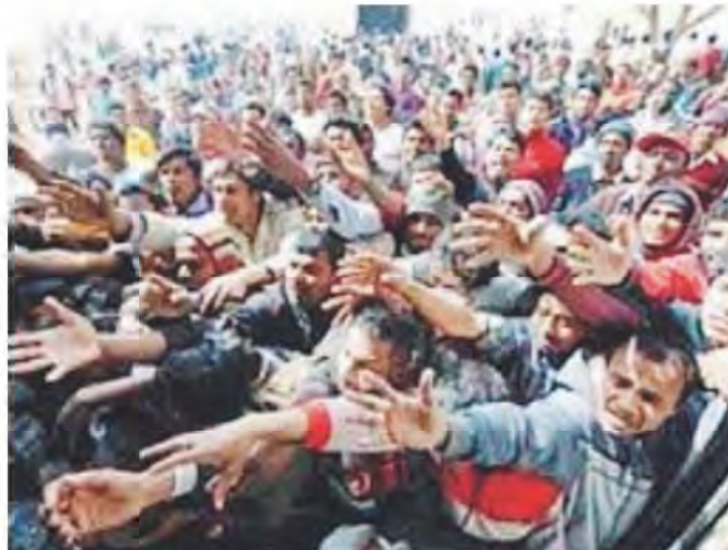
SENSIBILITÀ Mostra da non perdere

Questa mostra - spiegano gli organizzatori - è stata realizzata in occasione della manifestazione «Meeting per l'Amicizia fra i popoli», anno 2016. «Il problema dei migranti è sulla bocca di tutti. Fa discutere, e divide. I politici ne fanno buon uso pensando alle elezioni, l'opinione pubblica oscilla tra la paura dell'invasione e la disponibilità all'accoglienza, i media un po' raccontano è un po' strumentalizzano in varie direzioni. La mostra lancia una provocazione: proviamo ad affrontare l'argomento non anzitutto come un 'problema', scrivono in un comunicato.