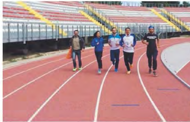
LA CORSA Matteo Renzi mentre corre sulla pista di Barletta

Va ricordato che l'intero stadio comunale «Puttilli» è stato sottoposto a opere di ampliamento della capienza dei posti nonché di lavori di ristrutturazione e adeguamento alla funzionalità e norme di sicurezza. Al momento è in corso l'iter burocratico per la rimozione dei vecchi spalti in muratura. Oltre alla pratica in itinere per l'elaborazione del progetto per l'agibilità. Mentre per quanto riguarda la suddetta pista di atletica, il Comune si è adoperato mediante la sottoscrizione di apposita convenzione per consentire l'uso parziale, cioè limitato alle attività di allenamento delle varie associazioni di atletica, fermo restando che l'attività medesima sarà sospesa in occasione dei lavori di rimozione dei vecchi spalti. A proposito è stato redatto ed elaborato un piano con una serie di prescrizioni ai fini della sicurezza.