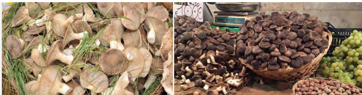
Funghi cardoncelli

Messe da parte – almeno per il momento – le polemiche , fervono in città i preparativi per l'imminente due giorni interamente dedicata alla Sagra del fungo cardoncello, prevista a Ruvo di Puglia sabato 11 e domenica 12 novembre.