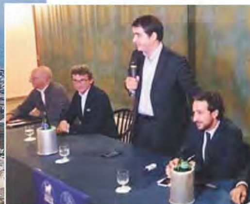
CAMPAGNA ELETTORALE Un momento della riunione a Barletta ed una veduta aerea