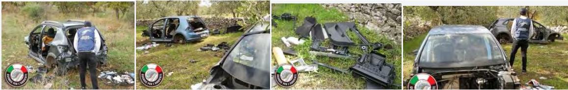
Auto cannibalizzate in contrada "Femmina morta"

Siamo a ridosso del confine di Corato con Andria, in contrada "Femmina morta". Mentre alcuni contadini erano intenti di buon'ora a raccogliere le olive, le guardie si sono appostate per sorprendere le decine di bracconieri che in questo periodo si riversano indisturbati sulle nostre campagne.