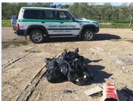
Le Guardie Ambientali d'Italia