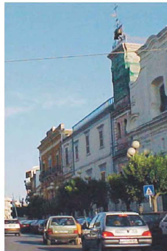
CENTRO La zona di piazza Plebiscito

Chi vuole, quindi, può iscriversi compilando il modulo consultabile all'indirizzo http://bit.ly/2xzbclO o chiedendo informazioni alla vostra AVIS di riferimento». Info e contatto: segreteria provinciale all'indirizzo email bat.provinciale@avis.it o sulla pagina facebook «AVIS Provinciale BAT.»