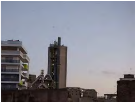
cementeria Buzzi Unicem