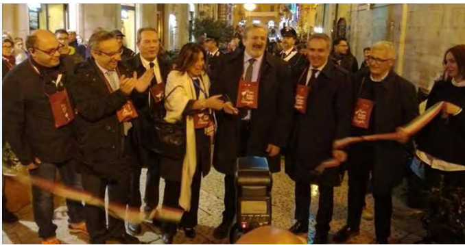
Calici nel Borgo Antico 2017

A scriverlo sono i vertici dell'associazione Borgo Antico che ha organizzato l'evento.