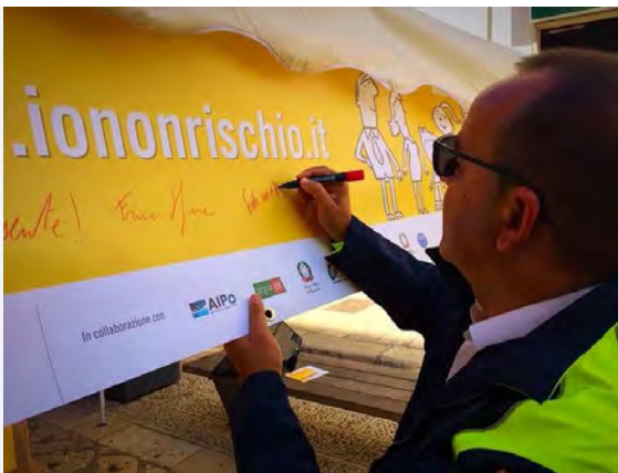
Io non rischio

Il dipartimento della protezione civile promuove e realizza, per il settimo anno consecutivo, la campagna "Io non rischio", dedicata alla cultura della prevenzione dai rischi. Il progetto mira a stimolare il ruolo attivo delle comunità nella quotidiana azione di prevenzione, attraverso un percorso di conoscenza e consapevolezza guidato dal volontariato di protezione civile.