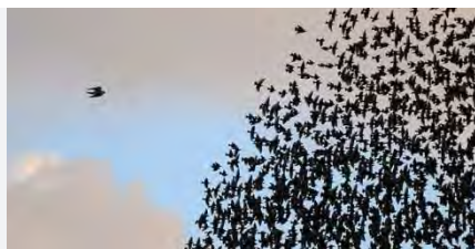
Stormo di storni

“Fatta salva l'eventualità che una grande concentrazione di storni possa provocare danni alle coltivazioni agricole – commenta il WWF in una nota inviata in re Redazione - questa bellissima specie di uccelli che disegna piroette nei cieli, risulta fondamentale per il mantenimento della biodiversità in Puglia”.