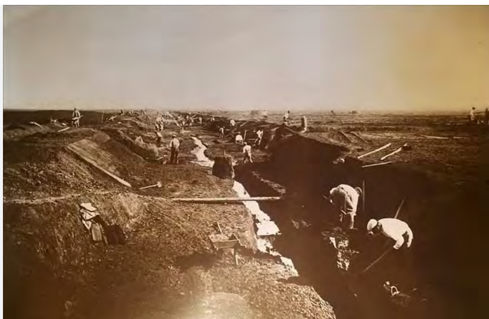
Foto d'epoca di una fase del cantiere della sistemazione idraulica del Vallone della Silica

Il locale Circolo Legambiente, su proposta della locale sezione delle Giacche Verdi, propone per domenica mattina di "strappare all'incuria un altro piccolo pezzo del nostro territorio e della nostra storia: il Vallone della Silica, meglio noto come "La Bonifica".