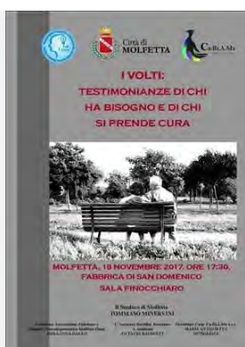
Locandina dell'evento

Attraverso immagini e parole, i partecipanti all'evento avranno la possibilità di comprendere cosa sia la malattia di Alzheimer e le demenze correlate dal punto di vista dei pazienti e di coloro che se ne prendono costantemente cura. L'evento sarà un vero e proprio viaggio emotivo per comprendere come ci si sente a vivere costantemente con problemi relativi a memoria, linguaggio, orientamento spazio-temporale, per dar voce non solo agli addetti ai lavori, ma a chi usufruisce dei servizi offerti Cooperativa Ca.Ri.A.Ma a r.l. e dall'Associazione Alzheimer e Malattie Neurodegenerative Molfetta Onlus, sempre attente ai bisogni crescenti dei suoi utenti.