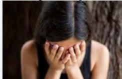
Violenza sulle donne © n.c.

Gli appuntamenti in calendario, con l’intento di offrire maggiori opportunità di riflessione, informazione e conoscenza alla cittadinanza, sono stati pensati per sensibilizzare tutte le fasce di età alla prevenzione della violenza di genere, attraverso un programma che fa parte del progetto “Fenice”, finanziato dalla Regione Puglia, cofinanziato dall’Ambito Territoriale Corato-Ruvo-Terlizzi e attuato a Corato dal Centro antiviolenza “Riscoprirsi...” di Andria.