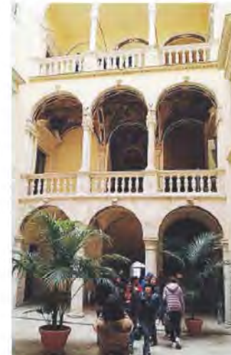
CULTURA Il Palazzo

Ma non è tutto. Lamentele giungono anche per «la assoluta sporcizia in cui versa la strada laterale di Palazzo della Marra - ha precisato un turista - Mi auguro che i vigili urbani multino coloro che con i loro cani rendono la strada un pessimo luogo». Tutto chiaro?