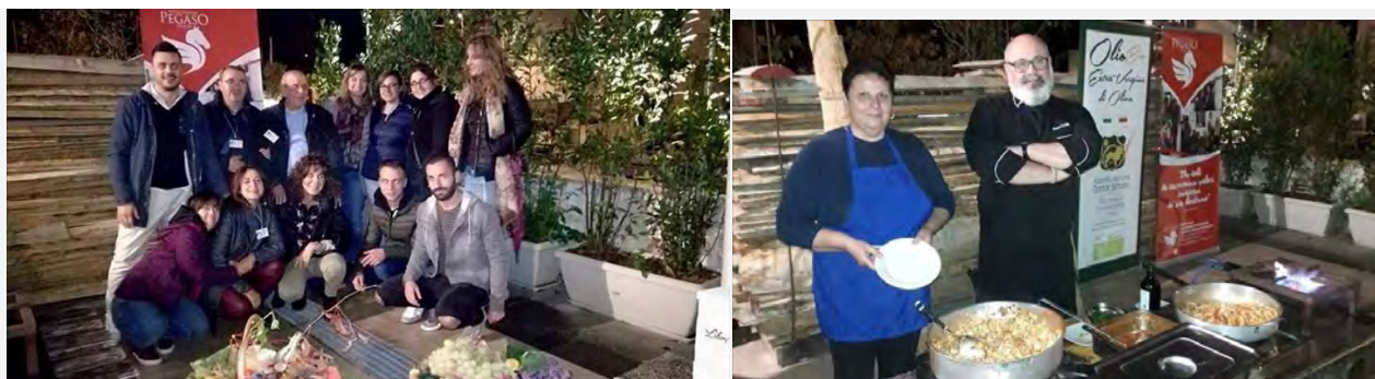
Casa Pegaso a Calici nel Borgo Antico

E' quanto si legge nella nota diffusa dalla stessa associazione benefica biscegliese.