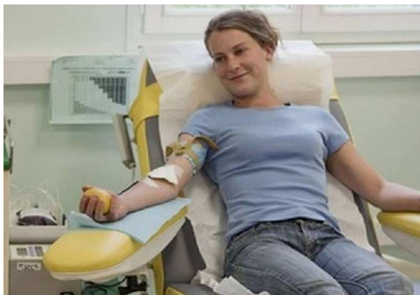
donazione del sangue

L'associazione ha organizzato l'appuntamento per contribuire localmente all'emergenza sangue che sta interessando la regione nelle ultime settimane. L'appuntamento è presso il centro trasfusionale del Sarcone domenica 18 febbraio dalle 8 alle 11.