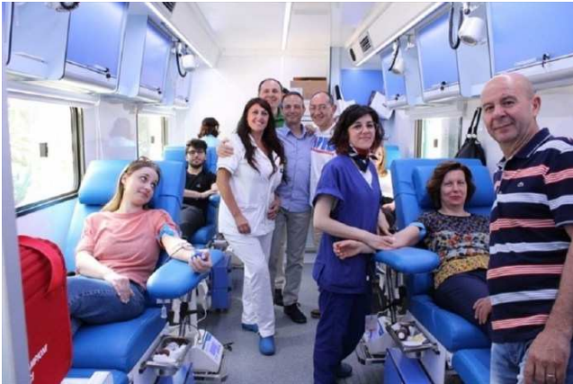
Donazione straordinaria del sangue: raccolte 40 sacche

Un'iniziativa organizzata dalla Confraternita del SS Sacramento assieme all'AVIS Corato