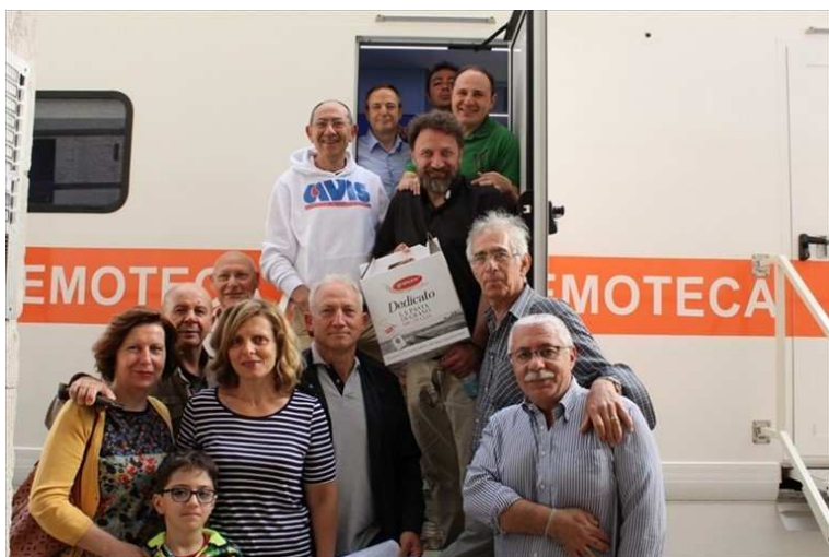
Dalle confraternite all'Avis, quando il dono si tinge di rosso

La giornata è stata diretta dal Centro trasfusionale dell'ospedale Bonomo di Andria e Asl Bt.