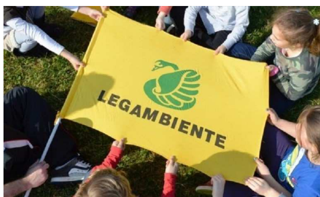
Bandiera di Legambiente

«Domani, sabato 16 giugno - si legge in una nota del circolo - torna l'ultimo appuntamento con la nostra prima Rassegna Ambientale.»