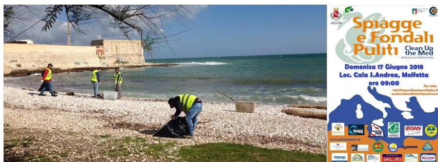
Operazione "Spiagge e fondali puliti"