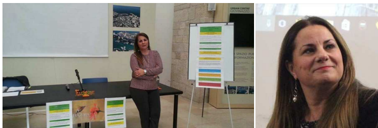
Corsina Depalo © Nc