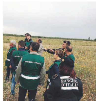
RANGERS D'ITALIA Volontari per la tutela ambientale