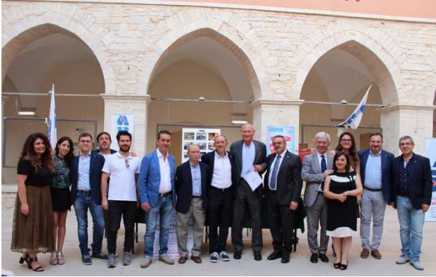
L'AVIS consegna le benemerenze a 160 donatori di sangue

Si tratta di persone dai 18 agli oltre 65 anni, che donano sangue in modo gratuito, anonimo e volontario, rappresentando la faccia più bella della nostra città