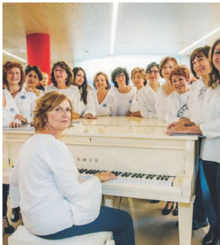
FORMAZIONE Le 18 componenti del Coro Gabriel