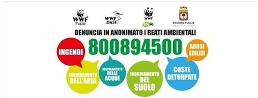
Numero verde reati ambientali

Questo servizio - si legge in una nota - permette ai cittadini, dal 15 giugno al 15 settembre, dal lunedì alla domenica, dalle ore 9,30 alle 18,30, di segnalare le situazioni di emergenze ambientali che riscontrano sul territorio lungo tutto il litorale pugliese, inviando anche foto e video. Attive una pagina Facebook 800894500 e una mail 800894500wwf@gmail.com . La sede del numero verde è a Giovinazzo presso la Vedetta sul Mediterraneo (Vico Marco Polo 11) un edificio demaniale che è tornato a vivere grazie alla sinergia con il mondo del volontariato.