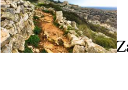
Zappatore Lorenzo (Polo Professionale Luigi Scarambone, Lecce) – Scorcio rupestre sul mare