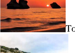
Tondo Giulio (Liceo Giuseppe Palmieri, Lecce) – Alba dei popoli