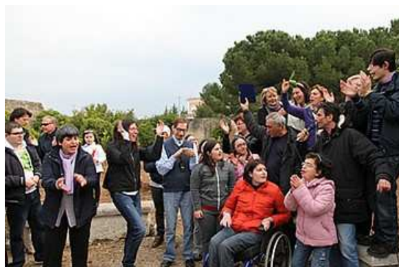
TRANI - GIOVEDÌ 7 GIUGNO 2018