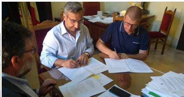
La sottoscrizione del protocollo d'intesa