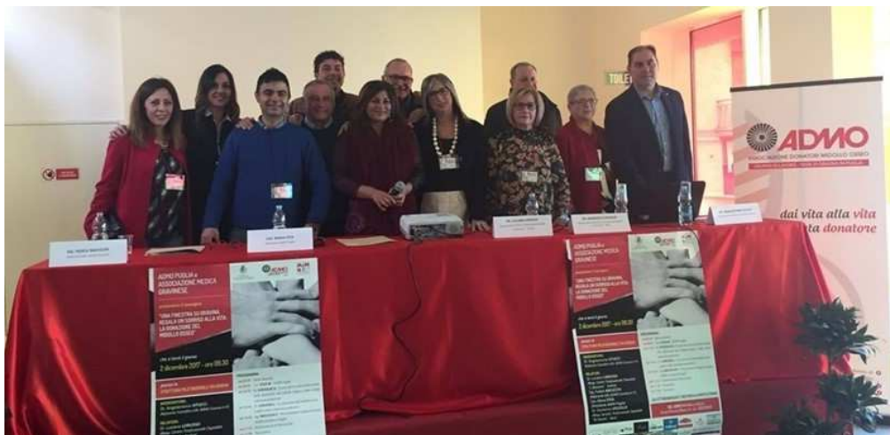
Convegno Admo Gravina

Volontari del gruppo di lavoro presenti in fiera per diffondere la cultura della donazione del midollo osseo