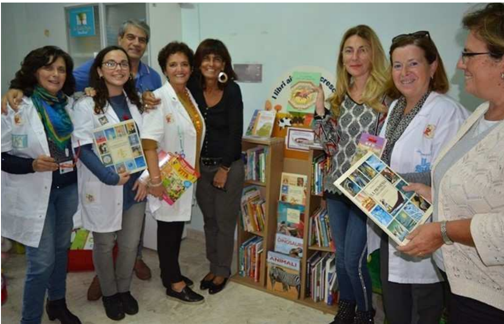
Nell'ospedale pediatrico Giovanni XXIII nasce la biblioteca dei bimbi

L'iniziativa promossa dalle librerie "Giunti al Punto", ha visto protagonista Granoro in collaborazione con l'associazione di volontariato "Libri su Misura"