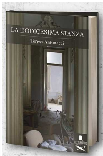
La dodicesima stanza