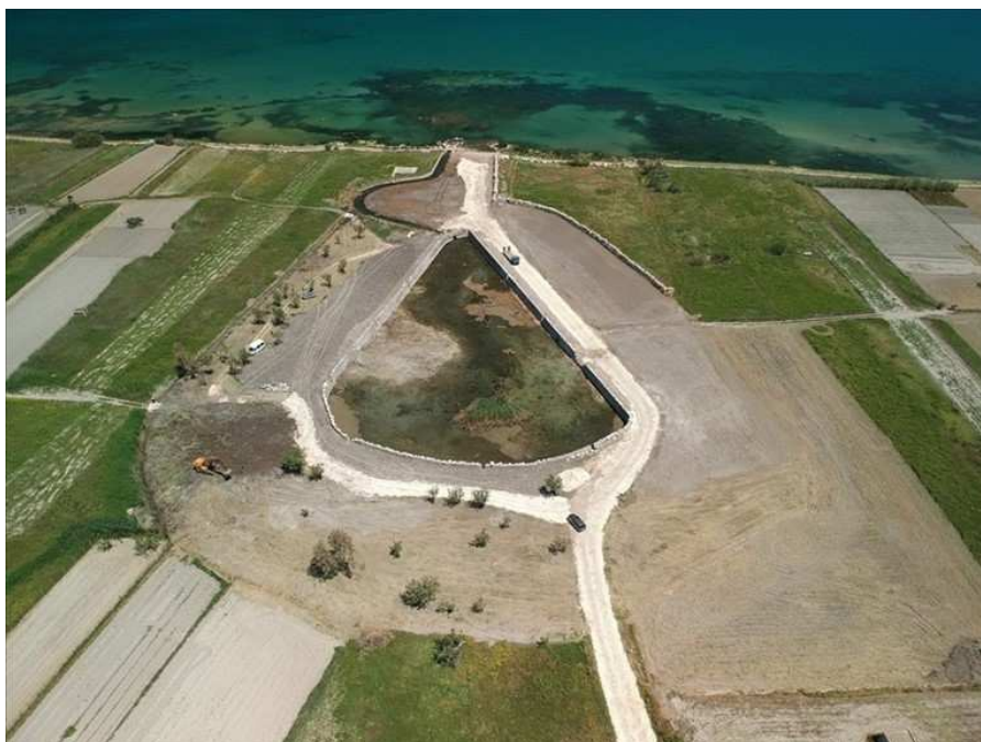
Boccadoro © n.c.

Gli appuntamenti, ci offriranno l'occasione di scoprire oltre il periodo estivo, uno degli scorci più belli della costa tranese, che in questo periodo autunnale si caratterizza di colori e sapori tutti da vivere