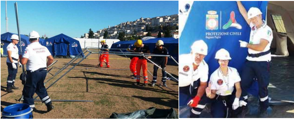
Nucleo Volontariato città di Andria

Il Nucleo Volontariato Città di Andria ha una nuova sede. Nell'attuare un processo di radicale rinnovamento e potenziamento della propria organizzazione, venerdì 19 ottobre alle ore 18,00 sarà inaugurato il nuovo presidio operativo di Protezione Civile, presso la struttura di pattinaggio di Andria, in corso Europa Unita, n. 2, immobile offerto in comodato d'uso dall'Amministrazione Comunale per una maggiore partecipazione nell'attività di Protezione Civile del nostro territorio.