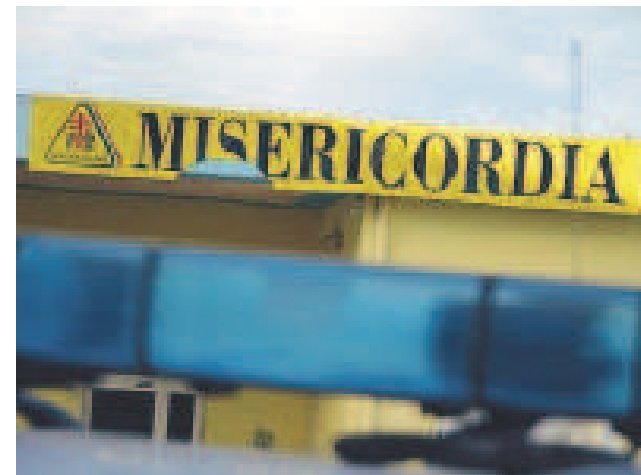
SERVIZIO CIVILE Misericordia

● ANDRIA. Si terranno il 25 ottobre prossimo, all'interno della sede della Confraternita Misericordia di Andria di via Vecchia Barletta 206, le selezioni per i 24 posti disponibili per l'anno 2018 del Servizio Civile Universale con l'associazione di volontariato andriese. Sono 129 le domande ricevute da parte dei candidati aventi diritto e che saranno selezionati per gli 8 progetti approvati dal Ministero, tra le sedi di Andria e Montegrosso, per il tramite della Confederazione Nazionale delle Misericordie d'Italia. Il maggior numero di domande, ben 52, sono giunte sul progetto "Dona il tuo tempo", mentre ben 28 le candidature per "Medicina Solidale II" che prevede la partecipazione alle attività dell'Ambulatorio Solidale "Noi con Voi." Sono 15, invece, le candidature per "Maldafrica." Diverse anche le candidature ricevute per "Resilienza città in prima linea" e "Sognate cose grandi" tra le sedi di Andria e Montegrosso per chi-