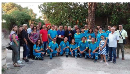
Oasi Misericordia a Bitonto

Centro dedicato alla accoglienza di migranti e persone che versano in condizioni di difficoltà