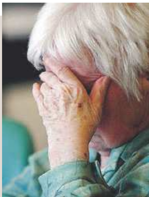
Un paziente Alzheimer