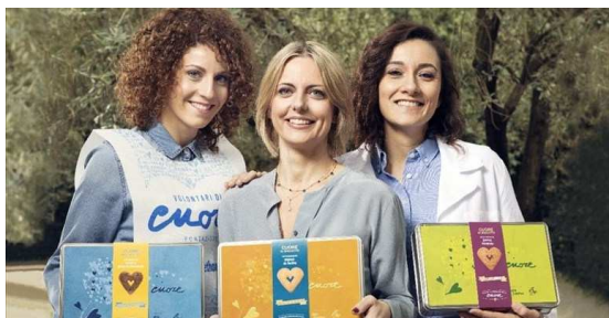
I cuori di biscotto di Telethon per la ricerca scientifica

Sabato 4 e domenica 5 maggio sotto il porticato del Municipio per sostenere la campagna “Io per lei” a favore della ricerca scientifica sulle malattie genetiche rare e neuromuscolari