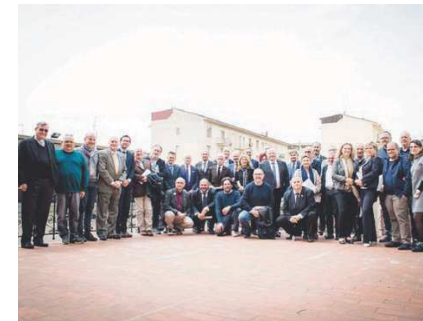
INSIEME Il gruppo di «Misericordia e Solidarietà»

Tra i fondatori, oltre alla Confederazione Nazionale delle Misericordie D'Italia e alle Federazioni regionali tra cui la Federazione delle Misericordie di Puglia, la Croce Bianca Milano con trentasette sedi operative, associazioni aderenti a FVS, Federazione Volontari del Soccorso, che contano circa settanta associazioni e Cipas, associazione di secon-