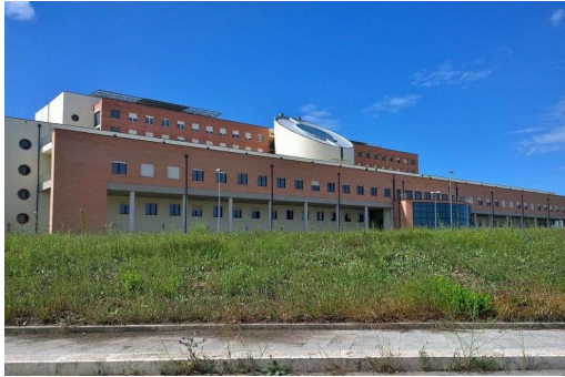
Ospedale della Murgia "F. Perinei" - Ospedale e Sanità