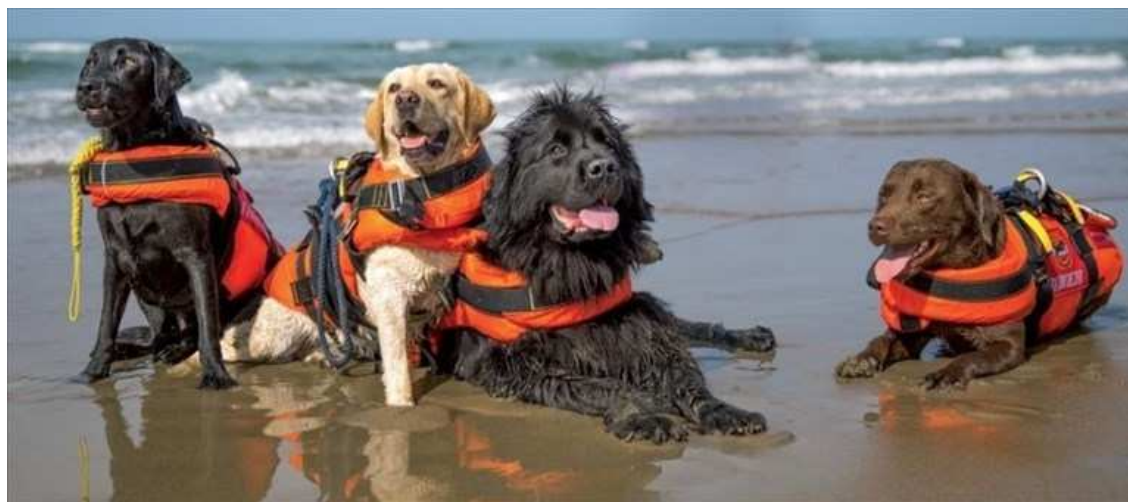
Cani bagnino

E a partire dal 16 giugno riprenderà il servizio di salvataggio in mare e quello di accoglienza per le persone con disabilità, in programma ogni domenica d'estate