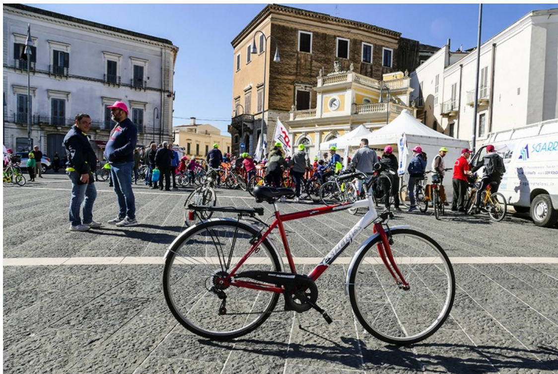
Una domenica di corsa con il Gruppo Sportivo Ciclo Avis di Andria.