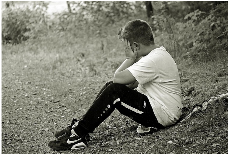
Minori a rischio devianza