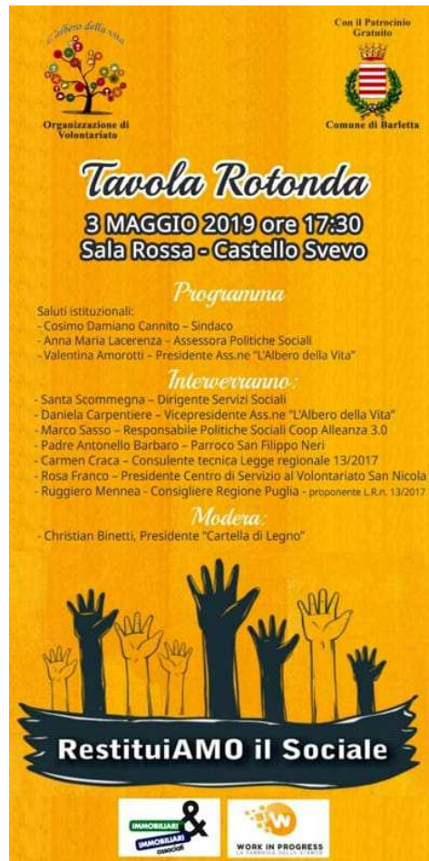
Tavola rotonda RestituiAMO il Sociale

L'Associazione di Volontariato "L'Albero della Vita", che si ispira ai valori basilari della centralità della persona umana, della sua dignità e dei suoi diritti, della solidarietà umana, della condivisione, dell'accoglienza fraterna e del volontariato, dopo un anno di attività del Centro Polifunzionale "Fatti Mandare dalla Mamma", operativo a Barletta in Via G. Cataneo n.33 A/B, è lieta di organizzare una tavola rotonda dal titolo "RestituiAMO il Sociale" che si terrà venerdì 3 maggio 2019, alle ore 17,30, presso la Sala Rossa del Castello Svevo di Barletta.