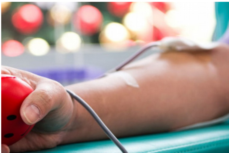
Donazione del sangue