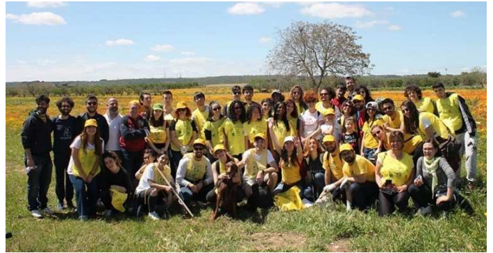
I partecipanti alla Domenica Ecologica