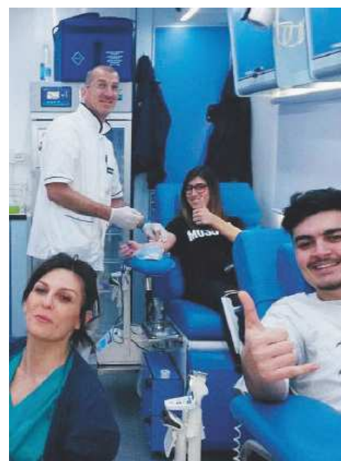
GESTO NATURALE Alcuni giovani che donano sangue