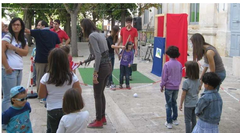
Fantaroa con i ragazzi della C.A.Sa

Le attività per bambini si svolgeranno per la prima volta nell’atrio del Palazzo Marchesale.