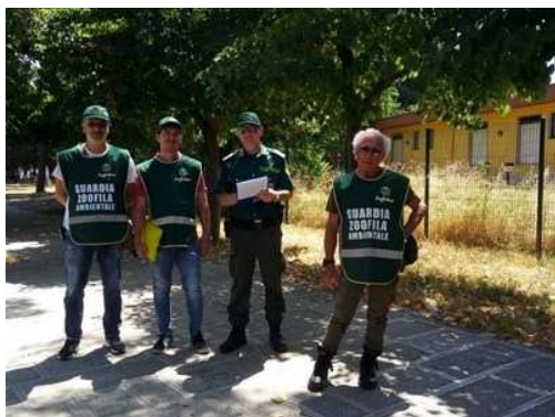
Avviato il Servizio cittadino delle Guardie Giurate Volontarie Zoofile di FareAmbiente