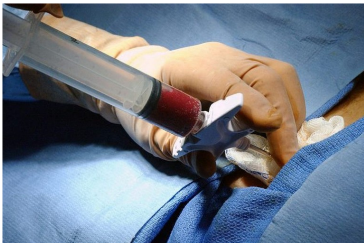
Donazione di midollo osseo