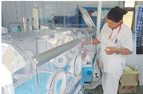
VOLONTARIATO Il reparto di Ostetricia. In alto, l'ingresso del «Bonomo»