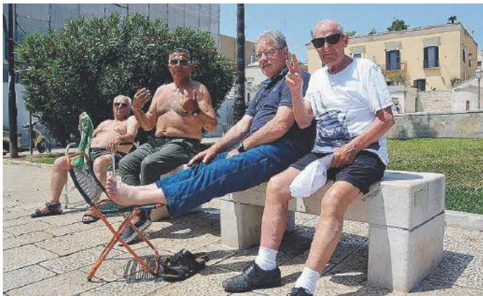
AL CALDO MA SORRIDENTI Un gruppo di baresi «doc»

NON SOLO FARMACI - Il «pony della solidarietà» è a disposizione per la consegna a domicilio di viveri e medicinali per gli anziani over 65 anni, soli e ammalati. Il servizio, precisano dall'assessorato al Welfare, è garantito solo da personale munito di tesserino di riconoscimento. Dal 1° luglio al 31 agosto, inoltre, sarà attivo il programma «Farmaciaestate», promosso da Federfarma: anziani