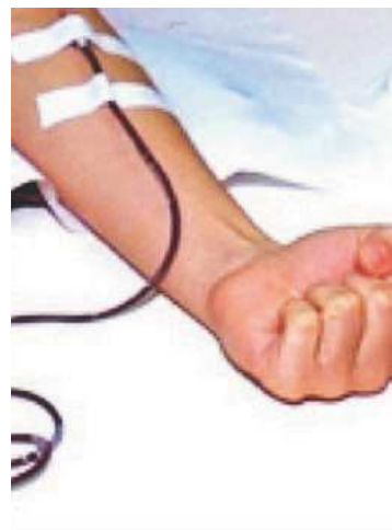
VITA L'autoemoteca dove si svolgerà la donazione

Donare il sangue fa bene a tutti, fa bene a chi lo riceve, soprattutto, ma anche a chi lo dona poiché permette di tenere costantemente monitorato il proprio stato di salute.