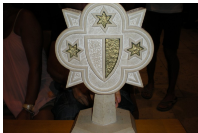
La formella del palio