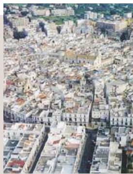
PUTIGNANO Una panoramica