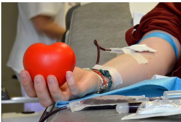
Domani giornata della donazione