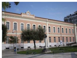
Scuola D'Azeglio © nc

La realizzazione di questo progetto è circoscritta a tutte le associazioni operanti sul territorio comunale destinate a rientrare tra gli enti del Terzo settore