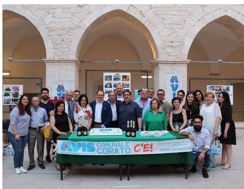
Benemerenze Avis, premiati studenti e donatori

Domenica 16 giugno nel chiostro del Palazzo di città si è tenuta la consueta consegna delle benemerenze Avis e delle borse di studio agli studenti-donatori dell'ultimo anno di scuola superiore che si sono distinti per merito